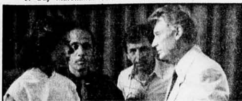
Fanny Ardant et Johnny Hallyday.