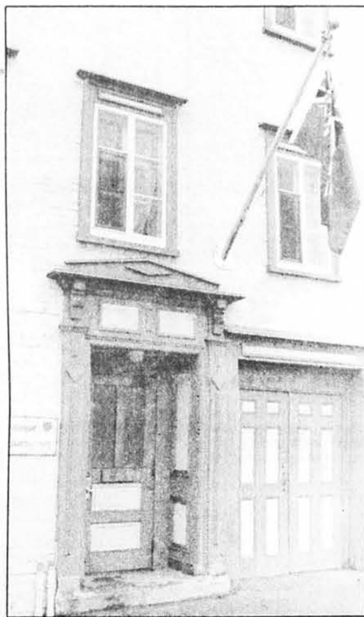
L'Ontario a choisi cet édifice, dans le Vieux-Québec, pour installer sa représentation.

Signe des temps : le Bureau de l'Ontario loge dans la mai-