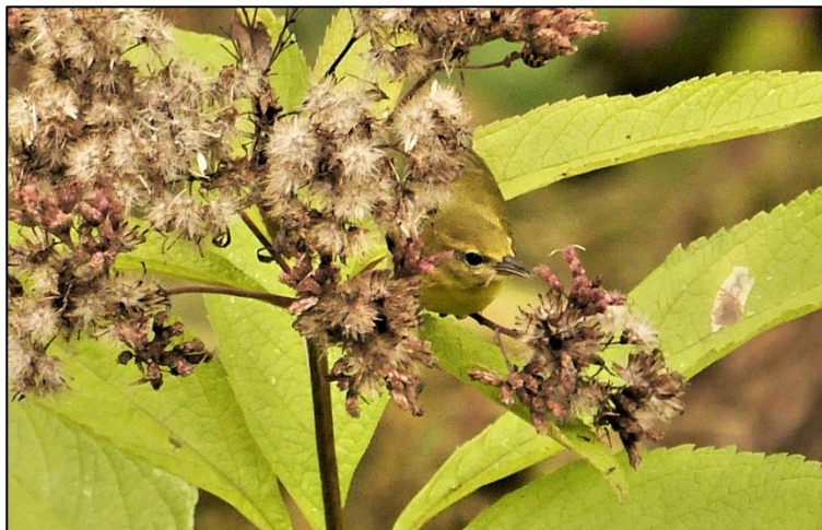
Fig.1 – Paruline obscure sur un plant d'aegopode.

Dans le stationnement, prenez le temps de bien observer les alentours et d'écouter les cris et chants; le Moqueur chat et quelques Bruants chanteurs s'y trouvaient les deux fois que j'y suis allé. Une Buse à queue rousse nous a aussi fait cet honneur en septembre dernier. Le sentier, qui fait approximativement un kilomètre, longe la rive ouest de la rivière Yamachiche. Au départ, une clairière est un lieu propice pour divers bruants, chardonnerets et juncos.