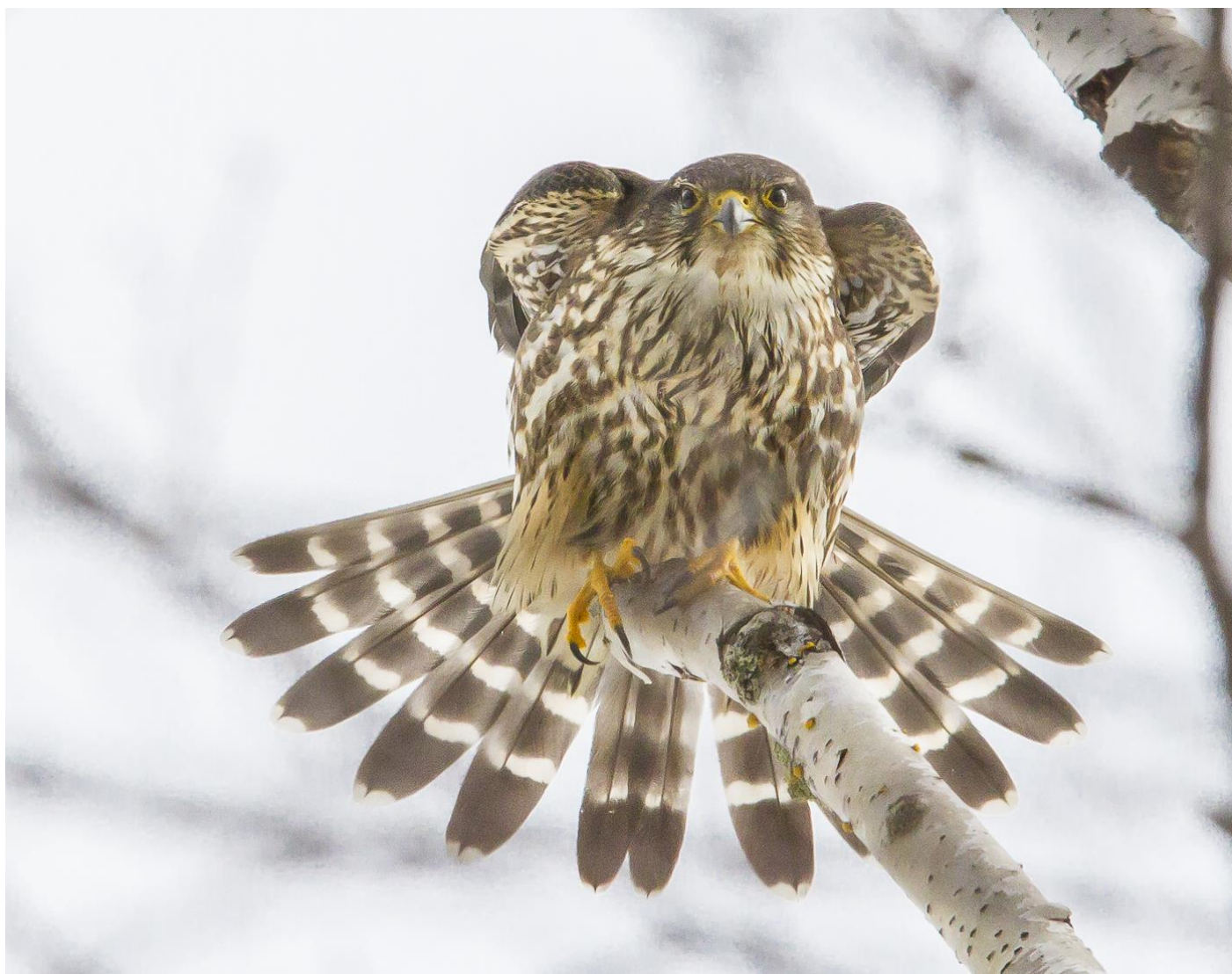
Faucon émerillon