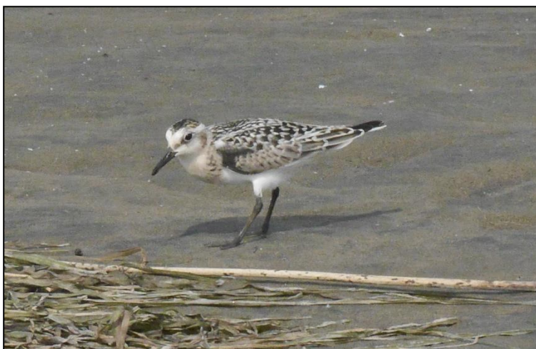
Fig. 3 – Bécasseau sanderling juvénile.

Rendus aux rives du lac, il y a plusieurs autres observateurs, et pour cause! Les berges grouillent de petits oiseaux qui courent vite et s'envolent spontanément mus par je ne sais quel signal. Ils ne se posent pas très loin pour s'envoler quelques minutes plus tard et revenir à peu près au même endroit. Une bûche ou une pierre près du bord de l'eau sont bienvenus pour poser son postérieur et attendre que ces volatiles passent à proximité.