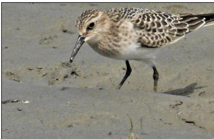
Fig. 4 – Bécasseau de Baird.

Le Cormoran à aigrettes passe en volant le long du lac, et quelques Bernaches du Canada voguent le long des roseaux. Les sempiternels Goélands à bec cerclé sont parfois accompagnés par le Goéland argenté ou le Goéland marin. J'espérais y voir une Barge hudsonienne ou une Barge marbrée, car on en avait signalé un peu auparavant, mais ni l'une ni l'autre n'étaient au rendez-vous. Par contre, un Faucon émerillon et un Épervier brun se sont ajoutés à la liste.