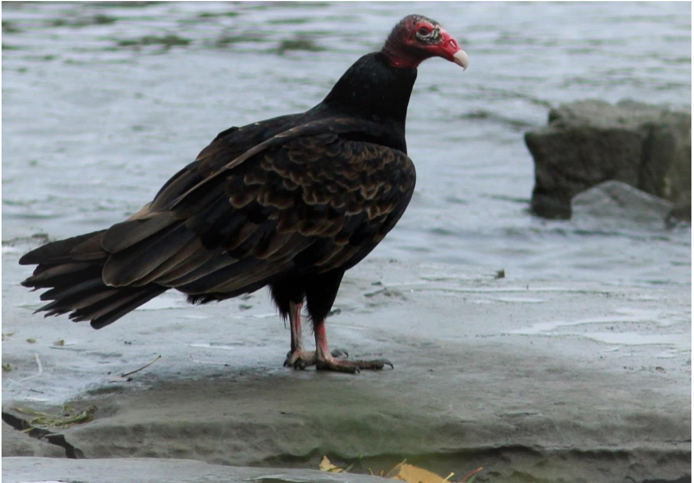
Urubu à tête rouge, octobre 2021

PAR M.GIROUX, L.DE LONGCHAMP, N.BÉLANGER