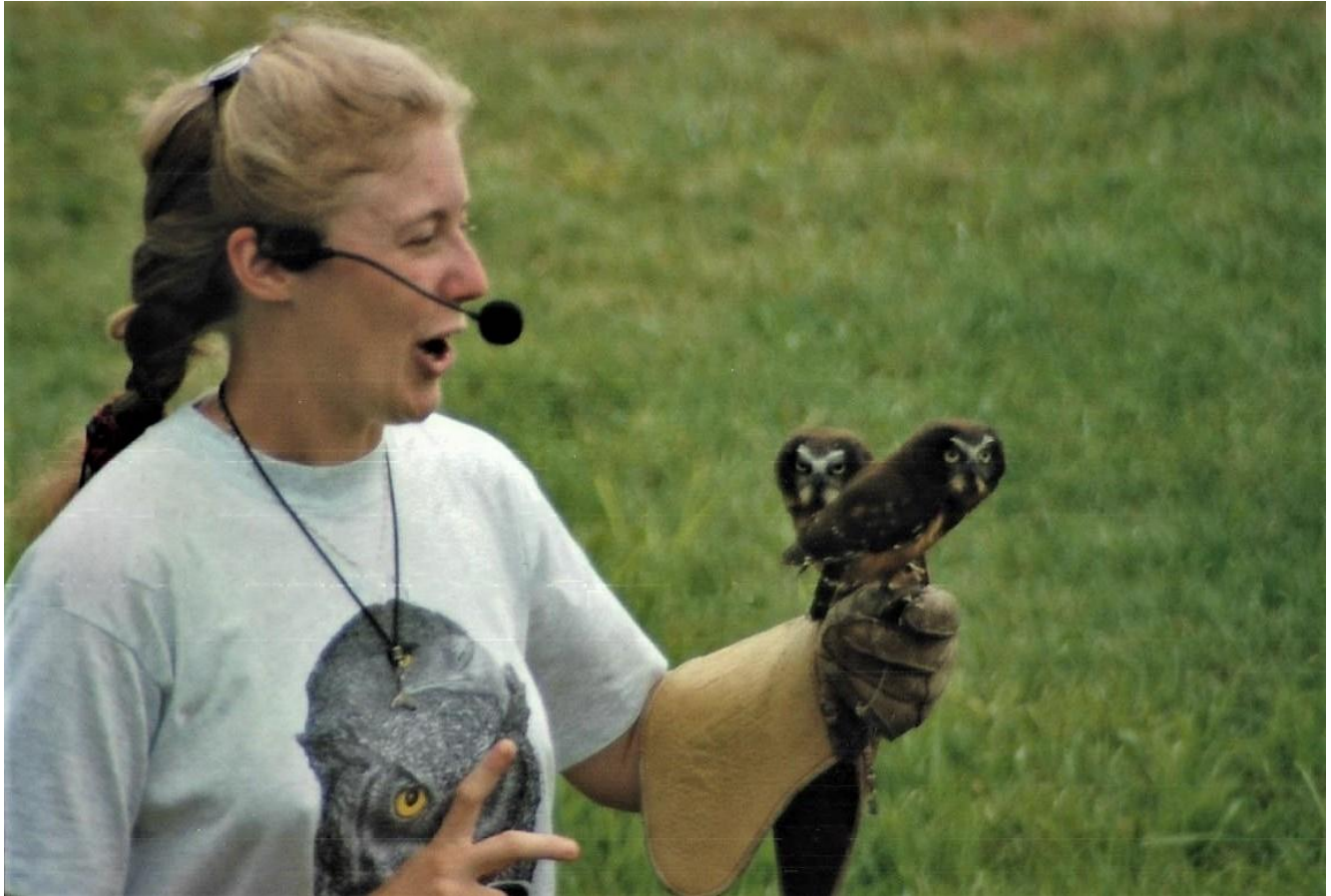
Petites Nyctales à l'UQROP dans les années 2000