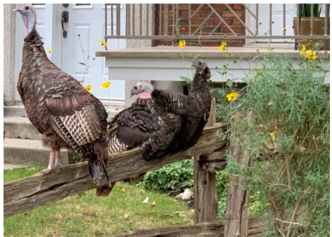
Dindons sauvages, octobre 2021