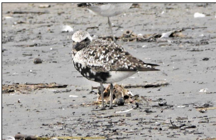
Fig. 5 – Pluvier argenté femelle.

Une fois parvenus au stationnement, un Merle d'Amérique et deux corneilles sont venus nous remercier de notre visite. « Vous reviendrez n'est-ce pas? » Bien sûr!