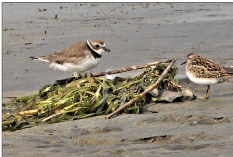
Fig. 2 - Pluvier semi-palmé et Bécasseau minuscule.

Bientôt le couvert forestier s'impose et malgré la hâte d'arriver sur la pointe, il faut prendre le temps de bien observer les environs du sentier car, sans crier gare, un groupe mixte de parulines, viréos, et autres insectivores peut vous tomber dessus. Ça nous est arrivé les deux fois que nous y sommes allés. Parmi les parulines observées, il y avait la Paruline noir et blanc, la Paruline obscure, la Paruline à poitrine baie, la Paruline à croupion jaune, la Paruline à joues grises, la Paruline à flancs marrons, et la Paruline à gorge noire.