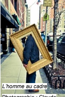
L'homme au cadre