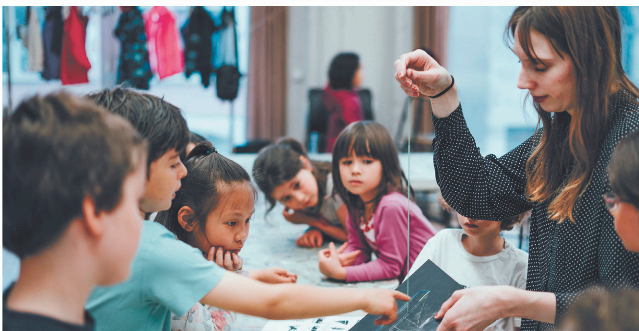
L'accessibilité et la diversité d'approches qu'offre le Centre des arts visuels vont au-delà des 300 cours et plus qui sont offerts dans l'établissement chaque année.

L'accessibilité et la diversité d'approches qu'offre l'école vont au-delà des 300 cours et plus qui sont offerts dans l'établissement chaque année. En effet, porté par le désir de bâtir une réelle communauté autour de l'art, le centre reste attentif aux besoins des gens de tous âges et de tous horizons. Le programme « Éveil des arts », subventionné par différents organismes, permet ainsi aux professeurs de se déplacer dans