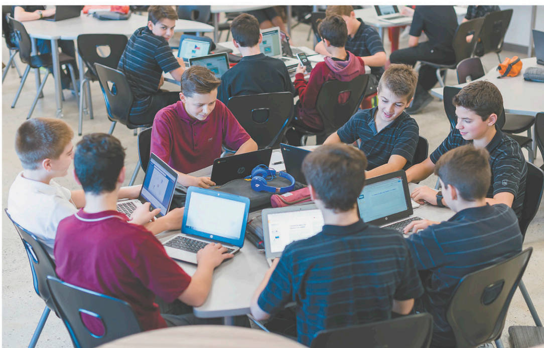
Si l'élève n'arrive pas à remplir ses engagements au bout de la semaine, il devra utiliser sa période d'activité du vendredi pour terminer son travail.

Au collège Saint-Bernard (CSB), à Drummondville, le virage de l'enseignement personnalisé a été pris il y a 10 ans avec les élèves en difficulté, à la demande des parents. Pour rebâtir l'estime de soi de ces jeunes, une petite équipe d'enseignants partage l'ensemble de la matière et suit les élèves tout au long