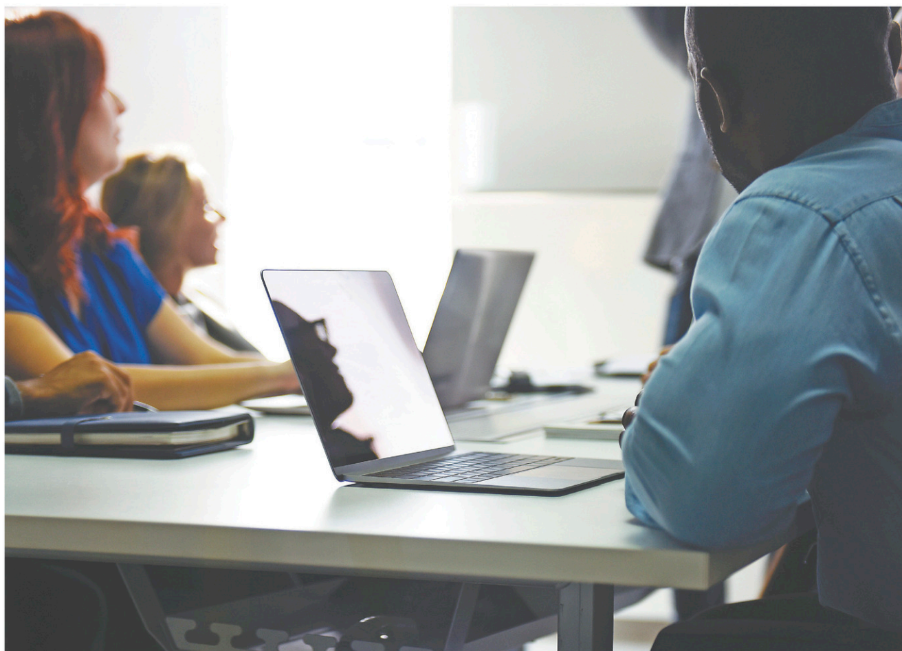
Dans son budget 2018, le gouvernement s'est engagé à ce que la croissance des dépenses en éducation atteigne 3,5% par année.

Cette année ne semble pas faire exception. Encore dernièrement, la