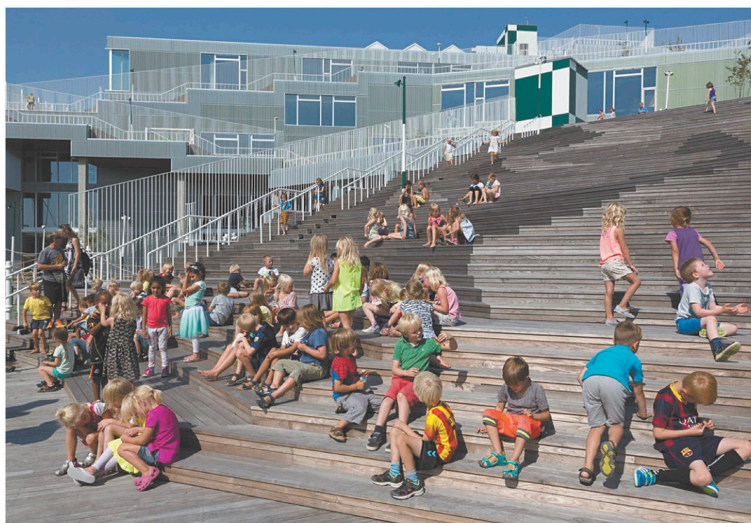
À l'école South Arbour, à Copenhague, au Danemark, la cour forme un «U», est orientée côté soleil et se termine par des gradins qui permettent d'accéder aux classes.