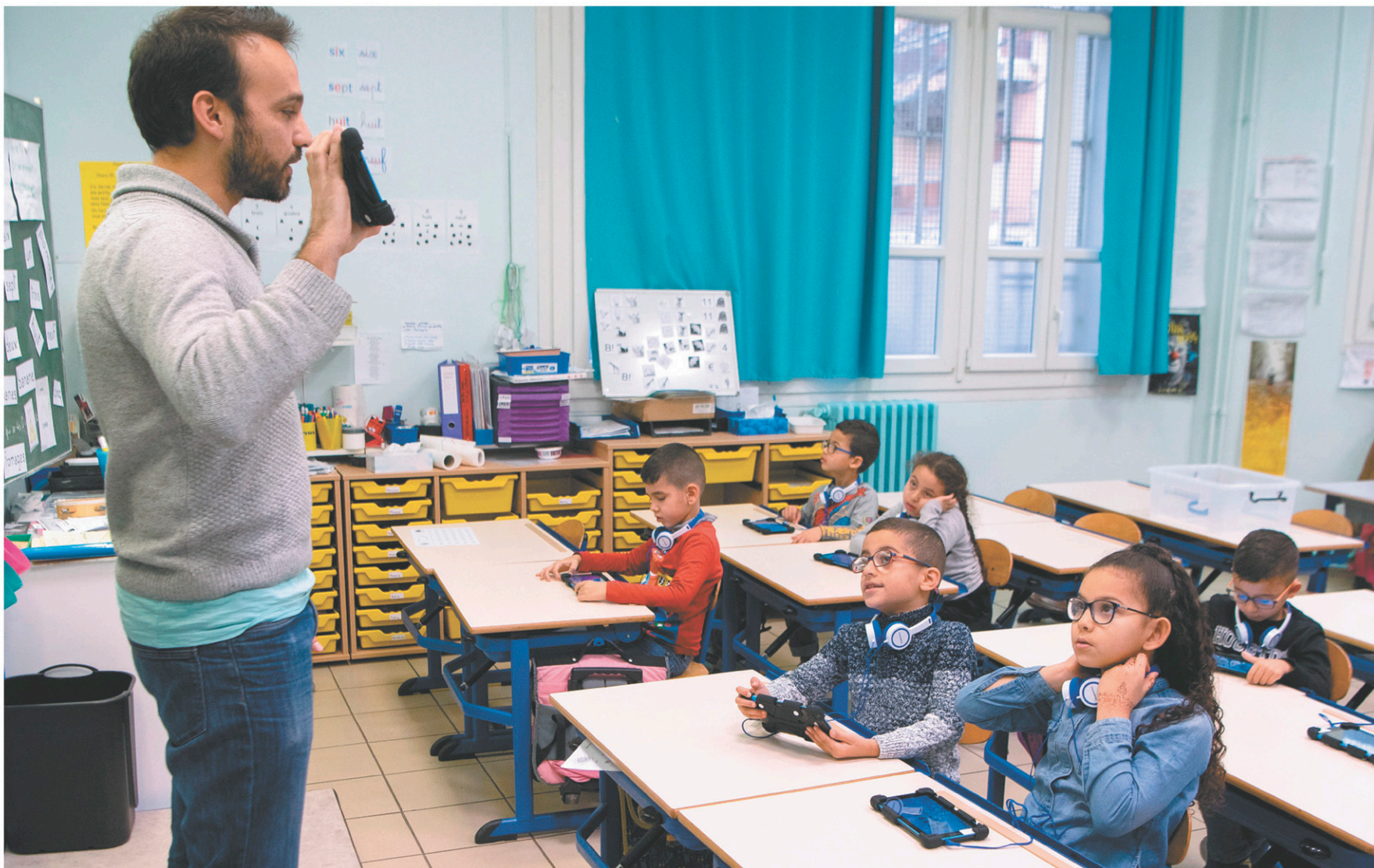
Depuis quelques années, le phénomène de classe sans professeur prend de l'ampleur, et principalement au primaire.