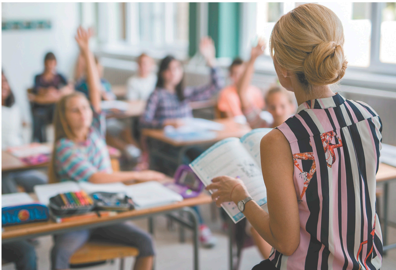
Au Québec, environ un enseignant au primaire et au secondaire sur cinq quitte l'enseignement après cinq ans de carrière.

La FAE met en ligne pour la durée de la campagne électorale un outil pour comparer les positions des partis en éducation, destiné à l'ensemble des Québécois. «L'idée n'est pas de dire aux gens pour quelle formation politique voter, mais simplement de rappeler les enjeux en éducation et les positions des partis à leur égard», précise le président. Il ajoute que la fédération ne donnera pas non plus de consigne de vote à