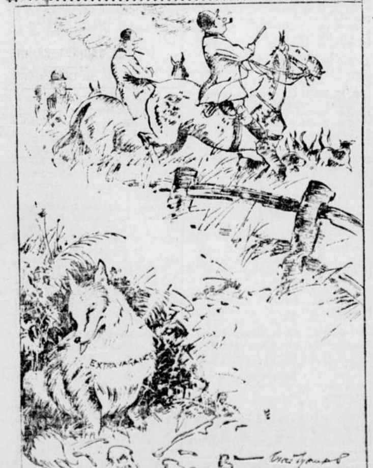
Le renard bien dodo: "J'ai été chanceux jusqu'ici. Je me demande, cependant, si je suis en sûreté pour une autre saison." Du London Opinion.