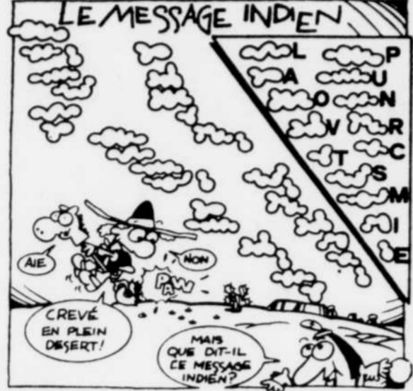
Il faut lire de haut en bas. Les nuages identiques représentent toujours la même lettre.

SOLUTION Le Pied marin: Ces instruments sont respectivement une boussole et un sextant (cet instrument permet de mesurer des hauteurs d'astres. En mesurant avec le sextant la hauteur du soleil, on détermine la latitude). Le Message indien: En mesurant avec le sextant la hauteur du soleil, on détermine la latitude. La Douche: Il doit tirer le fil 5. La Tente: Il arrivera à la tente numéro 2.