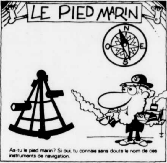
As-tu le pied marin? Si oui, tu connais sans doute le nom de ces instruments de navigation.