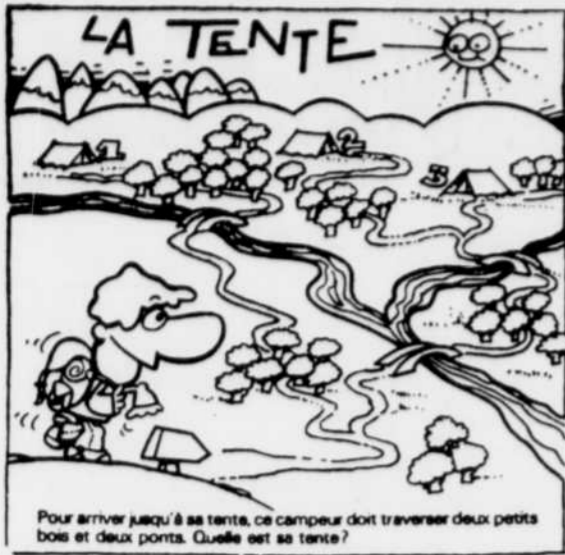
Pour arriver jusqu'à sa tente, ce campeur doit traverser deux petits bois et deux ponts. Quelle est sa tente?