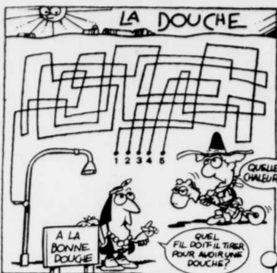
QUELLE CHALEUR! A LA BONNE DOUCHE QUEL FIL DOIT-IL TIRER POUR AVOIR UNE DOUCHE?