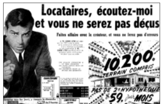
Le Soleil, 29 septembre 1962.

Et qu'aiment les banlieusards dans ces secteurs? La verdure, d'abord, qu'il ne faut pas trop vite associer aux pelouses bien tondues, les arbres à maturité. Et puis, ils se sentent proches de tout : des écoles et cégeps, des magasins et de divers services, souvent de leur travail, mais aussi de la ville centre! Ce qui favorise ce sentiment de proximité, ce sont bien sûr les autoroutes. Les banlieusards souvent ne conçoivent pas la ville comme un continuum du centre vers la campagne; les plus jeunes en particulier se représentent l'agglomération comme une juxtaposition de centres : celui où l'on vit, celui où l'on travaille, celui où l'on consomme, celui où vivent