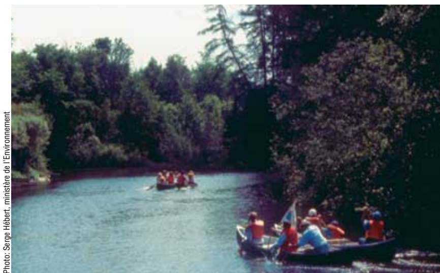
La rivière Saint-Charles, située dans la région de Québec, fait l'objet d'un vaste projet d'assainissement qui sera achevé en 2007.

Feront partie de ces organismes, sans représentation majoritaire, des citoyens et des regroupements de citoyens, des