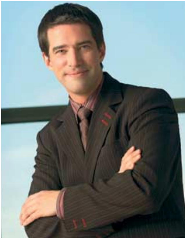
Le ministre d'État aux Affaires municipales et à la Métropole, à l'Environnement et à l'Eau, André Boisclair.