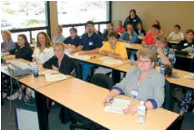
Les futurs employés poursuivent une formation dans les locaux mêmes du centre d'appels.