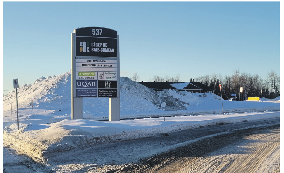
Le cégep de Baie-Comeau souhaite bonifier l'offre au niveau de l'enseignement supérieur sur la Côte-Nord, notamment en Manicouagan, en collaboration avec l'UQAR.