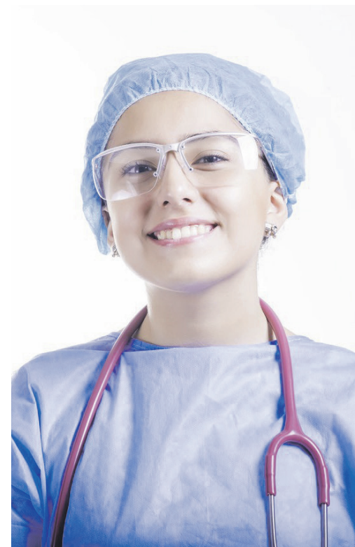
Les étudiants en Soins infirmiers de la Côte-Nord peuvent mettre la main sur une bourse.

Pour plus de détails concernant le programme de bourses et pour déposer sa candidature, écrivez à l'adresse suivante : stages.09cisss@sss.gouv.qc.ca .