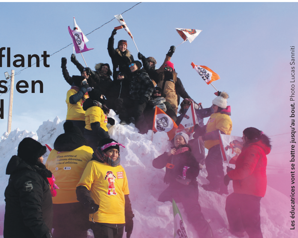
Les éducatrices vont se battre jusqu'au bout.

Les travailleuses en CPE font des pieds et des mains pour offrir les meilleurs services possibles aux enfants, malgré les nombreux enjeux auxquels elles font face au quotidien.