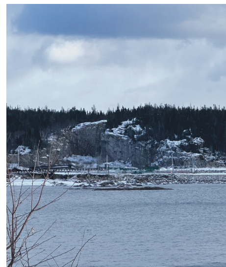
Le quai de Forestville pourrait accueillir un nouveau traversier au cours des prochaines années.

Rappelons que le CNM Évolution, qui assurait la liaison entre Rimouski et Forestville, a traversé le fleuve pour la dernière fois au début du mois d'août 2022. Depuis, les deux rives sont laissées sans service de traversier.