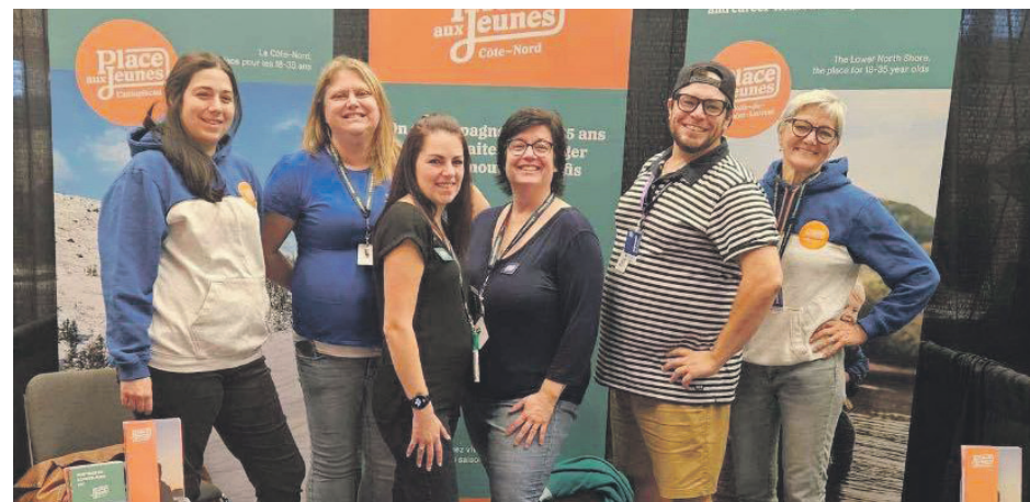
Les six agents Place aux jeunes de la région mettront de l'avant les richesses de la Côte-Nord du 3 au 7 février.

Une programmation est prévue pour permettre de découvrir ce qu'offrent les régions du Québec. Au menu :