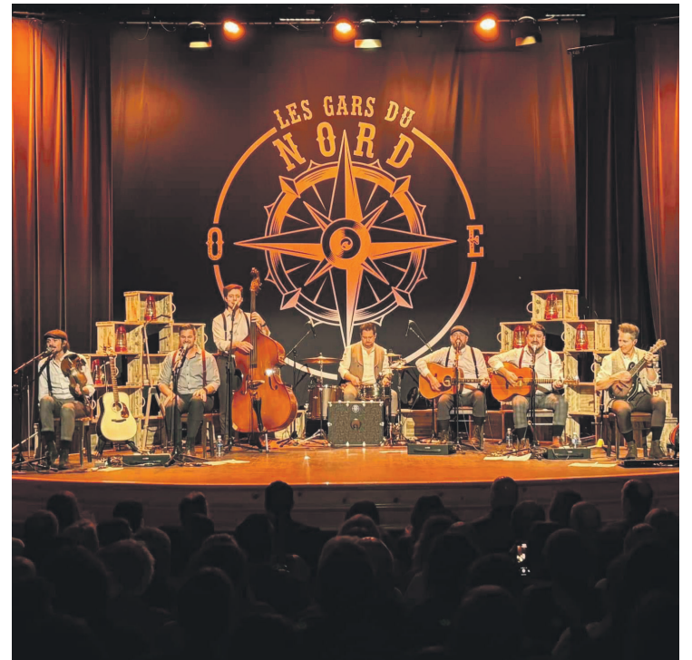
Le groupe acadien Les Gars du Nord sera la tête d'affiche de Forestville en chanson.