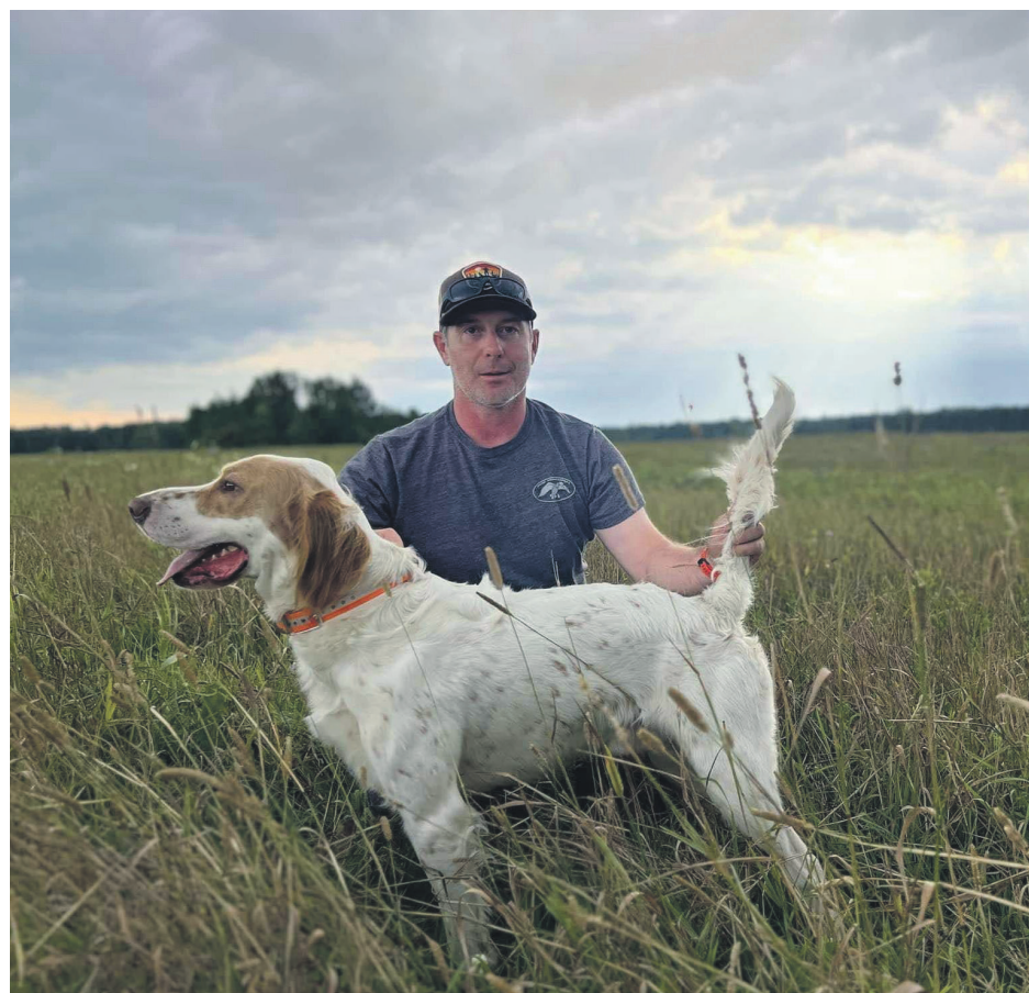
Duplaton Target a remporté le trophée du total des points en catégorie amateur en 2024.

Ses compagnons évoluent dans la National Shoot To Retrieve Association (NSTRA), une organisation qui