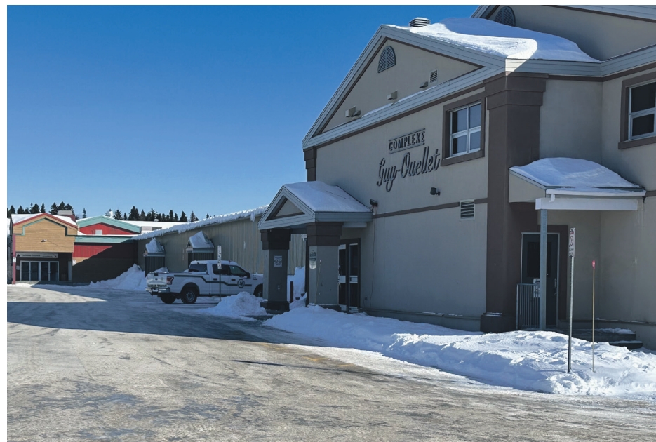
Le drainage des eaux pluviales doit être amélioré dans le stationnement du Complexe Guy-Ouellet à Forestville.

répondu à l'appel. Un contrat de gré à gré a donc été accordé à l'entreprise EMS Infrastructure au montant de 42 500 $ pour réaliser l'étude préparatoire. Cette somme sera aussi rem-