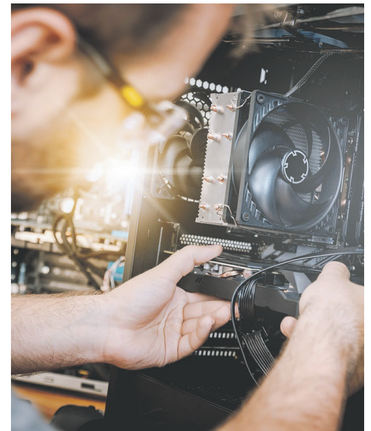
Le génie, les technologies de l'information et la construction sont trois secteurs visés par l'Opération main-d'œuvre.

«Les jeunes occuperont plus de la moitié des emplois disponibles au cours de la prochaine décennie. C'est donc d'autant plus important de mettre en lumière les métiers qui offrent des perspectives intéressantes et qui correspondent à leur profil. J'invite les jeunes à faire le test en ligne», ajoute la ministre responsable de la Côte-Nord.