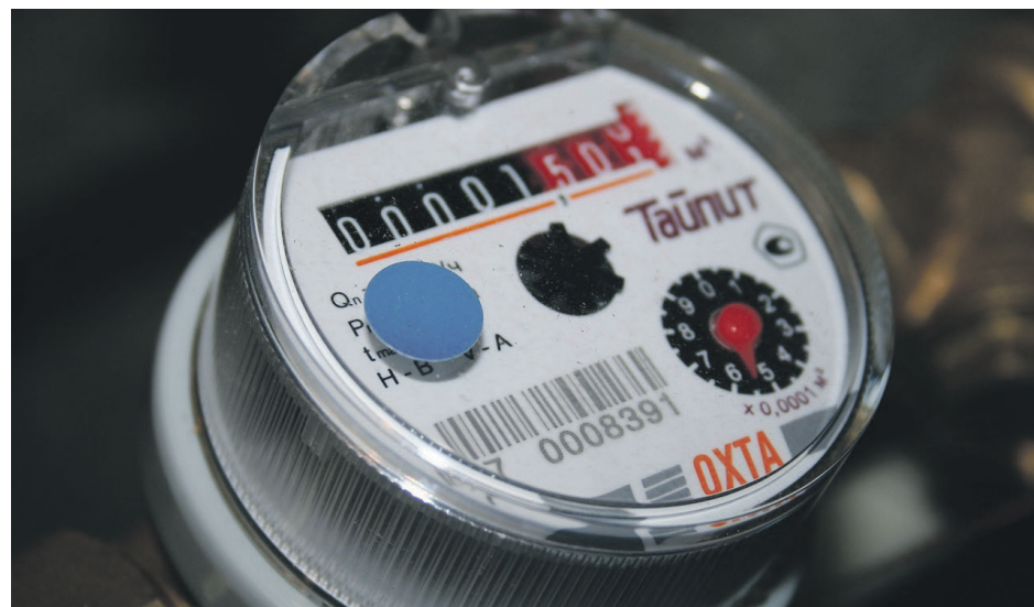
Des compteurs d'eau seront installés chez tous les commerçants et chez 60 citoyens.

«Les chiffres sont assez impressionnants. On dit que le Québec consomme 28 % plus d'eau que la moyenne du Canada et même 55 % plus d'eau que l'Ontario. C'est une consommation qui est très importante», a-t-elle divulgué.