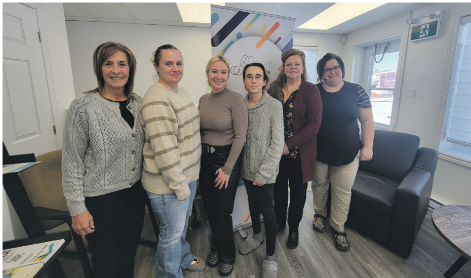
Six employés du Centre de prévention du suicide de la Côte-Nord.

Tout le monde en poste, une vigie est orchestrée si un appel entre. Ne jamais manquer l'appel d'une personne est plus qu'important, c'est prioritaire. D'ailleurs, le CPS Côte-Nord est souvent cité en exemple sur son efficacité parmi tous les centres du Québec.