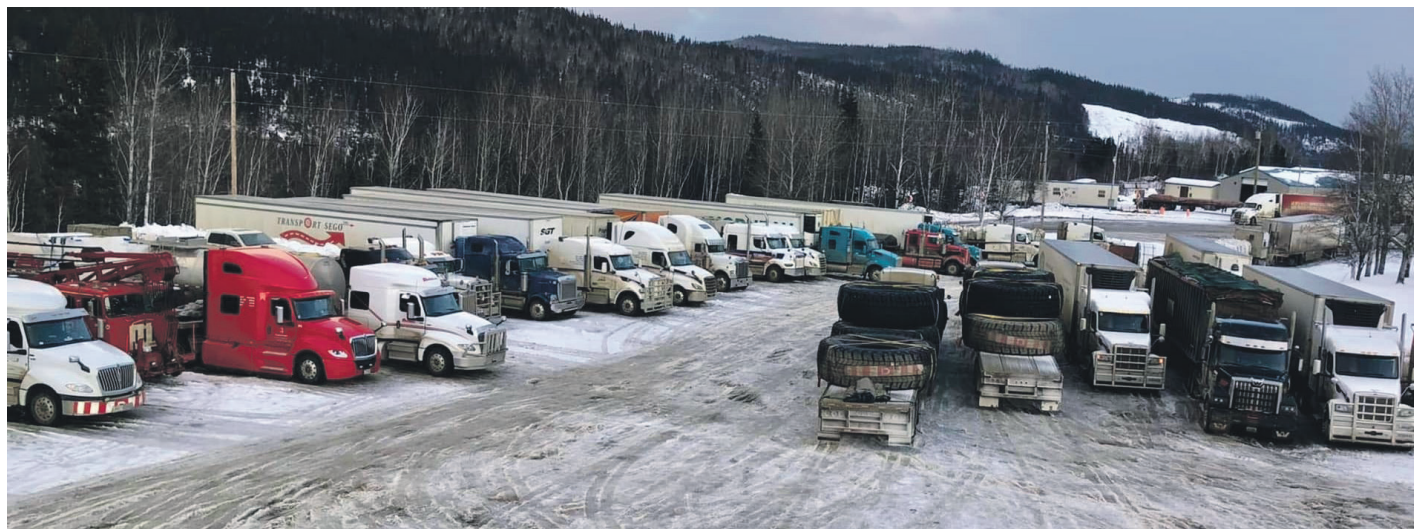
Le Motel de l'Énergie cherche activement à moderniser ses infrastructures avec l'aide d'un partenariat avec le ministère des Transports et de la Mobilité durable.

contre aura lieu le 10 février entre les deux parties pour faire suite à cette demande de partenariat.