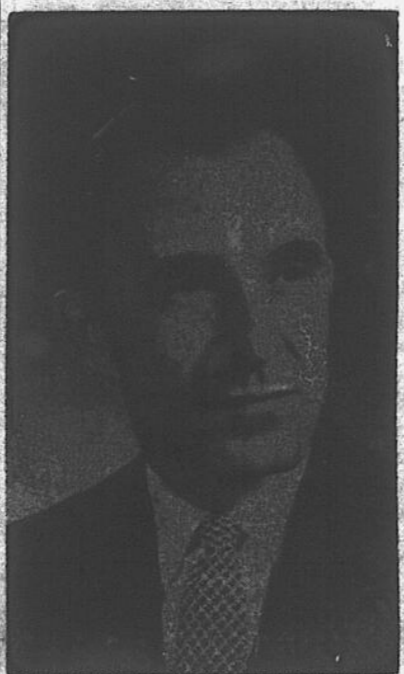
(DNC) — Dimanche, le 6 octobre à 8 h. 30, aura lieu une grande soirée de reconnaissance en l'honneur de M. Eloi Guillemette, membre de l'assemblée législative et député de Frontenac, de Lac-Mégantic. Il ne s'agira pas là, d'une organisation politique quelconque, mais d'une soirée publique où tout Lambton profitera de la circonstance pour remercier M. Guillemette du travail incessant qu'il a poursuivi, et des faveurs nombreuses qu'il a obtenues depuis son avènement à la députation de notre comté.

Le député provincial de Frontenac sera le héros d'une grande manifestation à la salle paroissiale de St-Vital de Lambton, dimanche, le 6 octobre à 8 heures et trente