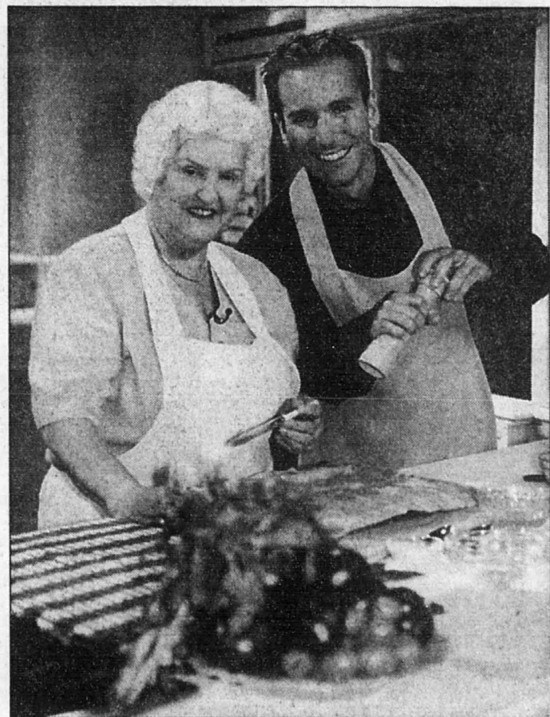
Maman Dion et son partenaire d'émission, Éric Salvail.

On a appris des gens qui travaillent avec Mme Dion qu'elle reste jusqu'à la toute fin des enregistrements — on en fait quatre par jour — pour récupérer les plats qu'ont laissés les techniciens. Elle