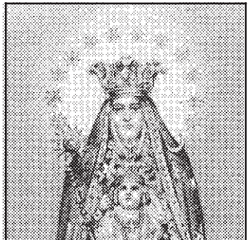
Remerciements à la Sainte-Vierge de Piedigrotta pour faveur obtenue. R.P.