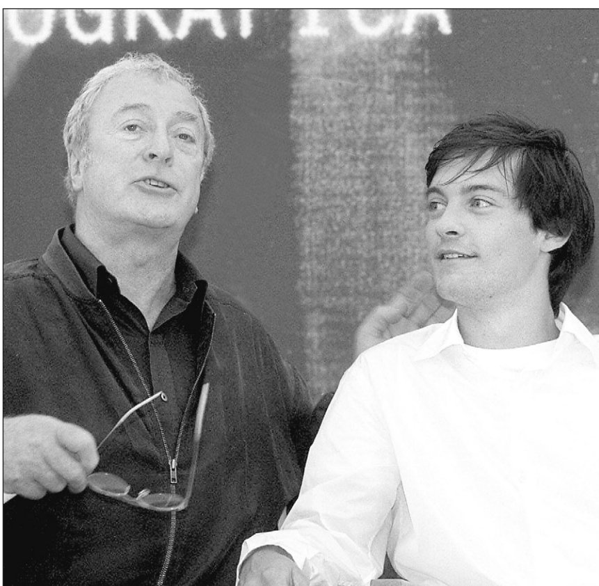
L'acteur britannique Michael Caine et l'acteur américain Tobey Maguire étaient à Venise hier pour présenter le film The Cider House Rules .

Drôle et tendre, The Cider House Rules suit le jeune Homer, orphelin particulièrement cher au cœur de l'excentrique Dr. Larch, qui dirige avec une affection toute paternelle un orphelinat dans le Maine en 1945. Il accouche ou avorte les cas désespérés qui se présentent à lui, cherche parfois l'oubli dans l'éther