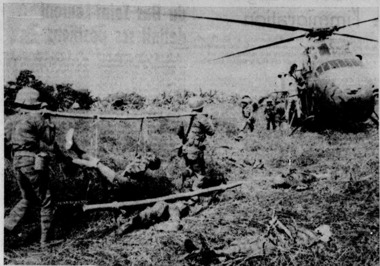
Les pertes gouvernementales se sont sensiblement élevées ces derniers temps au Sud-Vietnam. Cette photo montre l'évacuation des morts et des blessés à la suite d'une attaque vietcong, la semaine dernière, à 6 milles au sud-ouest de Saïgon. Au cours de cette bataille un conseiller américain a été tué et un autre blessé.