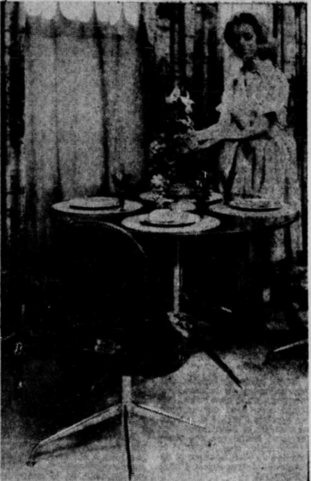
Au salon canadien de l'ameublement, on a présenté cette semaine, cet ensemble de dinette en chromé et teck contre-plaqué. Les chaises pivotantes à haut dossier sont recouvertes de vinyle lavable, à motif floral, dans les teintes de kaki, melon pâle, bleu sarcelle et avocat. C'est une création Liberty Ornamental Iron.

Meubler son foyer, redécorer une pièce est une entreprise coûteuse. C'en est une qui ne permet guère d'erreur. Si vous vous trompez, vous en subirez longtemps les inconvénients, alors pourquoi ne pas demander l'avis d'un décorateur? Plusieurs grands magasins ou magasins spécialisés vous offrent ce service à titre gratuit. Attention aux "grandes ventes" de janvier, février ou l'on achète souvent sous le coup de l'impulsion.