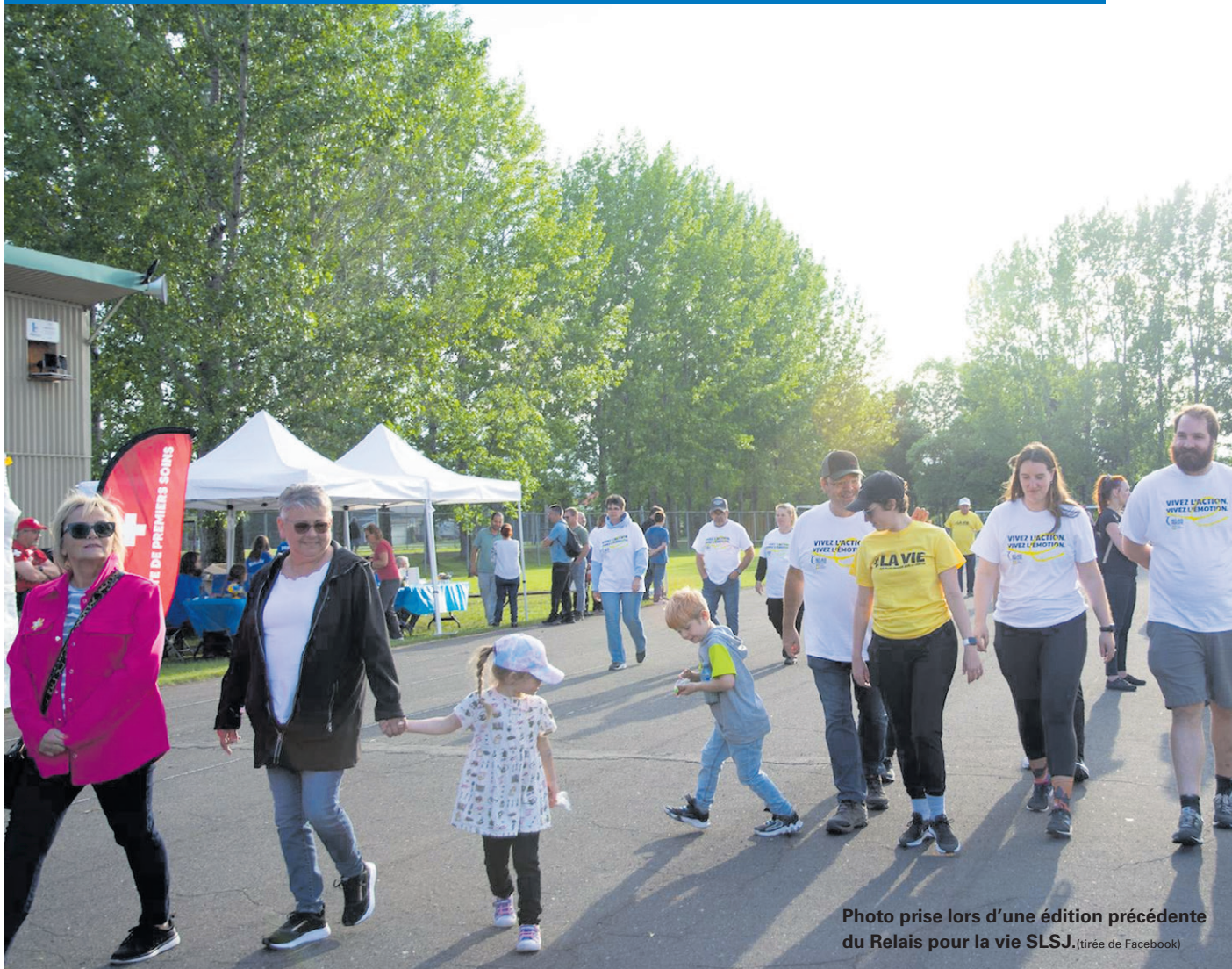
Photo prise lors d'une édition précédente du Relais pour la vie SLSJ.