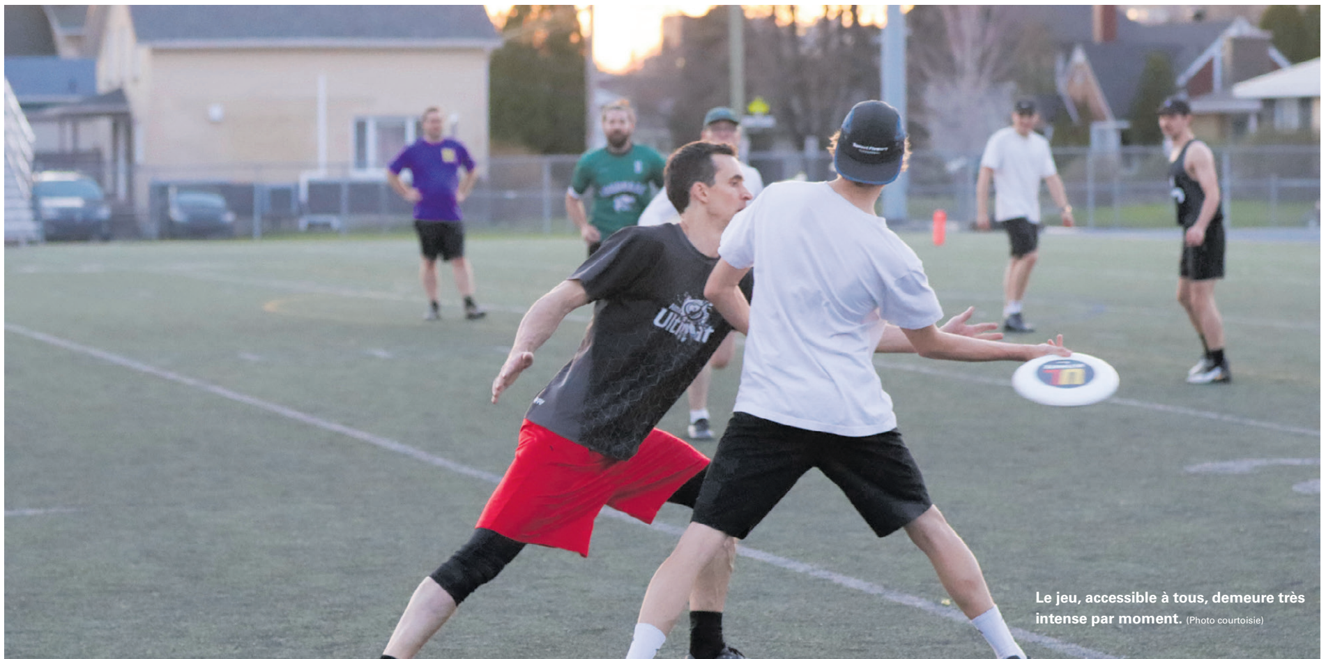
Le jeu, accessible à tous, demeure très intense par moment.