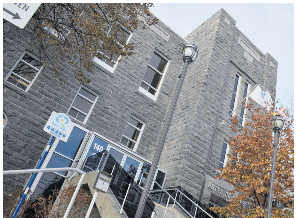
La Ville d'Alma a publié ses états financiers de 2024 la semaine dernière.

Les droits de mutation immobilière, liés à l'essor du marché immobilier, se chiffrent quant à eux à 2,46 M$, soit 1,69 M$