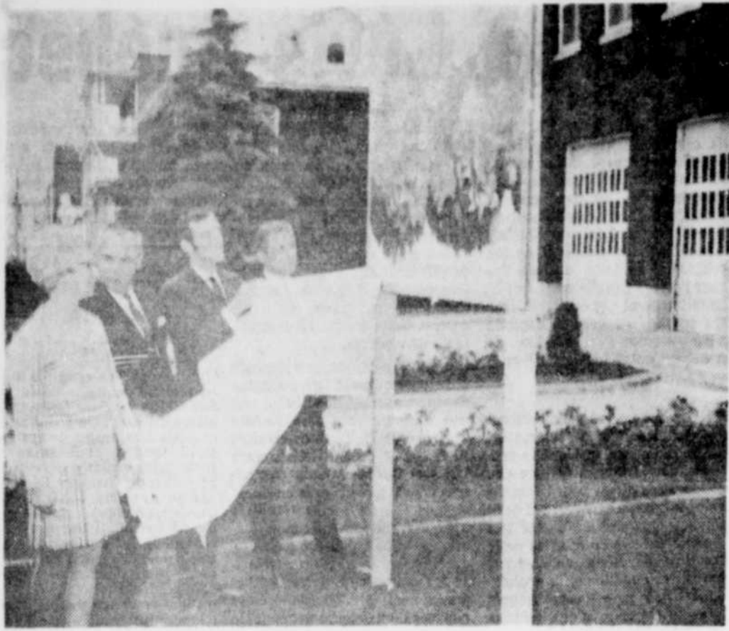
LA JEUNE CHAMBRE DE DRUMMONDVILLE a lancé jeudi soir, sa campagne annuelle des "jardins fleuris", comme elle l'avait fait l'an dernier et avait connu d'heureux résultats. Comme on le sait, à la suite d'un concours parmi les élèves des différentes écoles pour trouver une fleur symbolique pour Drummondville, la Jeune Chambre avait adopté le géranium.