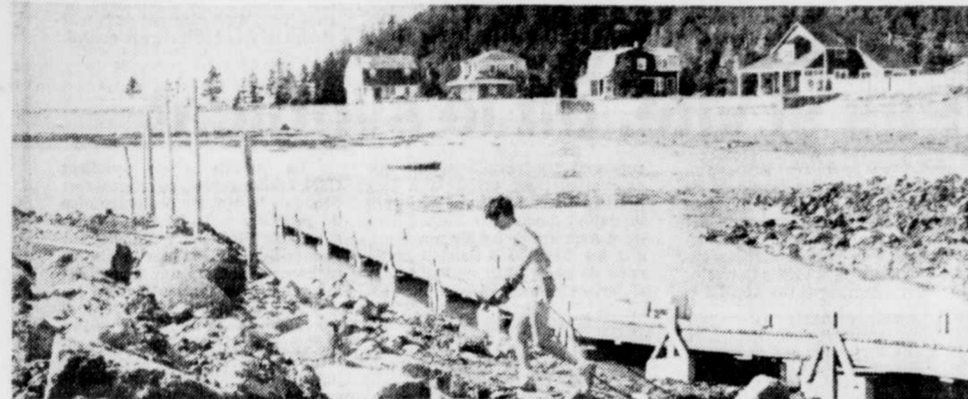
Des quais flottants ont été mis à l'eau, cette semaine.

Les dirigeants de la Société d'exploitation se disent d'accord avec cette intégration, à condition cependant que les services ne soient pas diminués qualitativement ou quantitativement. Ils estiment en effet que les services sont plus efficaces quand ils sont donnés sur place par des personnes du milieu. C'est pourquoi ils concluent qu'ils sont prêts à collaborer à l'étude d'intégration des services d'extension et éventuellement à faire encore partie du réseau de mise en application des services, car à leur avis, il n'y a rien de mieux que d'intégrer les services de main-d'oeuvre et de création d'emplois à un milieu, plutôt que d'intégrer la clientèle à un service.