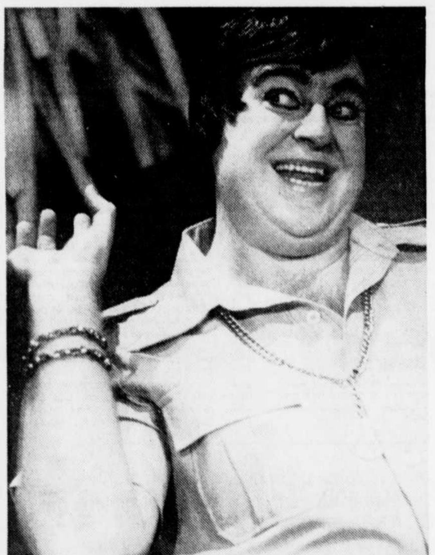
Le Soleil La duchesse de LANGEAIS

Elle se montre également fort critique à l'endroit du ministre québécois de l'Industrie, du Commerce et du Tourisme dont elle attend toujours la confirmation à la proposition soulevée par le ministre de faire assumer les frais de l'étude de rentabilité par le gouvernement.