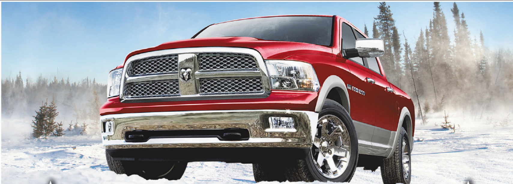
Ram 1500 Laramie à cabine d'équipe 2012 avec équipement optionnel montré**