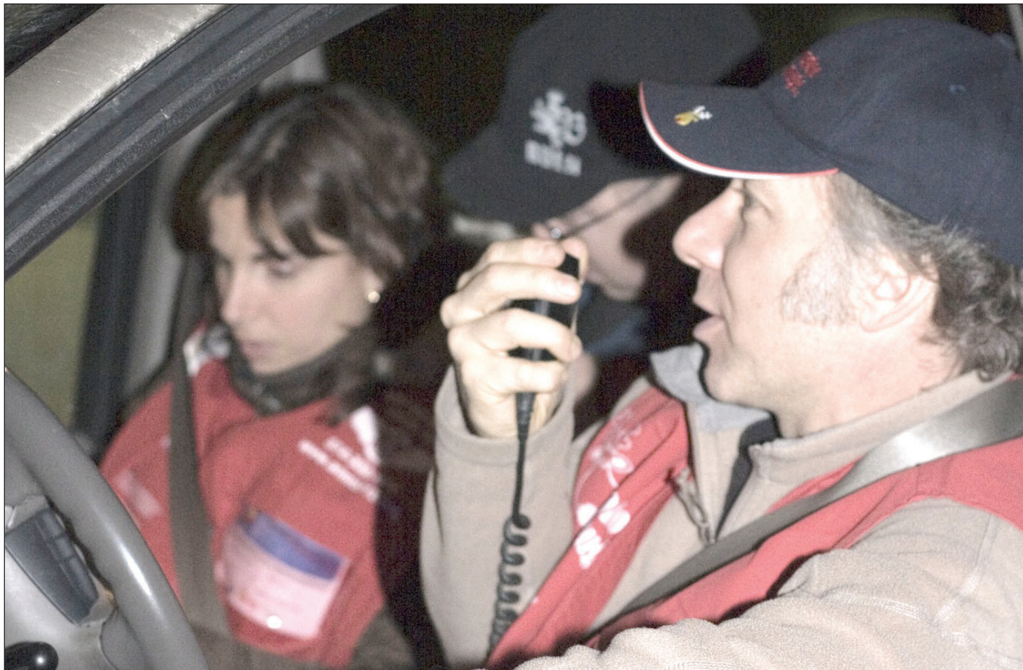
Ce sont 44 000 bénévoles qui ont, au total, pris part aux activités d'Opération Nez Rouge cette année.

Presque tous les secteurs de la région ont effectué plus de accompagnements que l'an dernier. C'est le cas, notamment, à Bonaventure et Matane, où les bénévoles ont sillonné leurs territoires respectifs en effectuant 386 et 438 accompagnements. À Chandler, 363 conducteurs ont pu rentrer à la maison en toute sécurité alors que ce nombre est fixé à 561 à Paspébiac, une très bonne année selon l'organisation d'Opération Nez Rouge. Dans le secteur d'Amqui, on parle de 438 accompagnements tandis qu'à Gaspé, la moyenne des années précédentes a été conservée, le total de accompagnement enregistré étant de 531. C'est à Carleton-sur-Mer que le