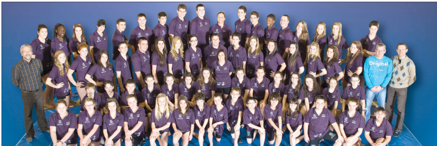
Les participants au défi Sauvetage adrénaline, qui ont donné le meilleur d'eux-même.

Comme l'indique Mme Giroux, le public n'a pas dérogé pendant toute la nuit. « D'habitude, les gens restent les premières heures et quittent ensuite. Cette année, il y a eu tellement de monde que c'était difficile de bouger autour de la piscine à toute heure de la nuit. » Plusieurs centaines de personnes ont assisté à l'événement en continu. Musique, et divertissement étaient au rendez-vous pour maintenir une ambiance festive. « À un certain moment, on a eu une baisse d'énergie dans le public. J'ai mis de la musique du jour de l'an et je me suis jetée à l'eau. Ensuite, on est repartis jusqu'au lendemain matin. » a-t-elle dit en riant.