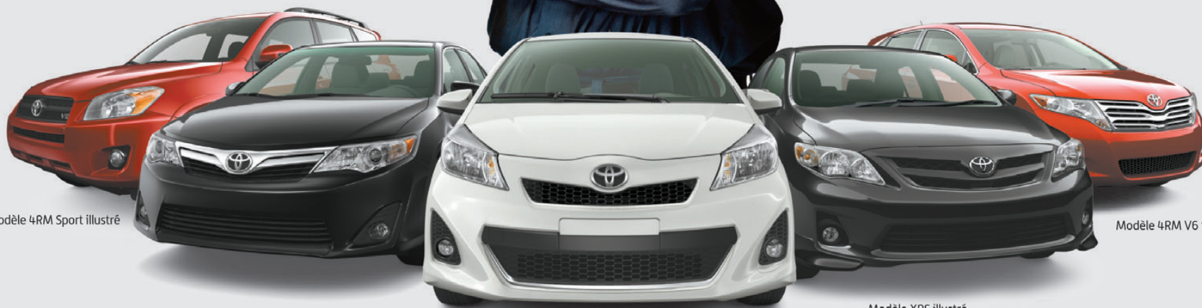
Modèle 4RM Sport illustré

Transport et préparation inclus (droits, TPS et TVQ en sus)