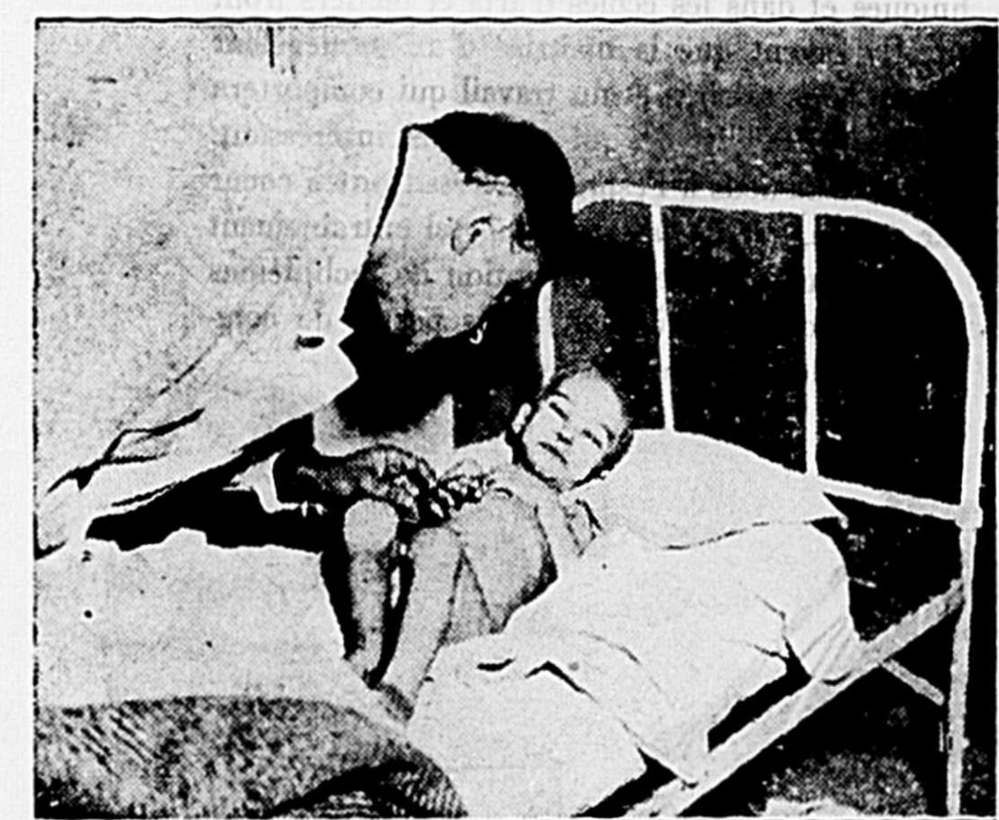
UNRRA à l'oeuvre en Italie Un enfant de trois ans est devenu aveugle par suite de malnutrition. Cette photo est prise dans un hôpital près de Naples en Italie. On voit un médecin de l'UNRRA penché sur l'enfant.