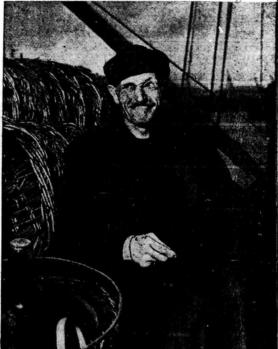
En vertu de l'accord international qui vient d'être signé par les cinq pays du bassin rhénan et l'OIT, les quelques 45.000 bateliers du Rhin bénéficieront de la sécurité sociale à partir du mois de juin prochain.