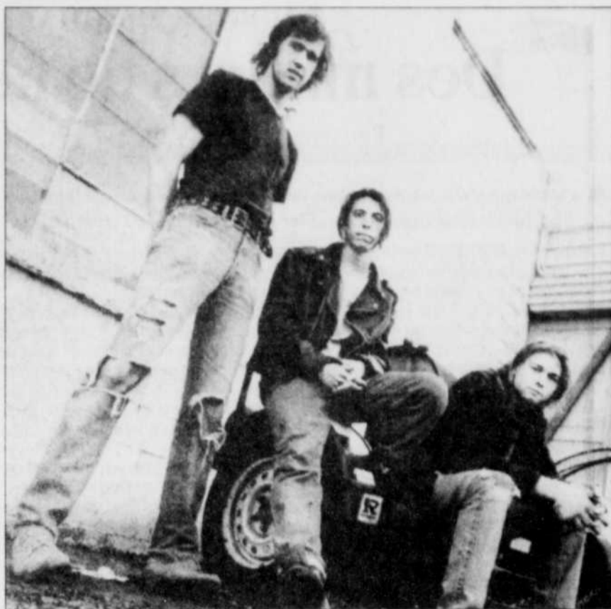
Krist Novoselic (à gauche), Kurt Cobain (à droite), alors âgé de 27 ans et David Grohl, alors que le groupe rock grunge filait le parfait bonheur

Depuis ses débuts il y a six ans, Brooks a vendu pas moins de 51 millions de disques aux États-Unis. Au Canada on parle de quatre millions.