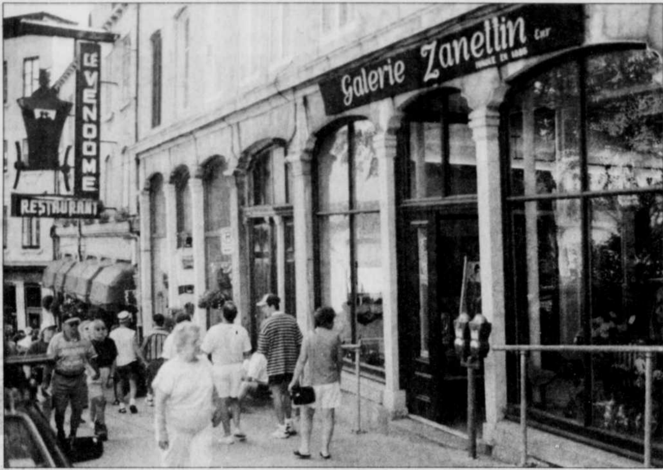
L'immeuble de la Côte de la montagne continuera d'accueillir les oeuvres d'artistes.