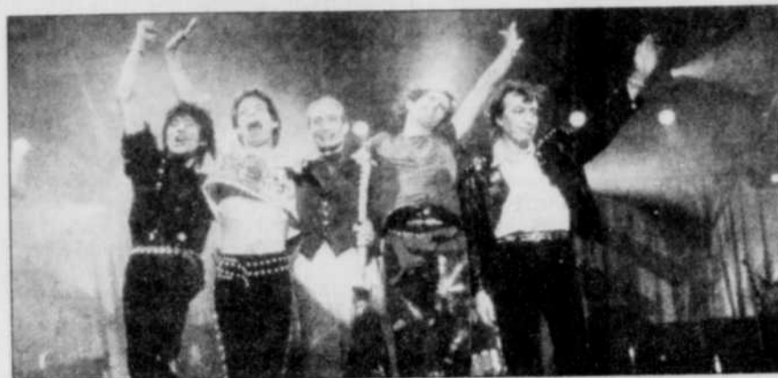
Les Stones ne se sont pas lancés dans l'aventure d'une nouvelle tournée sans appréhension.

Pour paraphraser un de leurs titres les plus célèbres,