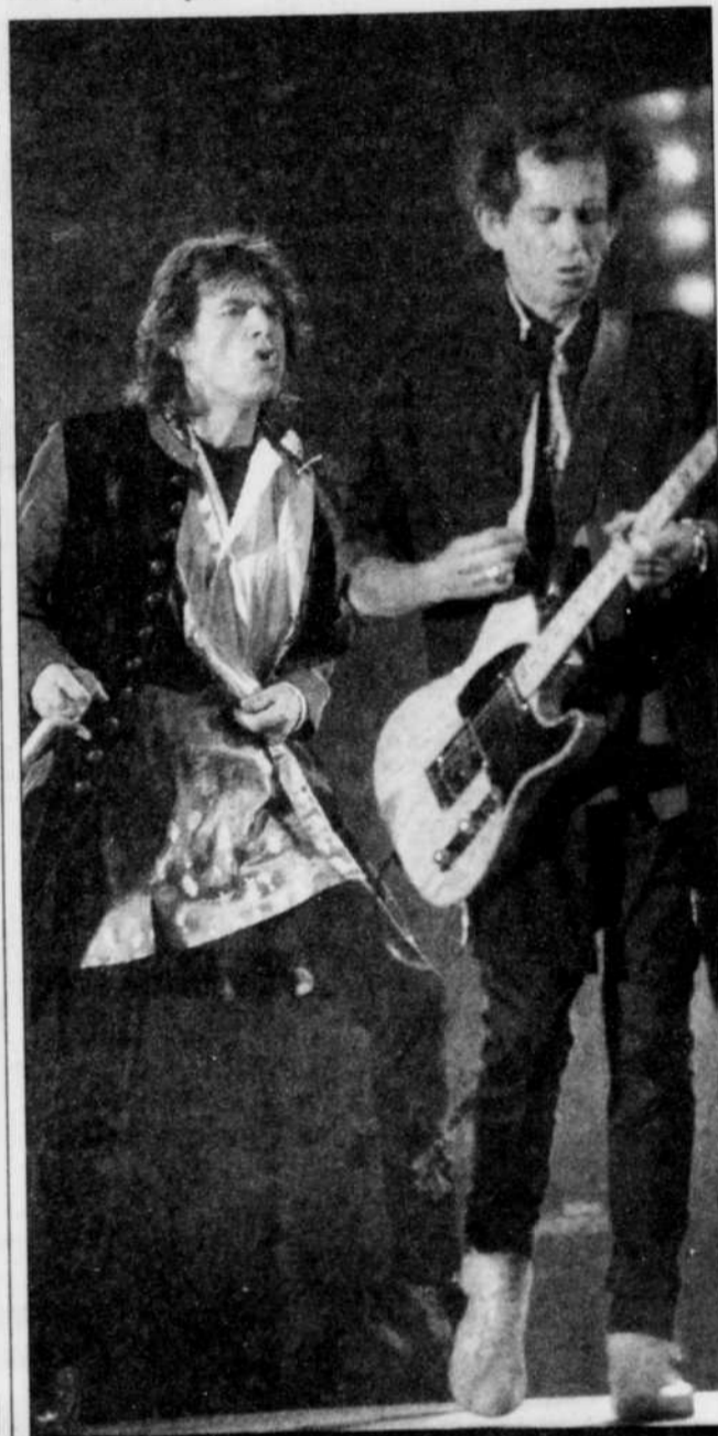
La rumeur envoie les Stones en Extrême-Orient l'an prochain, avant de les ramener en Amérique du Nord.