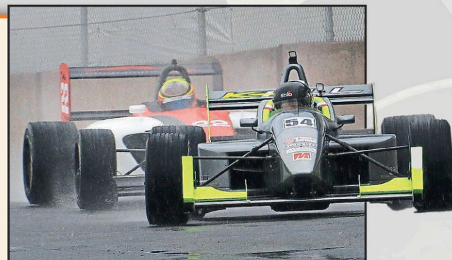
Trois courses de Formula Tour 1600 sont au programme.