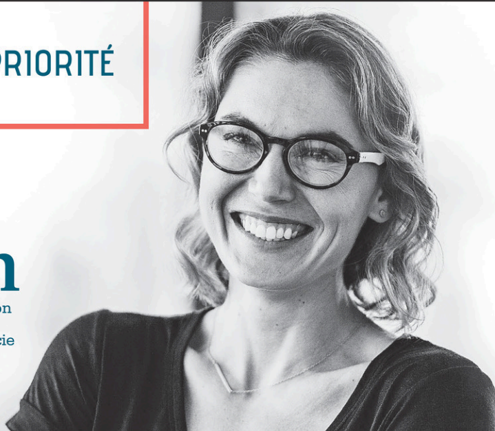
Table de concertation du mouvement des femmes de la Mauricie