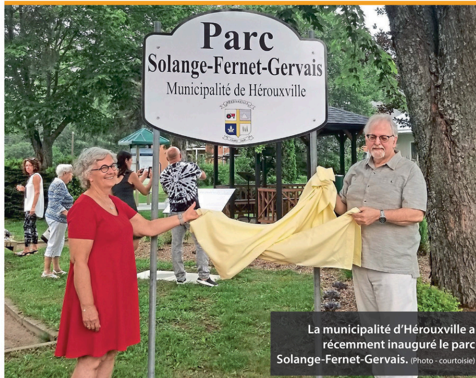
La municipalité d'Hérouxville a récemment inauguré le parc Solange-Fernet-Gervais.