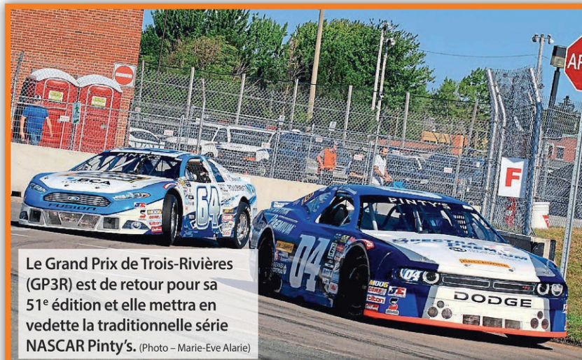
Le Grand Prix de Trois-Rivières (GP3R) est de retour pour sa 51 e édition et elle mettra en vedette la traditionnelle série NASCAR Pinty's.

Le GP3R Virtuel, organisé en collaboration avec les Amis du GP3R et la série EGT Challenge, lancera les hostilités le 6 août. Le lendemain, les épreuves de SuperMotos et SuperQuads se dérouleront sur le Circuit Luc-Mathon, à Sainte-Geneviève-de-Batiscan, tandis qu'une épreuve de karting mettant en vedette des pilotes de la série NASCAR Pinty's se tiendra le 8 août, sur le circuit SC Performance, à Saint-Célestin. La fermeture de la frontière aux voyages non essentiels a forcé le GP3R à se réinventer et à regarder dans un rayon plus national pour combler sa programmation, y allons donc avec ladite série DIRT.