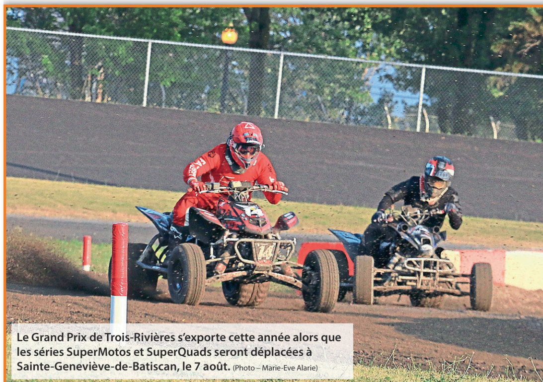
Le Grand Prix de Trois-Rivières s'exporte cette année alors que les séries SuperMotos et SuperQuads seront déplacées à Sainte-Geneviève-de-Batiscan, le 7 août.