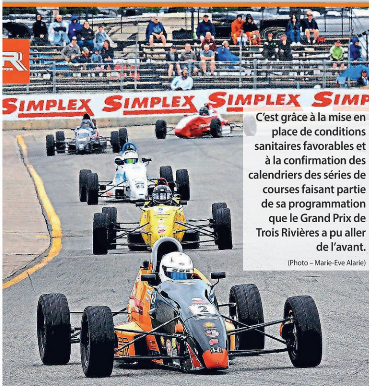
C'est grâce à la mise en place de conditions sanitaires favorables et à la confirmation des calendriers des séries de courses faisant partie de sa programmation que le Grand Prix de Trois Rivières a pu aller de l'avant.