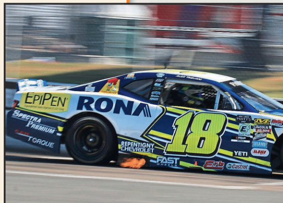
La course de NASCAR Pinty's débutera à 14h18 le 15 août.

*Cet horaire est assujéti aux changements sans préavis