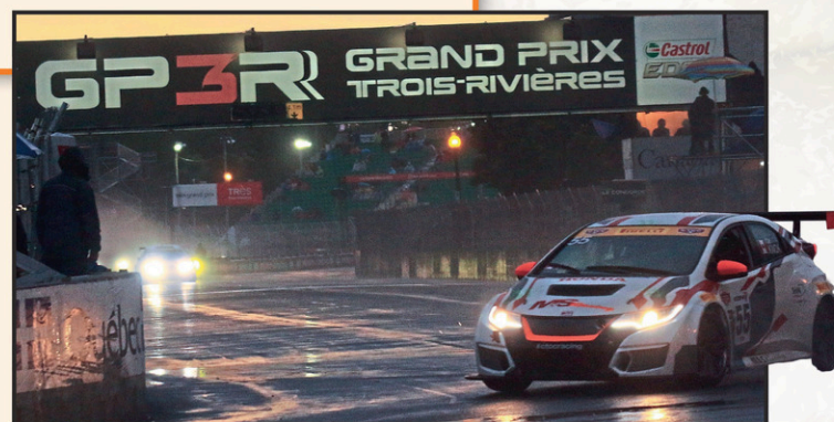
Les courses en soirée sont de retour le vendredi soir.