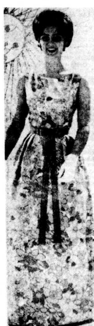
Robe longue en très beau coton satiné à grand imprimé floral de Tex-made. C'est un patron McCall, no 6605 — modèle no C. La robe est portée par Miss Cotonnade '64.

Il est intéressant de savoir que pour être admises à concourir pour le titre de Miss Coton, les jeunes filles doivent être âgées de 19 à 25 ans, ne jamais avoir été mariées, mesurer au moins 5 pieds 5 1/2 pouces et être nées dans un des 18 états producteurs de coton des États-Unis.