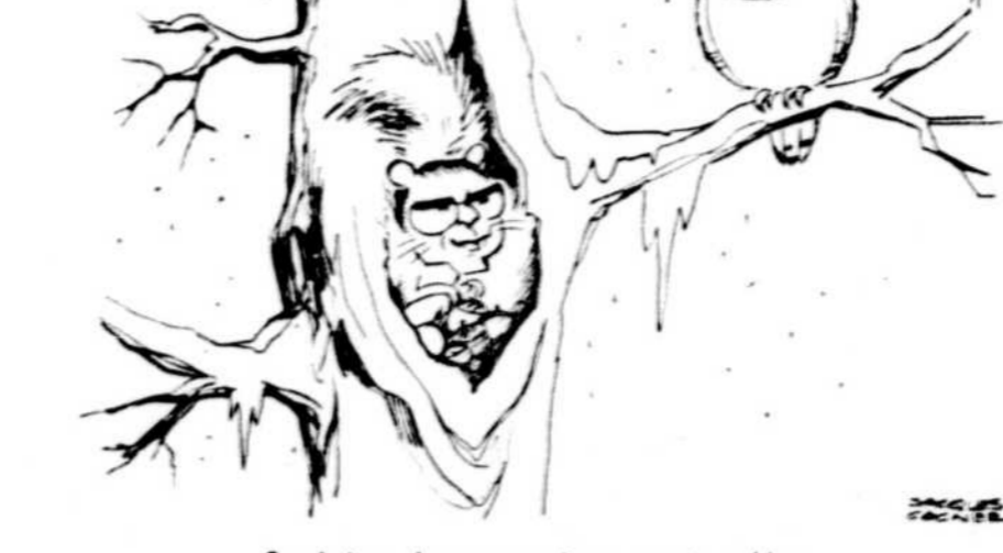
Saulnier: les annexions sont gelées... Drapeau: ... mais on économise sur la neige!

Cette précision paraît d'autant plus nécessaire que le leader de l'opposition au Con-