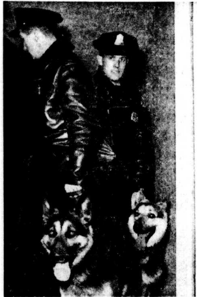
Les locataires des appartements du centre domiciliaire l'Acadie ont été éveillés, la nuit dernière, par des policiers inquisiteurs... accompagnés (pour le flair) de leurs (nouveaux) chiens dressés pour la chasse à l'homme.

Le gouvernement canadien et celui du Québec sont très favorables à la venue de familles françaises d'Algérie qui renforceront le nombre d'immigrants français, qu'on évalue à soixante-dix mille depuis la fin de la deuxième guerre. Et le fait qu'Ottawa ait assumé les frais de voyage des deux fonctionnaires français indique qu'il favorisera, aidera et conseillera avec bienveillance les rapatriés d'Algérie.