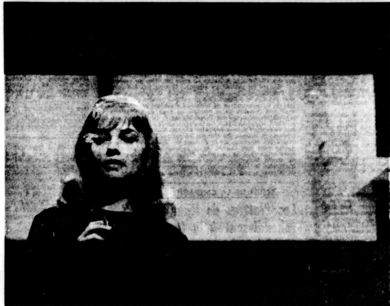
"EVA" avec Jeanne Moreau et Stanley Baker, prendra l'affiche du Cinéma LE PARISIEN dès vendredi... C'est l'histoire d'un couple qui n'arrive ni à se former, ni à se défaire: Eva et Tyvian sont inextricablement liés, rarement pour le meilleur, souvent pour le pire. Ce sont, l'un et l'autre des exiliés, des bannis de la société. Sur la photo: JEANNE MOREAU.