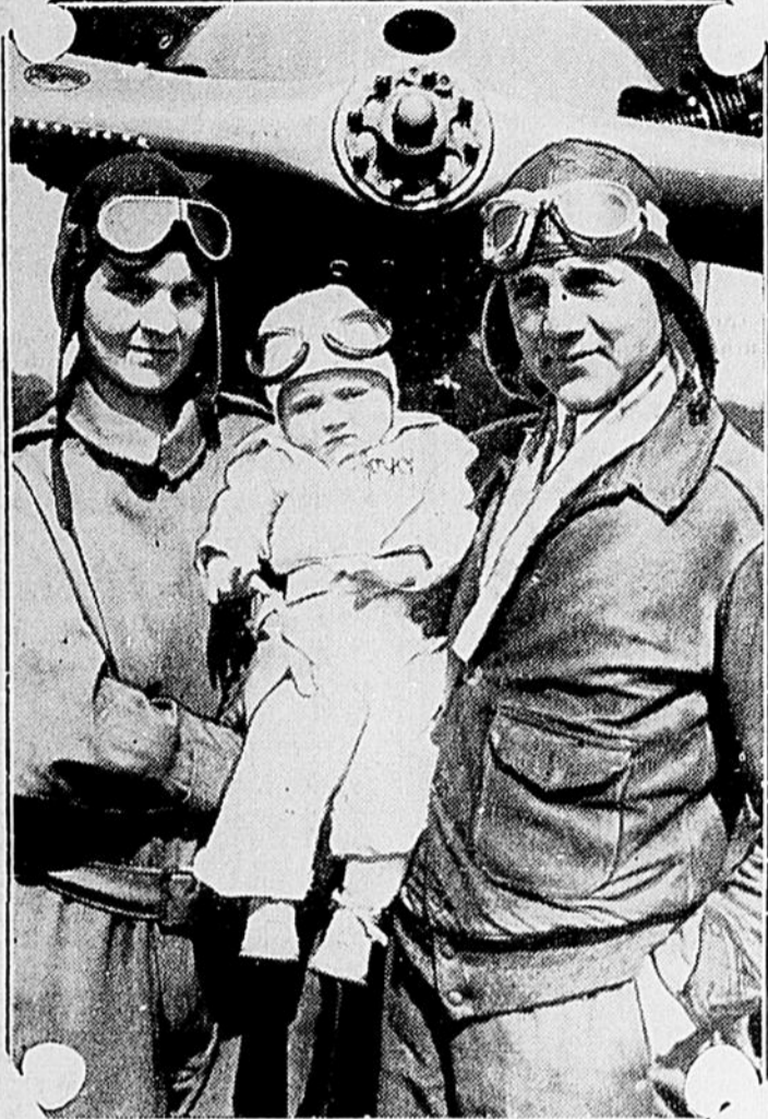
L'enfant suivra-t-il les traces de ses parents. En tout cas, il prend l'air assez jeune