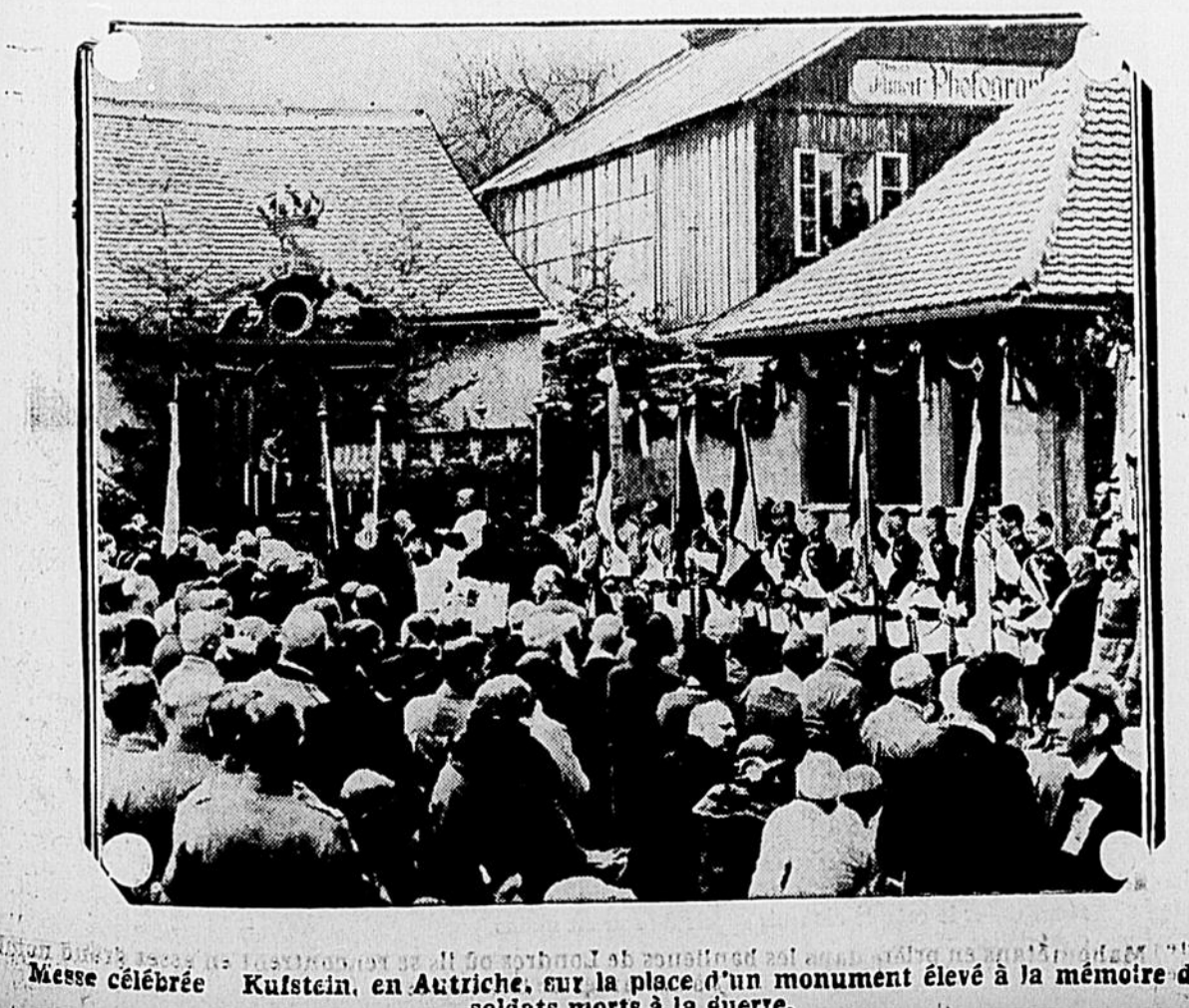
Messe célébrée Kufstein, en Autriche, sur la place d'un monument élevé à la mémoire des soldats morts à la guerre.