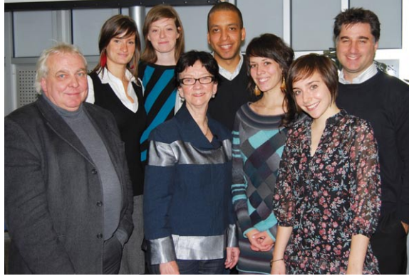
Des bénévoles du comité RPSF-Université de Sherbrooke lors d'une conférence prononcée par la directrice générale de RPSF. Nous avons profité de l'occasion pour lancer officiellement RPSF dans l'Estrie.

Kiosque lors d'un 4 à 7 de réseautage organisé en novembre par le comité RPSF-Université de Sherbrooke.