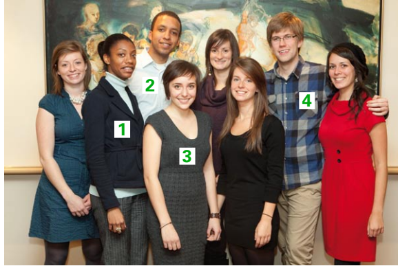
Représentants du réseau universitaire

Dès septembre, l'enthousiasme était au rendez-vous chez les étudiants du baccalauréat en relations publiques de l'Université du Québec à Montréal (UQAM). La représentante de RPSF a vite fait d'attirer une dizaine de futurs relationnistes autour de la mission de l'organisme. Le groupe a réalisé l'événement-bénéfice Tête-à-tête : les communications dans les pays en développement , qui a attiré près de 50 personnes venues écouter les propos de quatre représentants d'ONG dont RPSF. Un premier partenariat a été établi avec le réseau socioprofessionnel de relations publiques de l'université, qui a invité les chefs de mission à donner des conférences durant ses activités et permis à RPSF-UQAM d'y vendre des t-shirts. Un second partenariat, cette fois-ci avec la chargée du cours Événements spéciaux et commandites en relations publiques , s'est concrétisé avec la tenue de Et si c'était la fin du monde ? , un spectacle d'humour bénéfique attirant près de 200 personnes, organisé par des étudiants du cours. Finalement, l'année s'est terminée par une bonne nouvelle pour RPSF-UQAM qui a vu sa demande de candidature à l'agrément acceptée par le Service à la vie étudiante de l'université, ce qui lui donne le statut de groupe officiel à l'UQAM.