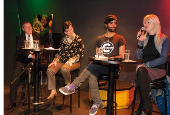
L'événement-bénéfice Tête-à-tête : les communications dans les pays en développement , organisé par les bénévoles du comité RPSF-UQAM, a attiré près de 50 personnes venues écouter les propos de quatre représentants d'ONG dont Oxfam-Québec et RPSF.