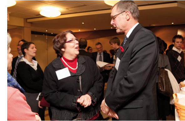
Bénévoles et partenaires de services fraternisent lors du premier 5 à 7 organisé en novembre 2010 avec l'aide d'un commandite du Cabinet de relations publiques NATIONAL. Une belle occasion de mieux connaître RPSF, ses missions internationales et les multiples façons de contribuer à son essor.

Événements – En novembre, RPSF a tenu son premier 5 à 7 à l'intention des bénévoles et partenaires de service. En prévision de la première soirée-bénéfice de RPSF, prévue pour 2011, nous avons préparé un document-concept et avons entrepris des négociations avec des partenaires potentiels.