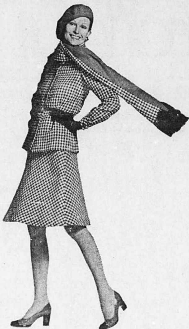
Adèle Simpson, automne-hiver 73: le tailleur à veston long, à jupe évasée et à longue écharpe réversible.

Et, dans tous les styles, toutes les longueurs, les textures, des chandails, des chandails.