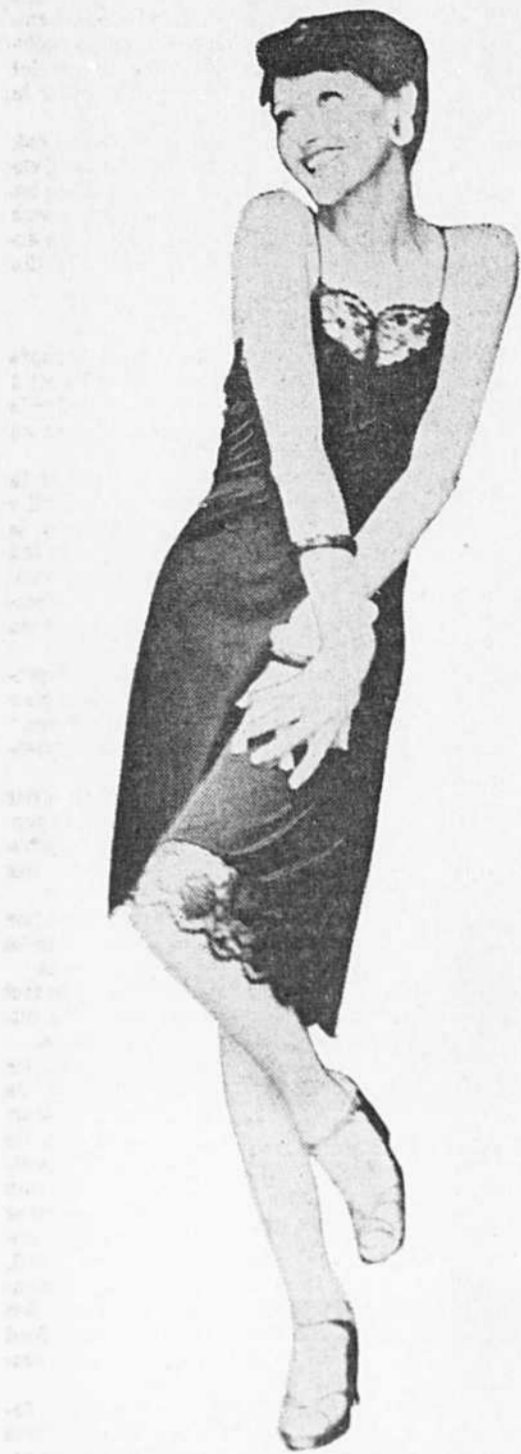
La robe soi-disant habillée telle que dessinée par Clovis Ruffin, un des couturiers les plus dynamiques de l'automne américain. Une vague réminiscence des jupons d'autrefois.