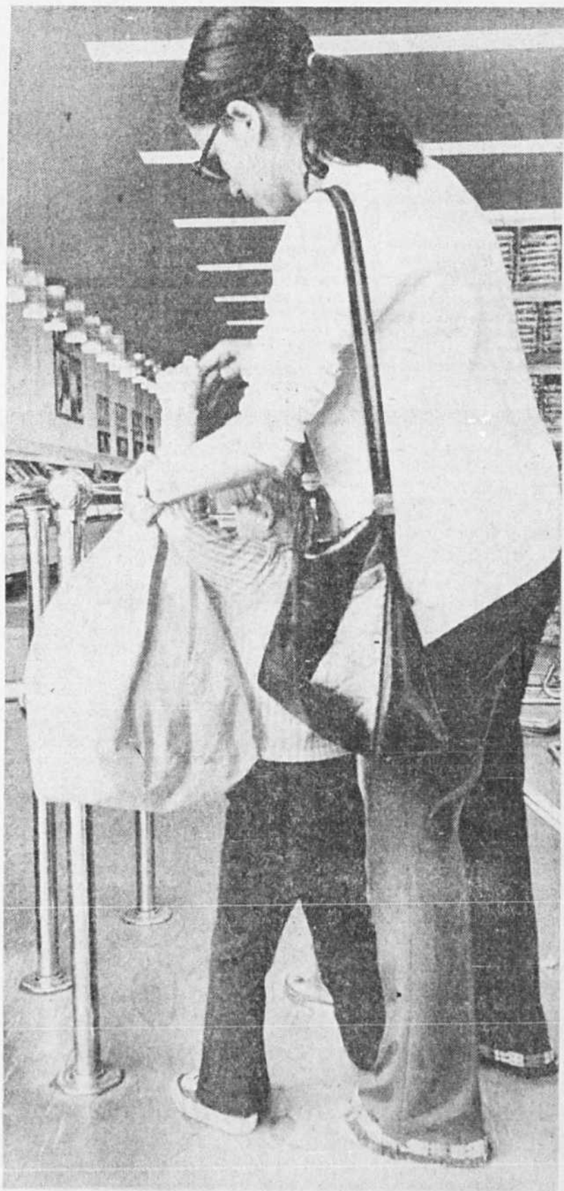
Une mère de famille rencontrée au hasard près d'un supermarché, rue Ste-Catherine, a bien voulu nous montrer comment il était difficile et même dangereux de passer les portes tournantes avec un jeune enfant. "Il a failli se casser un bras dans ce tourniquet le mois dernier".