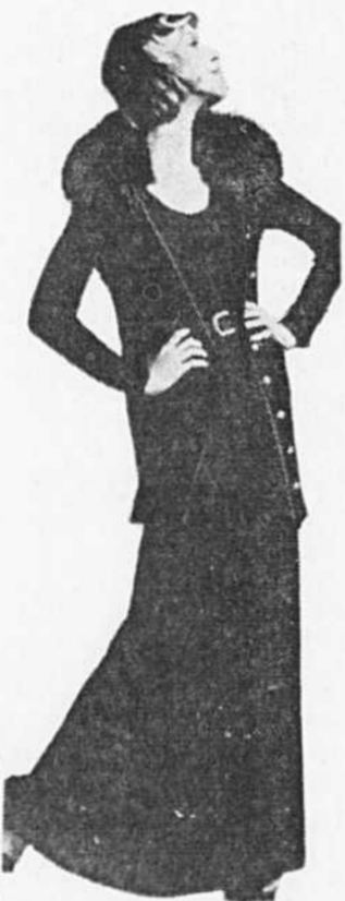
Une entrée triomphale pour un costume du soir en jersey mat porté avec un long chandail garni de fourrure. Signé Pat Sandier.