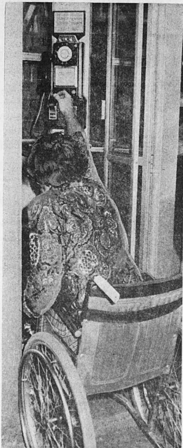
Les handicapés utilisant la chaise roulante pour se déplacer ont à faire face à de nombreux obstacles ou barrières architecturales. Les cabines téléphoniques en sont un exemple: impossible d'y pénétrer non plus que d'atteindre l'appareil.