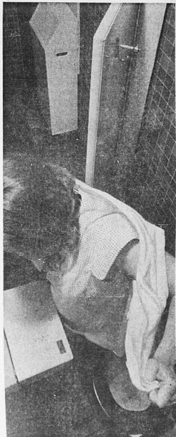
Dans plus d'un édifice public, les salles de toilette sont exigües à ce point qu'il est difficile de s'y mouvoir pour qui n'est pas svelte. Ici, une jeune femme enceinte tente de passer son manteau avant de se glisser hors d'ennui.

Au ministère du Travail, se laissera-t-on convaincre? Et la population "normale", qui n'a pas à affronter chaque jour ces "barrières architecturales", donnera-t-elle son appui à ceux qui disputent le droit d'aller et venir sans mal dans les édifices publics et dans la rue?