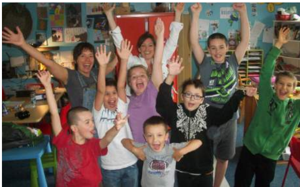
Les élèves de l'école Sacré-Cœur avec leur enseignante.

Par leur chanson, les enfants guident leur auditoire dans une prise de conscience de leurs difficultés.