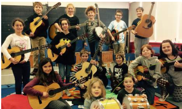
Les élèves faisant partie du Bigband.

Le Bigband réunit tous les élèves qui désirent y participer. Il est donc composé d'élèves de la 1 re à la 6 e année. Le Bigband s'est toutefois donné une importante mission : semer la joie partout où il passe!