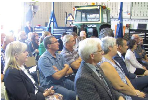
Annonce relative au Programme de Mécanique agricole.