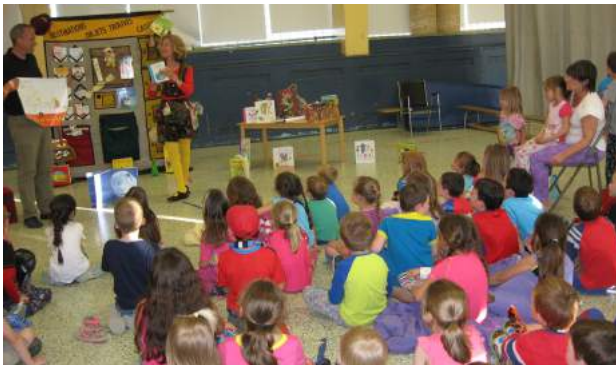
Les élèves de l'école captivés par le conte.