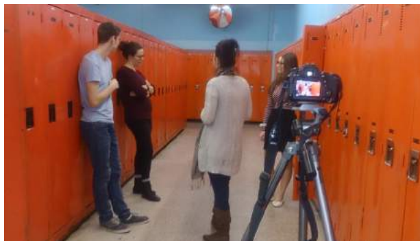
Des élèves de 5 e secondaire tournant des capsules vidéo.

Il s'agit d'une adaptation des Couloirs de la violence amoureuse créée originalement par la Sûreté du Québec et LaPasserelle : une activité thématique présentée sous forme d'un labyrinthe multimédia destinée à prévenir la violence dans les relations amoureuses chez les jeunes.