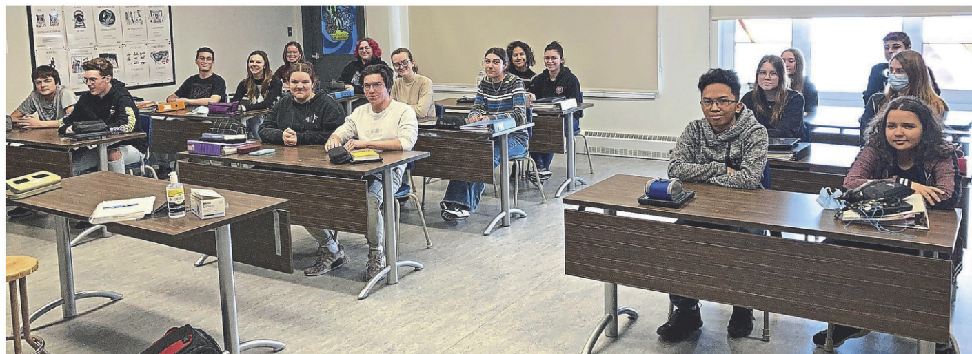
Les élèves de cinquième secondaire ont témoigné de leur expérience au www.lanouvelle.net .

« On a réalisé que plein de choses que l'on ne peut contrôler peuvent survenir, comme le bris d'ascenseur, et qui nous poussent à trouver d'autres solutions », a constaté une élève. « L'acouphène, après un certain temps, amène un mal de tête. En plus, tu dois essayer de comprendre ce que le prof dit en même temps », a observé une adolescente. « Des choses qui