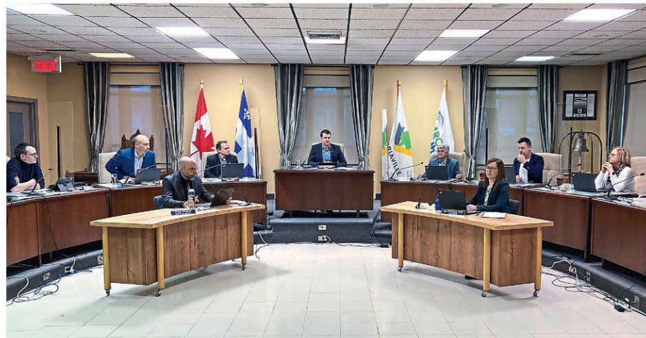
Le conseil municipal a adopté le bilan 2021 du plan d'action des politiques sociales.