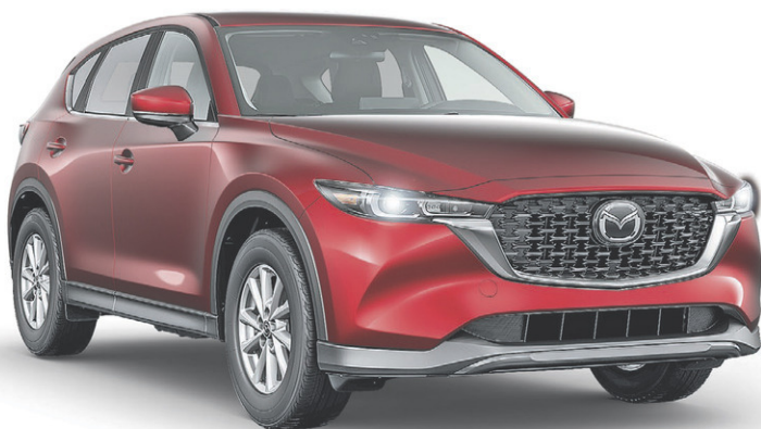
MAZDA CX-5 GX 2022

CONÇU POUR S'ADAPTER À TOUTES LES CONDITIONS TRACTION INTÉGRALE i-ACTIV MAINTENANT DE SÉRIE