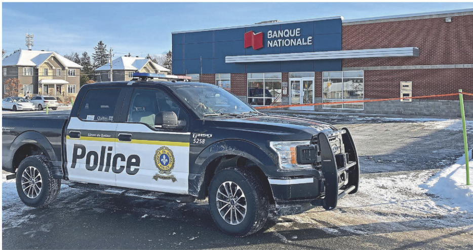
Le braquage est survenu le 21 décembre.

a vu la poursuite déposer contre lui quatre chefs d'accusation de possession de pornographie juvénile, d'avoir accédé et d'avoir rendu disponible un tel matériel. Les faits reprochés au Christophien de 58 ans seraient survenus entre septembre 2013 et juin 2021.