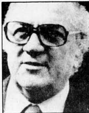
Federico Fellini tournera pour la première fois aux Etats-Unis.

Federico Fellini se déclare fasciné depuis des années par America . «Kafka, qui n'était jamais allé aux Etats-Unis, explique-t-il, a réussi à décrire ce pays en suggérant des images qui sont celles des premiers documentaires de l'histoire du cinéma, des premiers films muets américains».