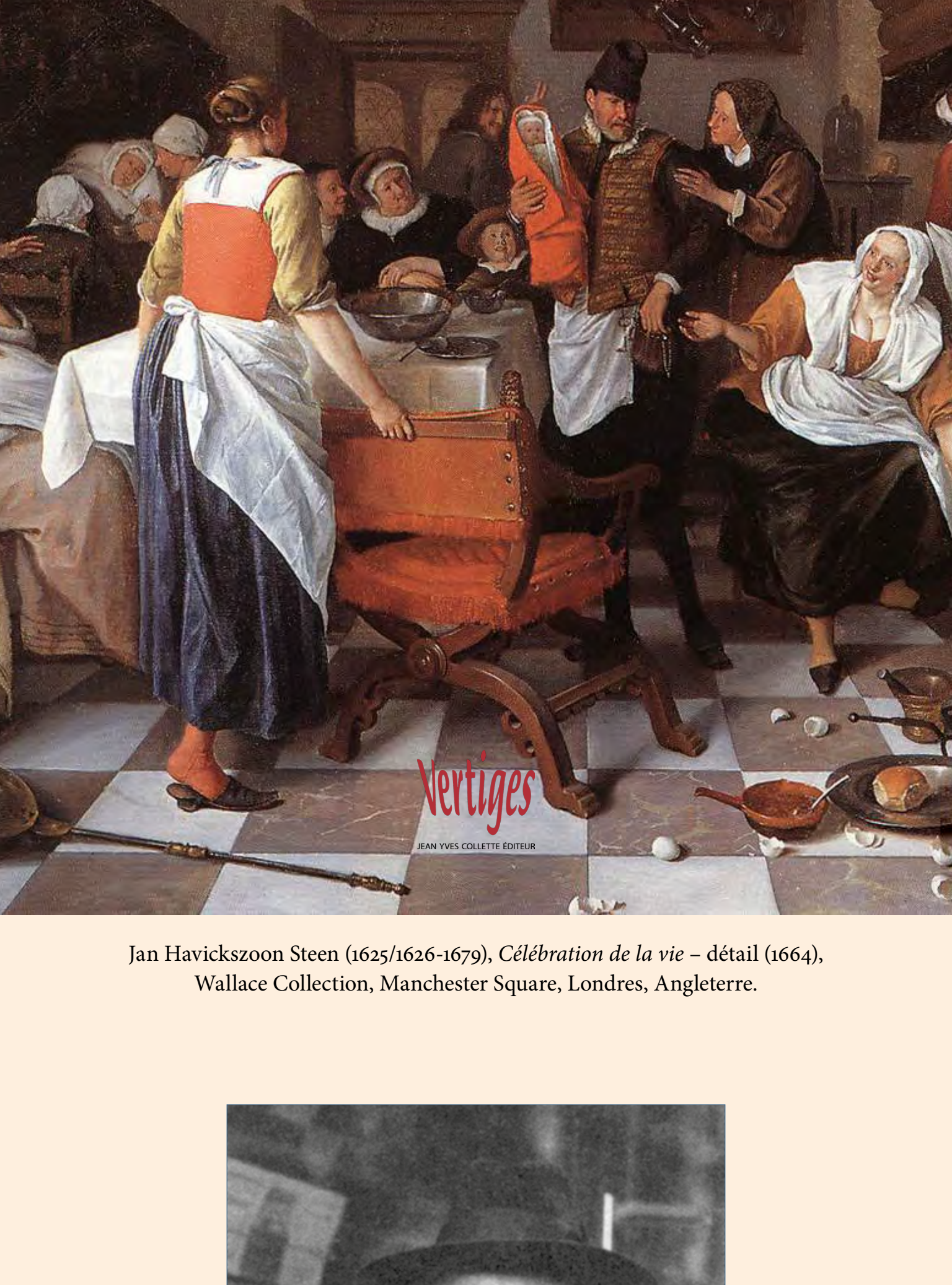
Jan Havickszoon Steen (1625/1626-1679), Célébration de la vie – détail (1664), Wallace Collection, Manchester Square, Londres, Angleterre.