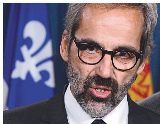
Le successeur de Daniel Paillé sera connu lors du congrès du parti, qui aura lieu du 23 au 25 mai.