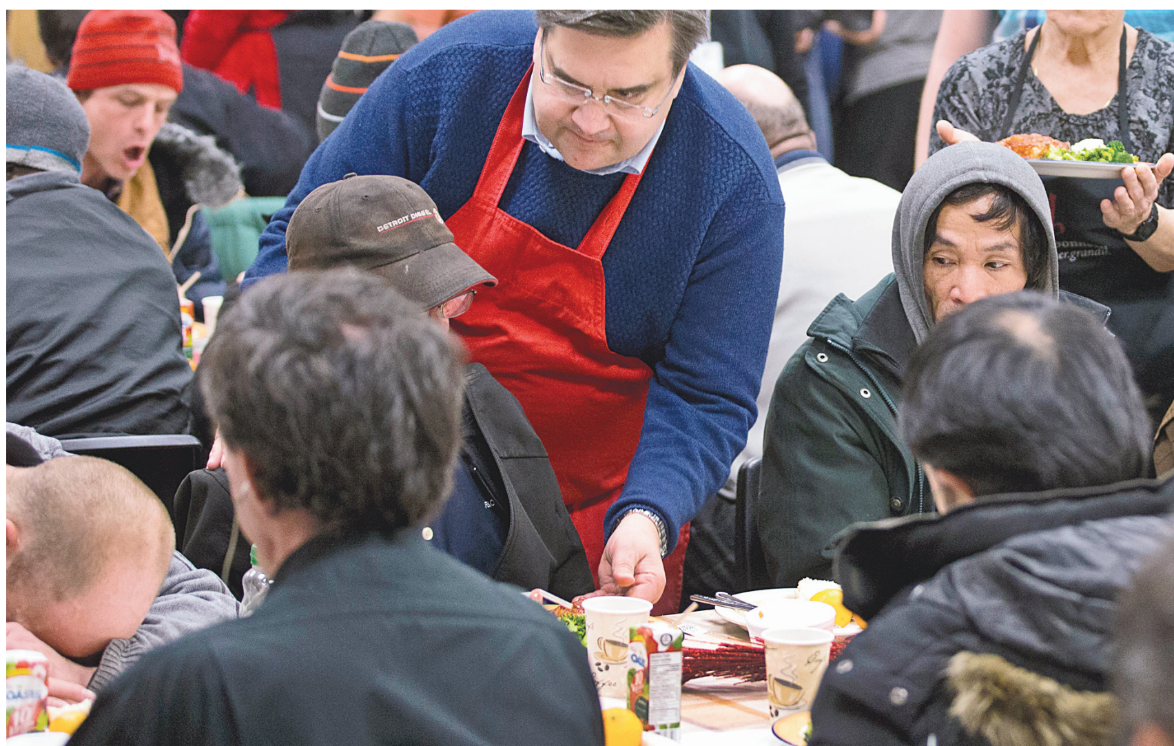
Les engagements du maire Coderre en matière d'itinérance ont été faits en marge du dîner des Rois de l'Accueil Bonneau, où quelque 550 repas chauds ont été servis à des sans-abri, dimanche en mi-journée.