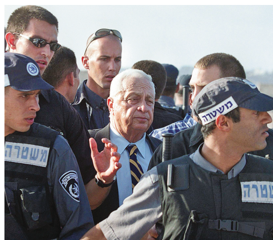
Ariel Sharon entouré de gardes de sécurité sur l'esplanade des Mosquées, le 28 septembre 2000 à Jérusalem.

L'état de santé d'Ariel Sharon avait commencé à se dégrader le 18 décembre 2005, alors qu'il avait