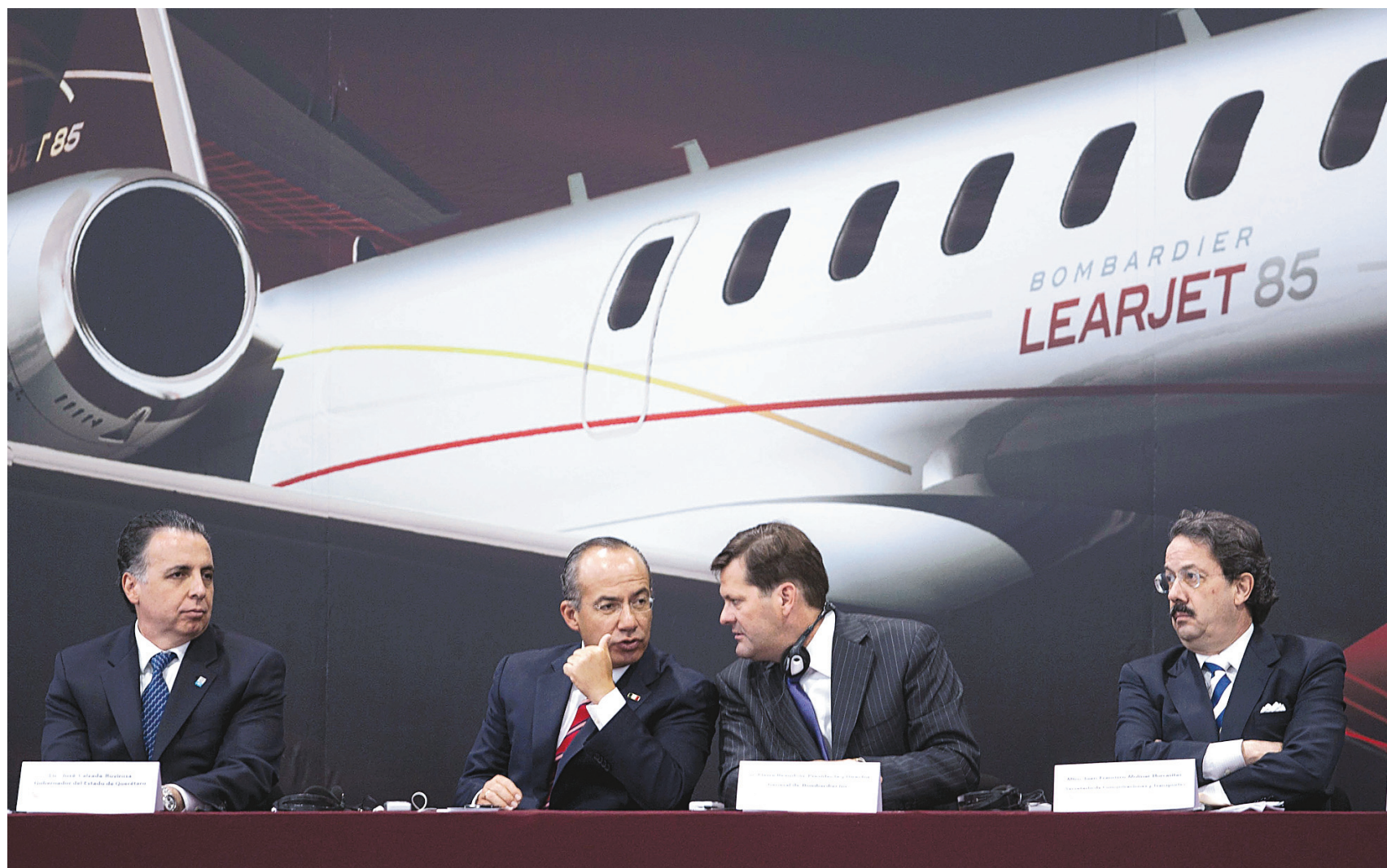
L'installation d'une usine de Bombardier au Mexique est un exemple des pertes d'emplois liées à la délocalisation, mais le phénomène obéit davantage à une logique de mondialisation qu'à celle de la formation d'une zone de libre-échange. Ci-dessus, l'ex-président Felipe Calderón s'adresse au président et chef de la direction de Bombardier, Pierre Beaudoin, lors d'une annonce d'agrandissement à Querétaro en 2010.

En deuxième lieu, loin de devenir plus dépendant des États-Unis, le Canada a plutôt diversifié les débouchés de ses exportations depuis l'entrée en vigueur de l'accord. En effet, en 1994, les