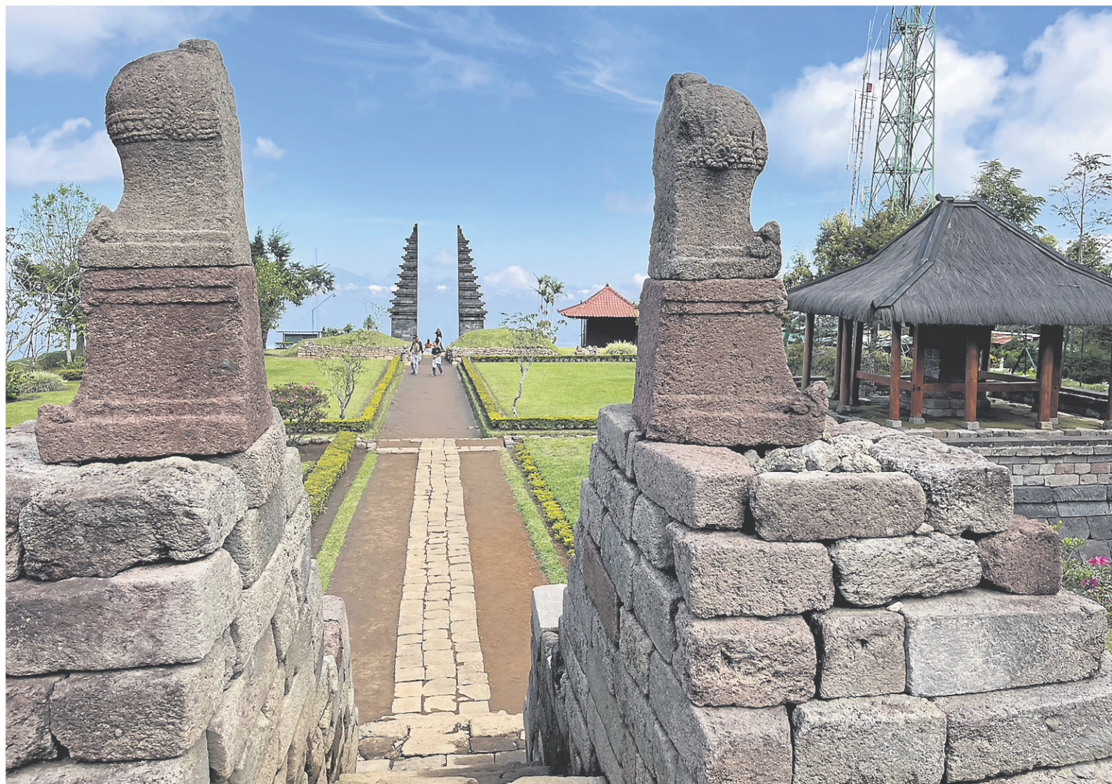
Le temple Cetho rivalise avec les lieux sacrés de Bali, sans les foules.

traditionnels comptent le bakso, des boulettes de viande servies dans un bouillon chaud, le saté, une brochette de bœuf ou de chèvre, ou le nasi liwet, un plat de riz au lait de coco et bouillon de poulet.