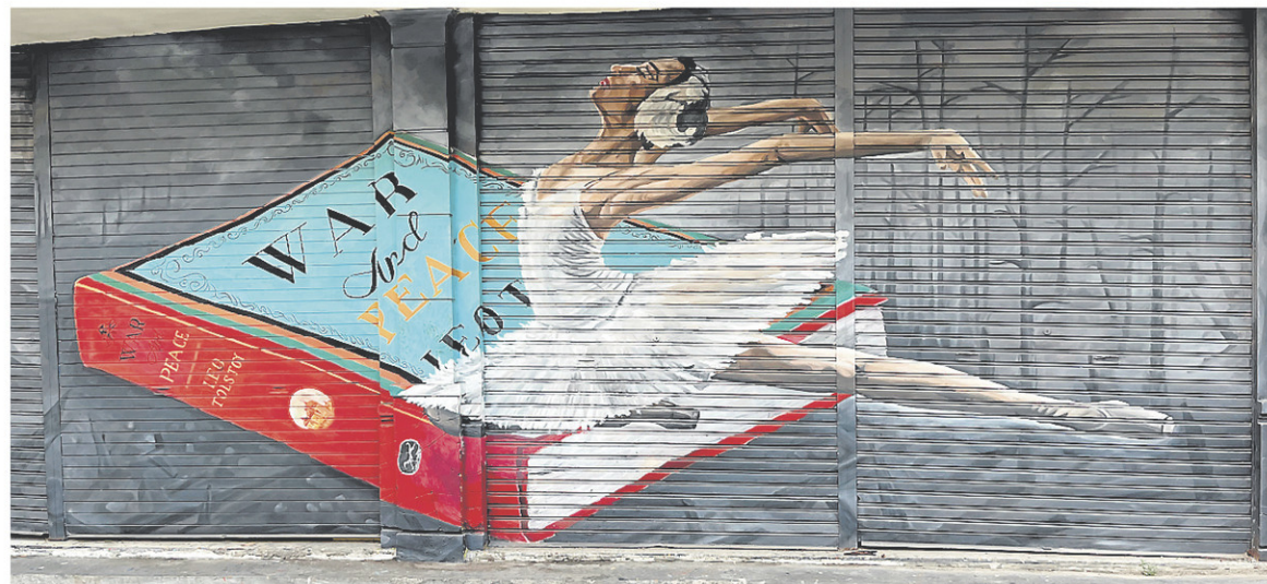
L'art de rue est bien présent à Solo.

Même si les visites sont de courte durée, elles valent la découverte. La route vers Yogyakarta, par la suite, a de quoi décourager avec un temps de déplacement ronflant de plus de trois heures. Plusieurs des villages qui défilent de l'autre côté de la vitre seront néanmoins beaucoup plus intéressants que l'écran d'un téléphone cellulaire pour passer le temps.