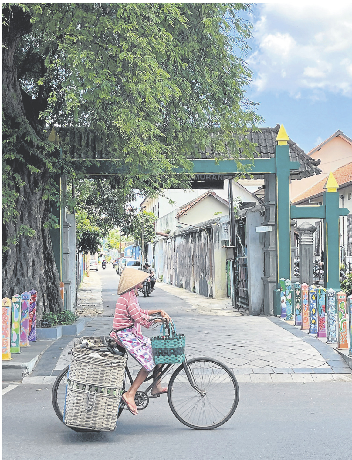
Solo est plus traditionnelle, moins touristique que l'ancienne capitale de Yogyakarta.

En soirée, le point de rendez-vous, c'est notamment le marché culinaire Galabo, avec ses petites tables en plein air et sa dizaine de stands de nourriture. Les plats