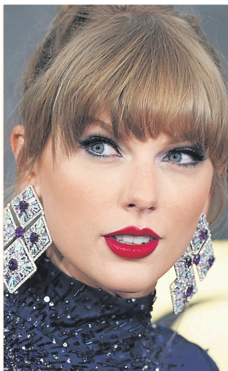
Taylor Swift