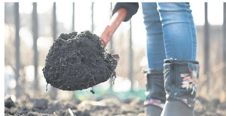
Si vous installez de nouvelles plates-bandes, commencez par un terreau à plantation de qualité.

Les plantes maritimes, malgré leur proximité à l'eau, sont souvent résistantes à la sécheresse. Elles croissent dans les conditions rocheuses, avec peu de matière organique. En outre, le sel qui se retrouve dans le sol rend l'eau plus difficilement assimilable par les végétaux. Le raisin d'ours ( Arctostaphylos uva-ursi ), ce petit arbuste aux feuilles persistantes et au port rampant, est assez commun le long des littoraux, mais aussi en commerce. Le gazon d'Espagne ( Armeria maritima ) est natif non