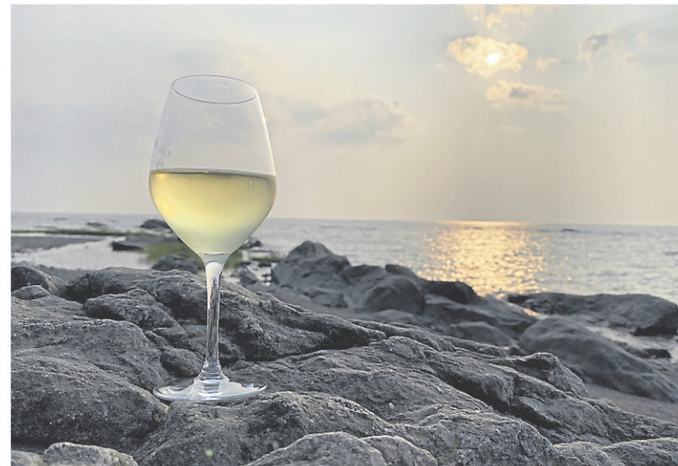
À votre santé et bonnes vacances!

En Loire, la région du Muscadet profite des influences maritimes de l'océan Atlantique. On dit