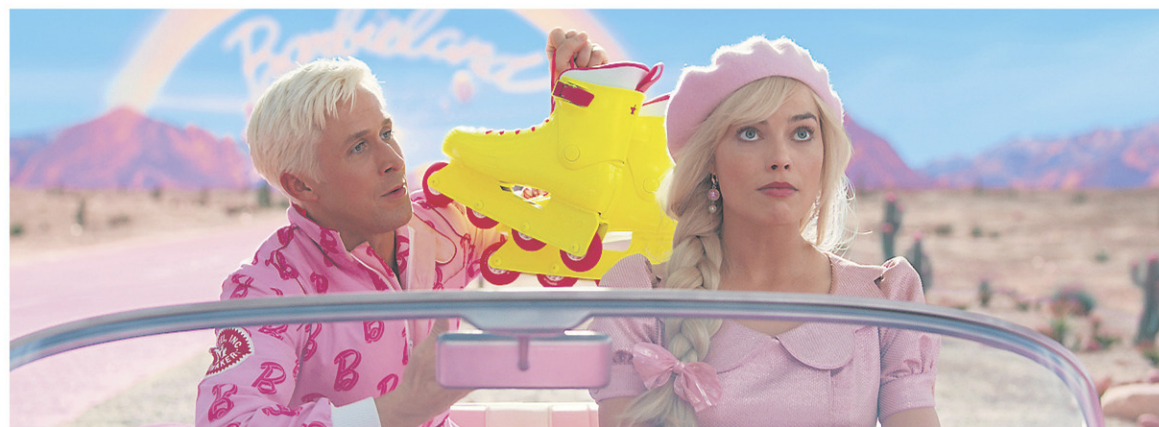
Ryan Gosling et Margot Robbie dans la peau de Ken et Barbie.

Avec l'aide de la savoureuse Barbie bizarre (géniale Kate McKinnon), Barbie se rend dans le vrai monde pour comprendre ce qui cause tous ces problèmes. Une fois