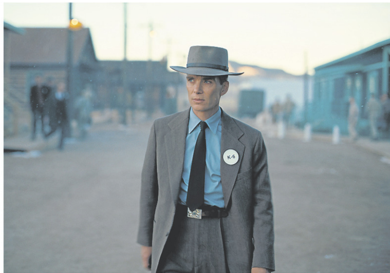
Cillian Murphy dans une scène d' Oppenheimer.

On regarde Oppenheimer comme si on y était. Dans les salles de classe d'universités, dans le village-laboratoire de Los Alamos, dans la pièce exigüe de l'audition de sécurité du physicien. Le réalisateur de Dunkirk et d' Inception parvient à nous y transporter en plaçant sa caméra au milieu de conversations