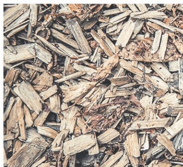
L'application de paillis empêchera les rayons du soleil de toucher la terre directement et de l'assécher.