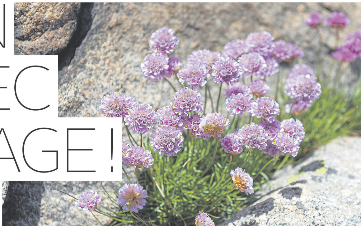
Les plantes maritimes, malgré leur proximité à l'eau, sont souvent résistantes à la sécheresse. Elles croissent dans les conditions rocheuses, avec peu de matière organique.

Donc, si possible, laissez les vivaces mortes en place à l'automne ainsi que les feuilles qui tombent des arbres. Au printemps, résistez à l'envie de «nettoyer» votre jardin en ramassant ces débris organiques. C'est un paillis décomposable efficace et tout à fait gratuit! De la sorte, un jardin bien implanté n'aura besoin ni de compost, ni de paillis additionnel, ni même d'arrosage.