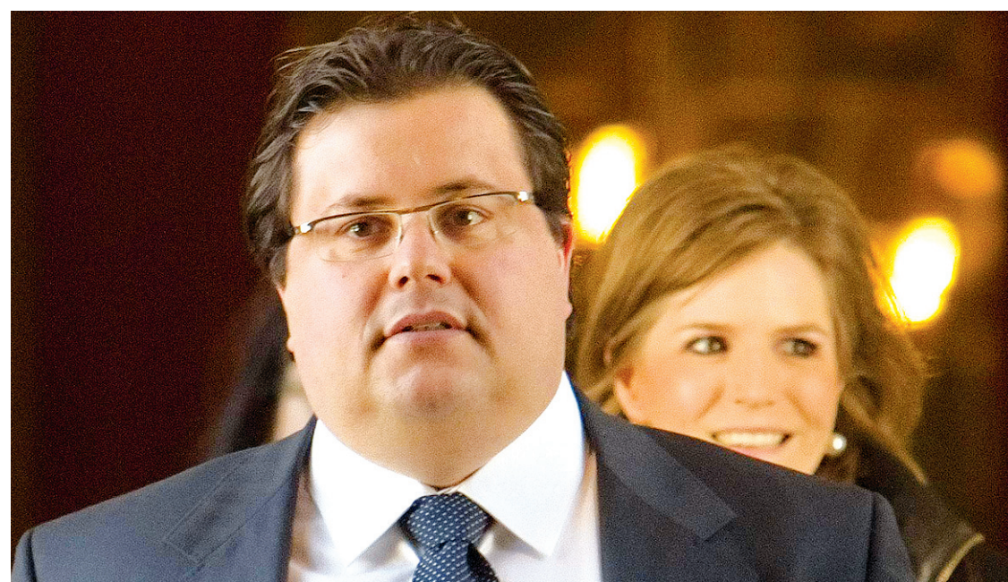
CLÉMENT ALLARD LE DEVOIR

AINSI VA LE JOURNALISME, AINSI VA LA DÉMOCRATIE.