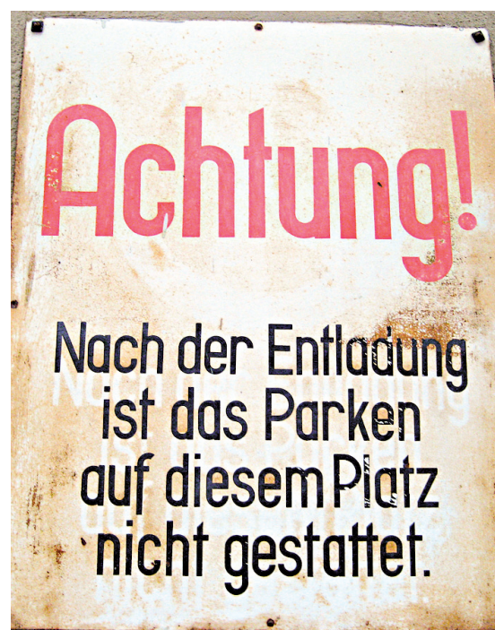
Exemples de typographies urbaines à Berlin, Montréal et Buenos Aires