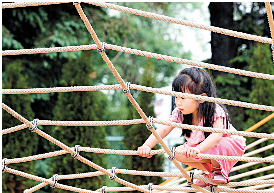
Le Conseil de la famille et de l'enfance est un petit organisme doté d'un budget modeste, dont le rôle consultatif au sein de l'appareil gouvernemental est néanmoins crucial. Il propose au gouvernement et à la société québécoise une mise en perspective de la réalité des familles.

Des avancées très importantes ont été faites au Québec pour soutenir les familles. Toutefois, convenons qu'une véritable politique familiale ne se résume pas à une politique de services de gar-