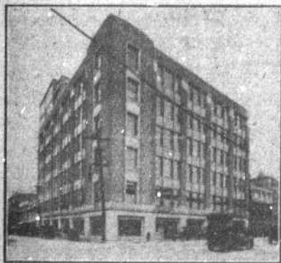
Le nouvel édifice Dupuis Frères, érigé par Archambault & Leclair. Ingénieur: Arth. Surveyl; Architecte: H. S. Labelle.