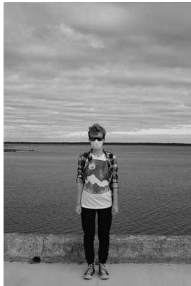
Ensemble, c'est nous (détails) Photographies, impressions numériques couleurs Projet communautaire et exposition, été 2020