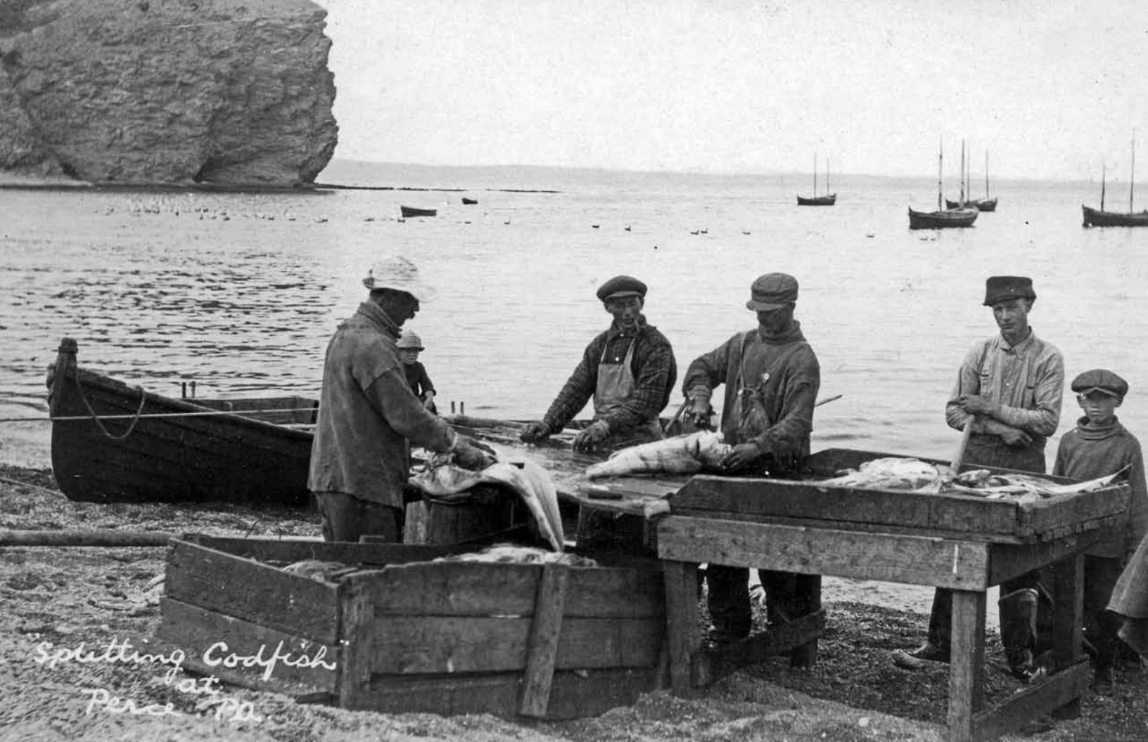
Splitting Codfish at Percé