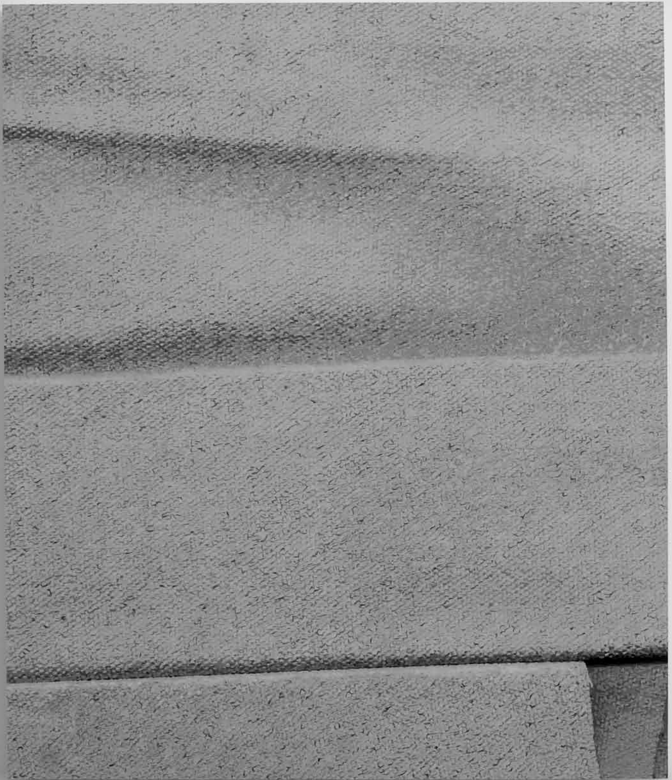
ÉRIC LAMONTAGNE Peinture à numéro 3 , 2015 Acrylique et encre sur bois 59,1 x 50,5 cm Don de l'artiste