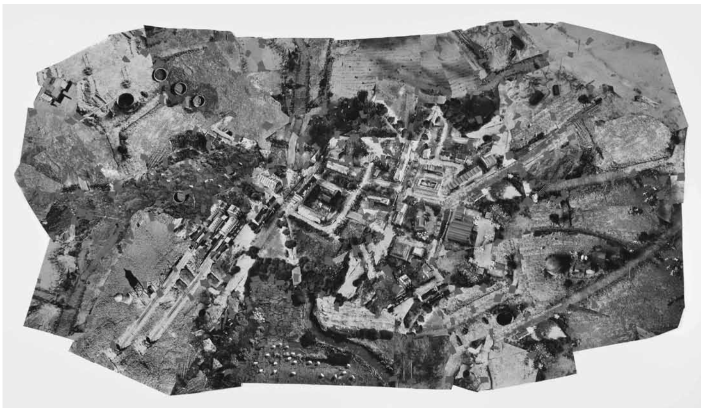
DANIEL CORBEIL Paysage construit n°2 , 2009 Techniques mixtes 108 x 221 cm Don de l'artiste