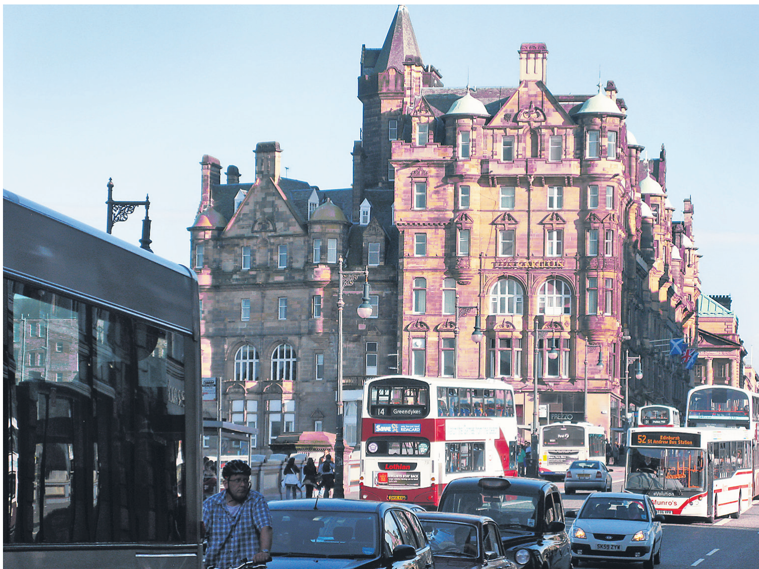
Le Royal Mile relie le château d'Édimbourg au palais Holyroodhouse.

L'Écosse est connue pour ses campagnes, ses châteaux, son whisky et ses terrains de golf. Mais il y a bien d'autres raisons de visiter cette partie du Royaume-Uni, notamment ses deux grandes villes, Édimbourg et Glasgow, où culture, histoire, musique, architecture et design se manifestent partout. So charming!