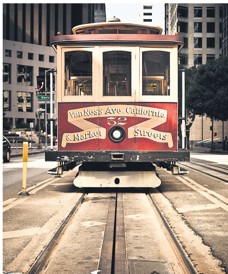
Le cable car est toujours très populaire.