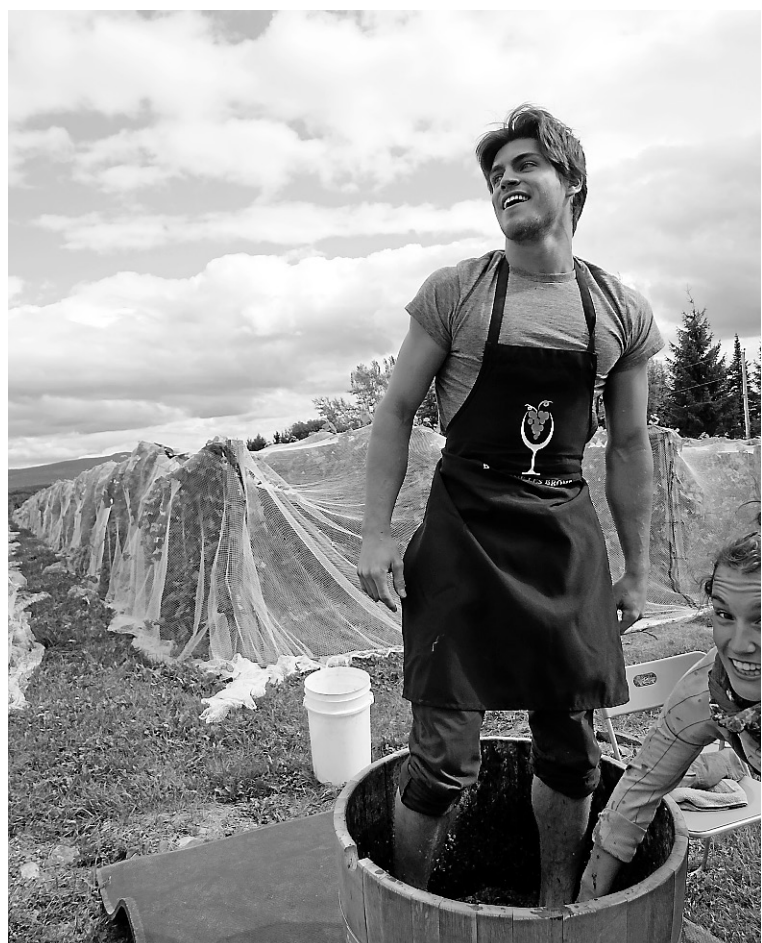
Le premier championnat québécois de foulage de raisins a été organisé au domaine Les Brome, dans le cadre des vendanges 2012.

Pour en savoir davantage : laroutedesvins.ca