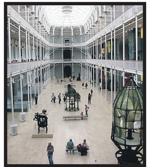
Le National Museum of Scotland.

En soirée, il y a beaucoup d'action dans Grassmarket. L'ancien marché de chevaux (de 1477 à 1911) est devenu un quartier branché où l'on peut boire, manger et participer à la douce exubérance d'Édimbourg.