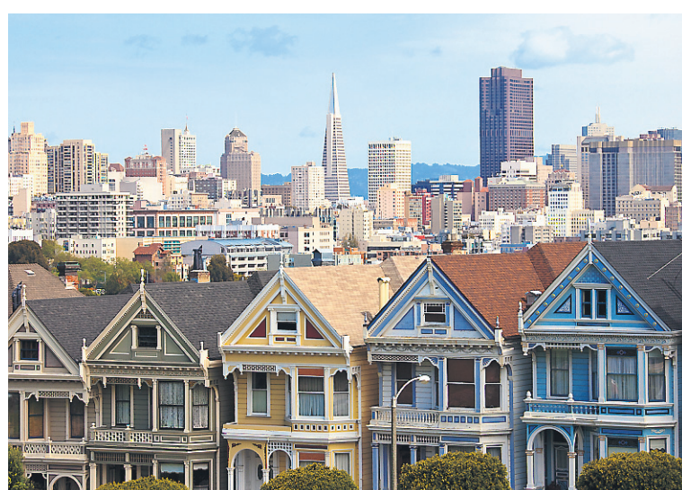
Alamo Square et le centre-ville de San Francisco.