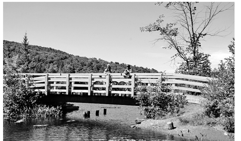
Le panorama à partir du pont traversant le lac du Chevreuil est splendide.

Entre Huberdeau et Saint-Rémi-d'Amherst, la piste cyclable traverse un vieux pont ferroviaire enjambant la rivière Rouge, qui offre des vues splendides sur ce secteur magnifique.