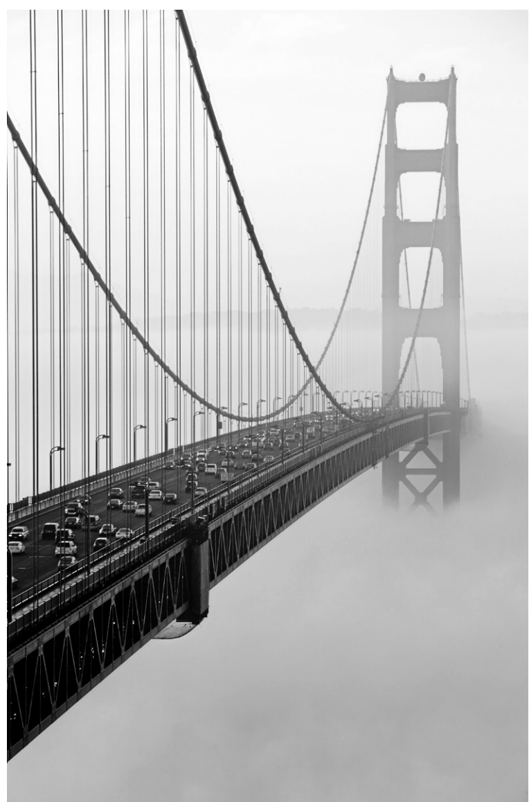
Le Golden Gate à l'aube.