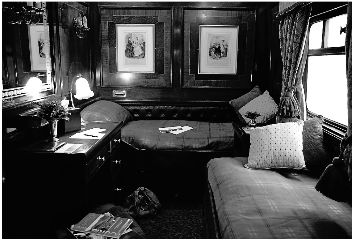
Les chambres sont spacieuses et on y dort bien, car le train s'arrête la nuit.

Chaque jour, au moins une visite est organisée. Lors de l'arrêt dans la petite ville de Wemyss Bay, un traversier nous amène jusqu'à l'île Bute, un trajet d'une quarantaine de minutes. Le château de style gothique Mount Stuart