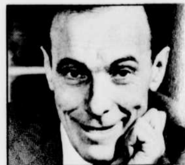
Alexandre BRAILOWSKY, à «L'Heure du concerto», DIMANCHE à 9 h 30.