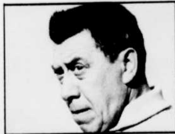
FERNANDEL dans le film «Cocagne», à 13 h 00.