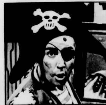
Le Pirate Maboule Monsieur Surprise