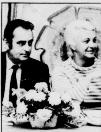
«Place aux femmes»