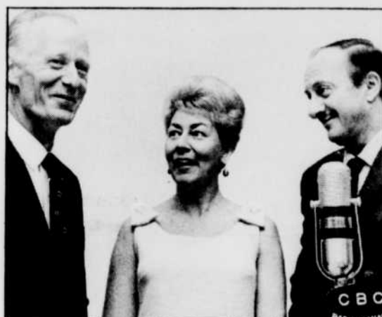
«Les Joyeux Troubadours»

Le 23 janvier dernier, Radio-Canada lançait à Québec l'opération Journée de la radio, en collaboration avec CBV, la station de base de la Société dans la capitale provinciale.