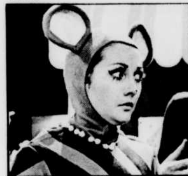
La Souris verte