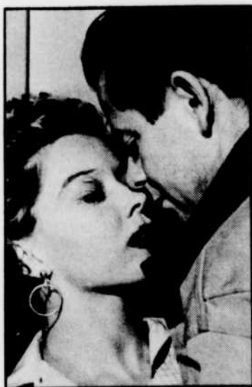
Gloria GRAHAME et Glenn FORD, dans «Désirs humains», à 23 h 30.