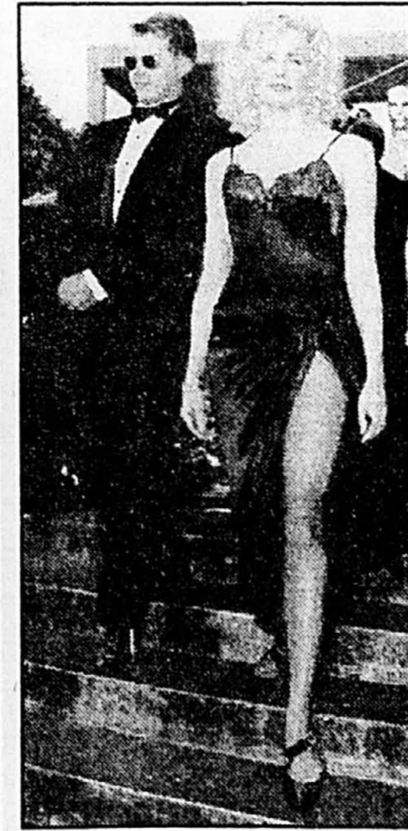
L'actrice Darryl Hannah a fait une entrée remarquée à son arrivée.