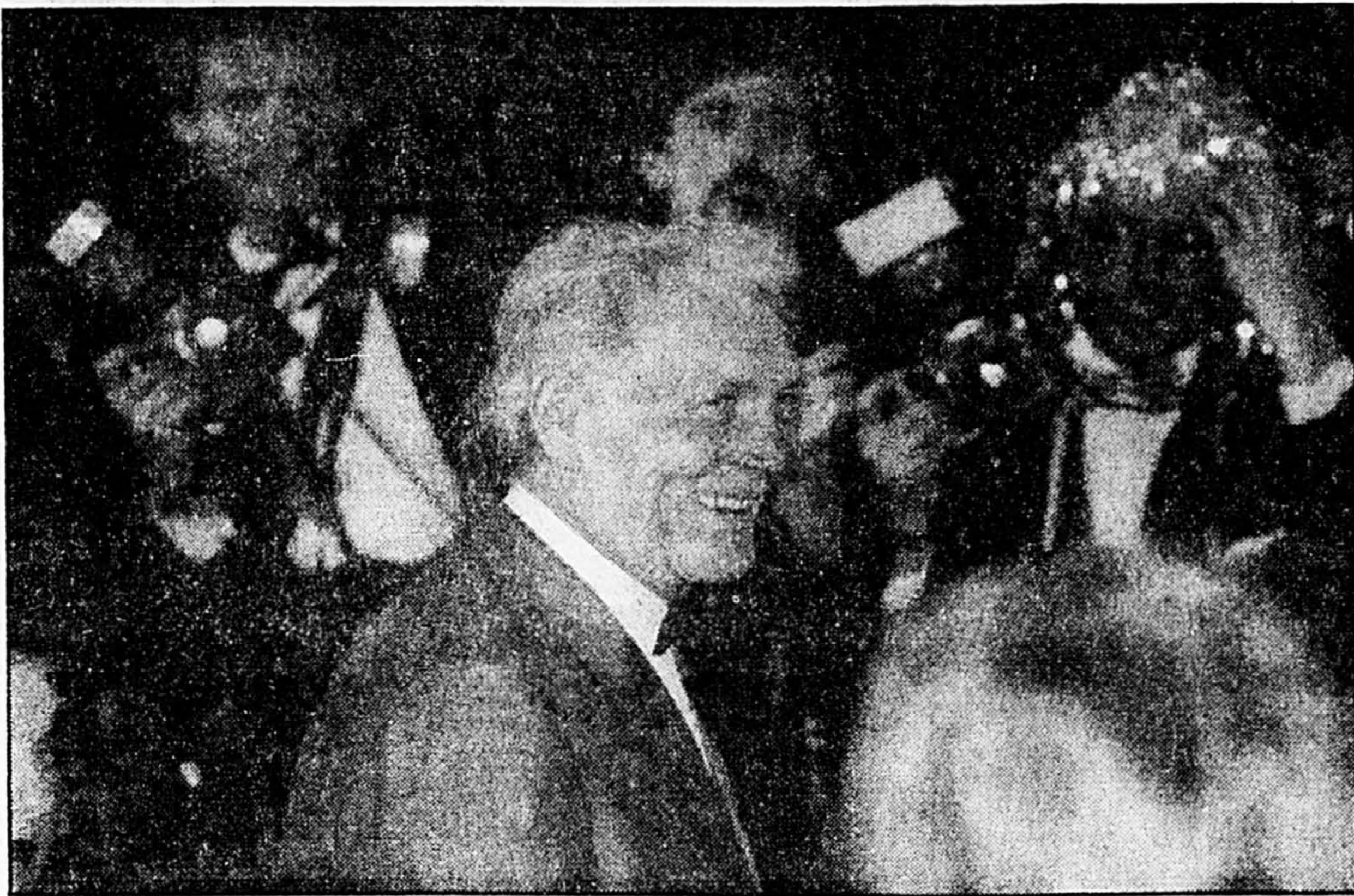
Jack Palance est arrivé optimiste à la remise des Oscars. Il devait remporter celui du meilleur acteur de soutien.