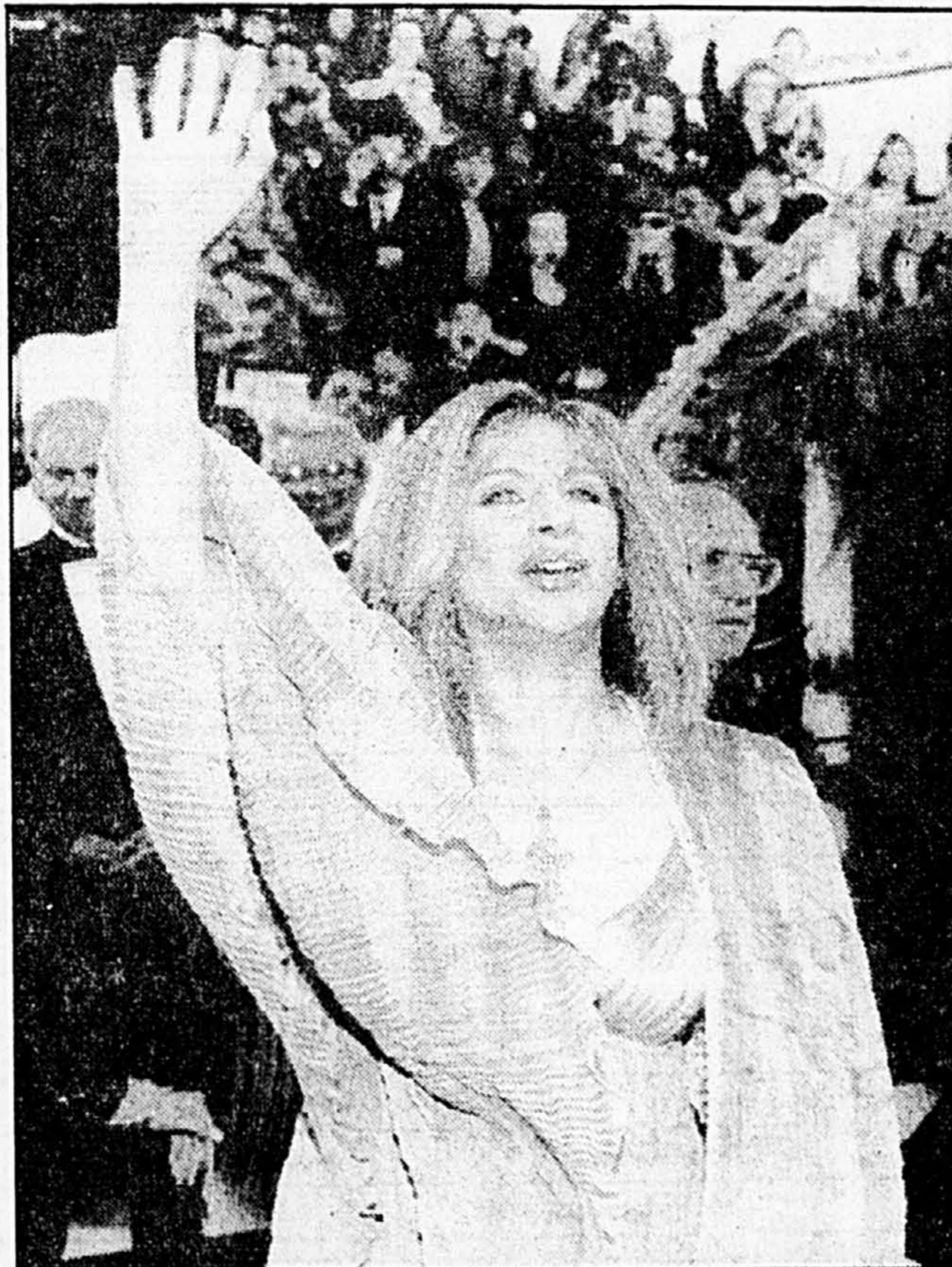
L'éviction de Barbra Streisand de la sélection de la meilleure réalisatrice a déchaîné des accusations de machisme.

Et la presse de rappeler que l'Académie, fondée en 1927, compte moins de 5000 membres, pour beaucoup des anciens d'Hollywood accusés d'être coupés du cinéma moderne. Cette année, l'éviction de Barbra Streisand de la sélection pour la meilleure réalisatrice a déchaîné les accusations de machisme et fait oublier celle du jeune metteur en scène noir John Singleton ( Boyz n The Hood ).