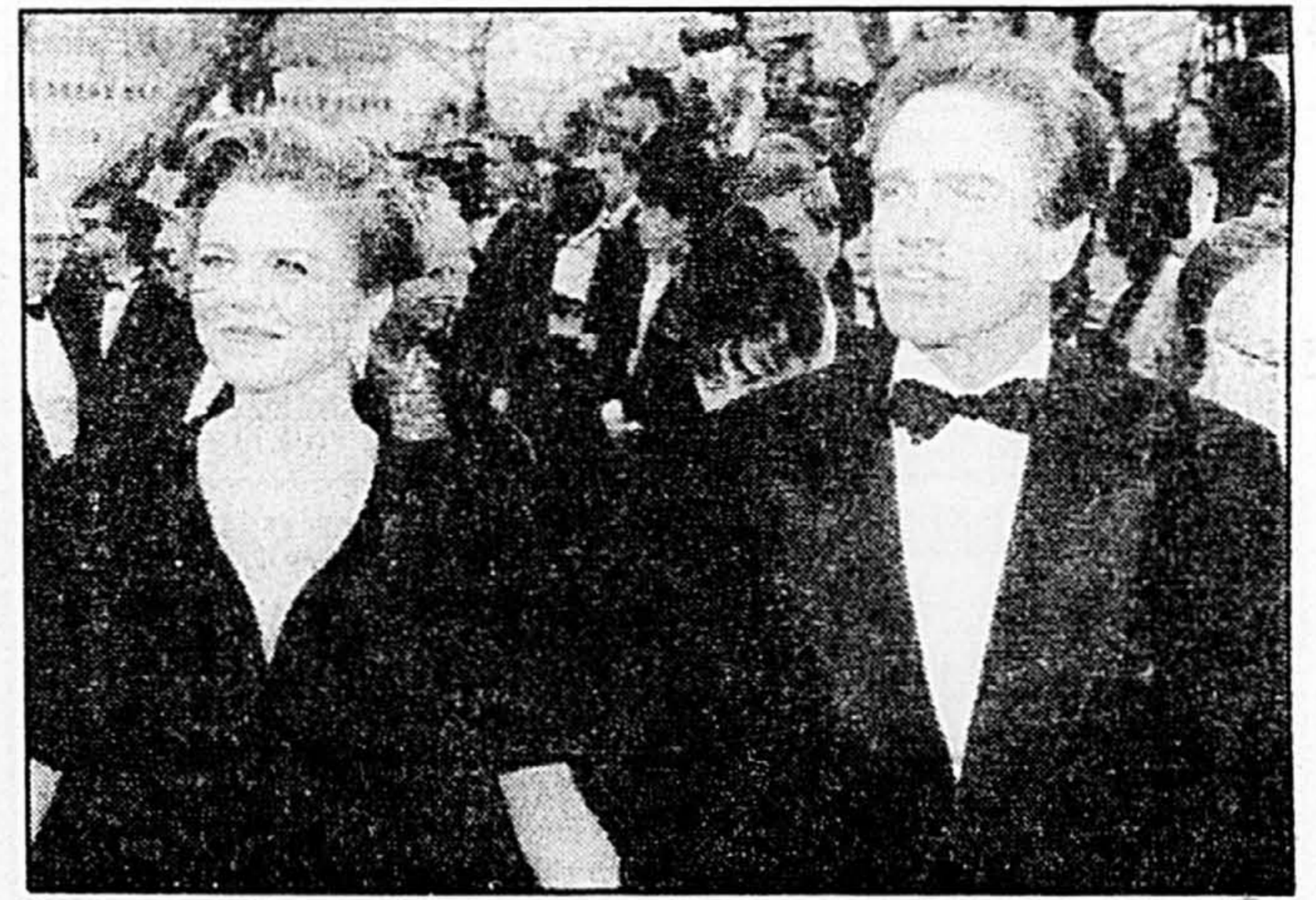
Warren Beatty et sa femme Annette Bening sont au nombre des grands perdants de la cérémonie d'hier soir. Malgré toutes ses mises en nomination, leur film «Bugsy» n'a pas tenu ses promesses.

Mais c'est à charge de revanche. Beauty and the Beast atteignait la dixième position du palmarès cette semaine, et continue de monter. Et c'est aujourd'hui même que Céline Dion, qui sera ce soir au Tonight Show de Johnny Carson, lance son deuxième disque en langue anglaise aux USA. Avec bien sûr son duo de Beauty and The Beast .