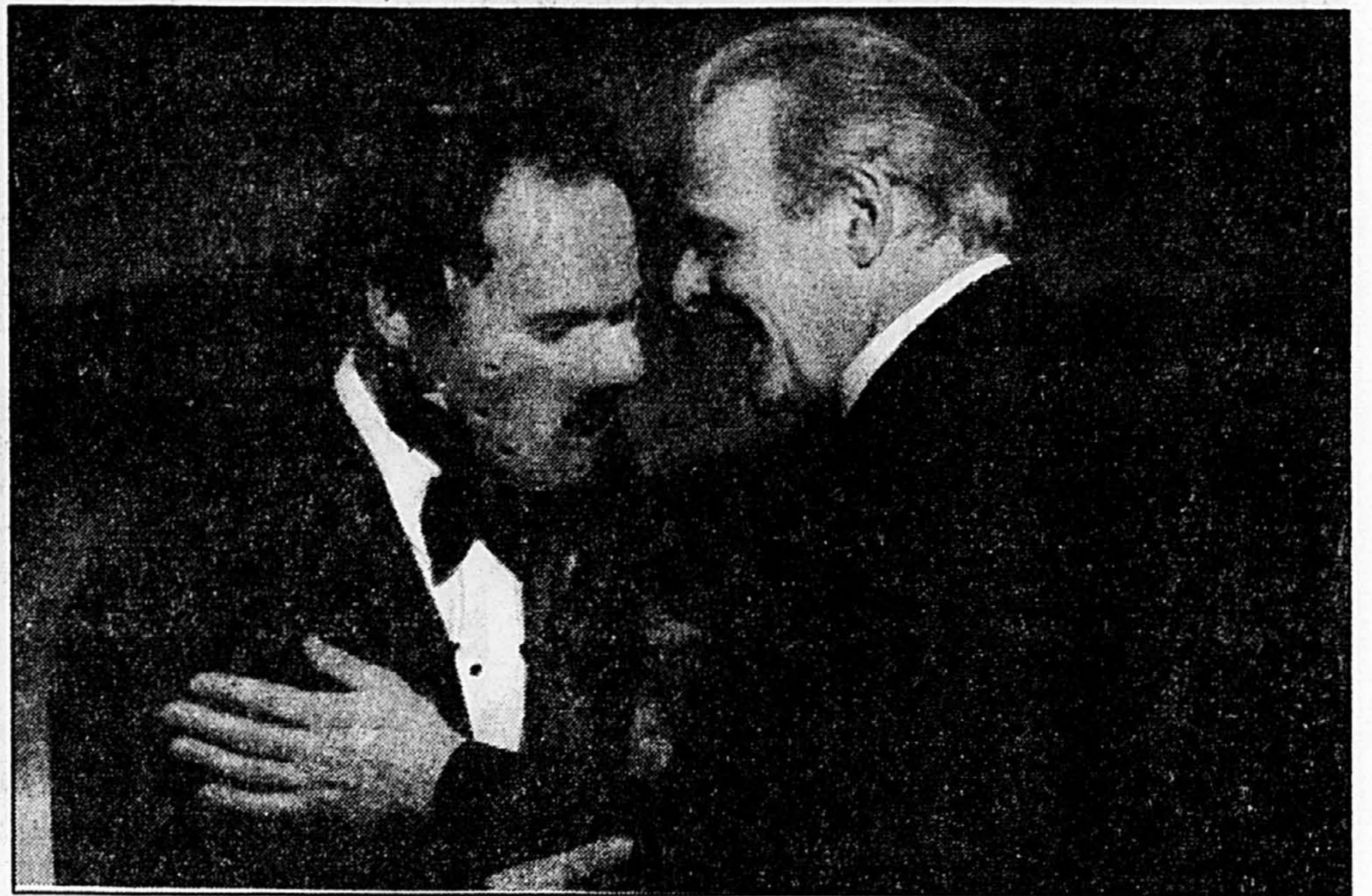
L'animateur Billy Crystal et le lauréat de l'Oscar du meilleur acteur, Anthony Hopkins, ont plaisanté ensemble.