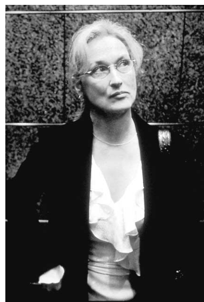
Meryl Streep obtient une 13 e nomination aux Oscars pour son rôle de soutien dans Adaptation , fracassant ainsi le record détenu par Katharine Hepburn.

> La comédienne Meryl Streep : « Je suis très honorée d'être mise en nomination et surtout, j'ai le souffle coupé que quelqu'un puisse imaginer que je puisse surpasser l'insurpassable Katherine Hepburn dans quelque catégorie que ce soit. Mais c'est adorable que mon nom soit mentionné dans la même phrase que le sien. »