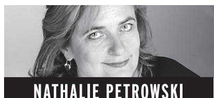
NATHALIE PETROWSKI TÉLÉVISION