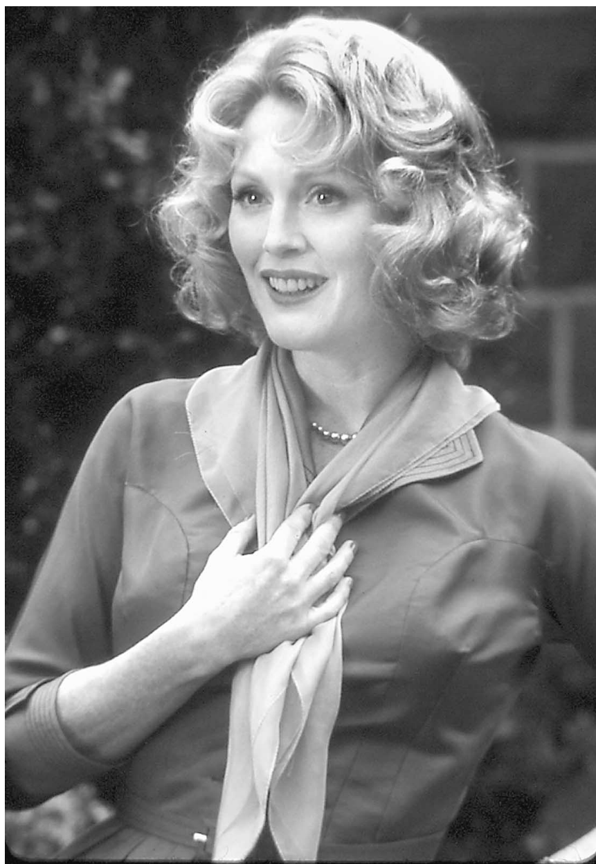
Julianne Moore dans Far from Heaven , qui lui vaut une nomination pour l'Oscar de la meilleure actrice. Elle est aussi en lice pour le meilleur rôle de soutien pour sa performance dans The Hours .

ON AVAIT PRIS l'habitude de voir sa tête d'aristocrate sur toutes les tribunes de cinéma du monde. Patron d'Unifrance, ardent défenseur du cinéma français (on disait de lui qu'il en était le meilleur ambassadeur), Daniel Toscan du Plantier est mort hier à Berlin d'un arrêt cardiaque à l'âge de 61 ans (voir aussi autre texte plus bas). Le directeur du festival, Dieter Kosslick, visiblement très ému, est monté sur la scène du Berlinale Palast après la projection de soirée du film de Patrice Chéreau — un film français que celui qu'on appelait « Toscan » était bien entendu venu soutenir à la Berlinale — pour annoncer la triste nouvelle à un auditoire médusé.