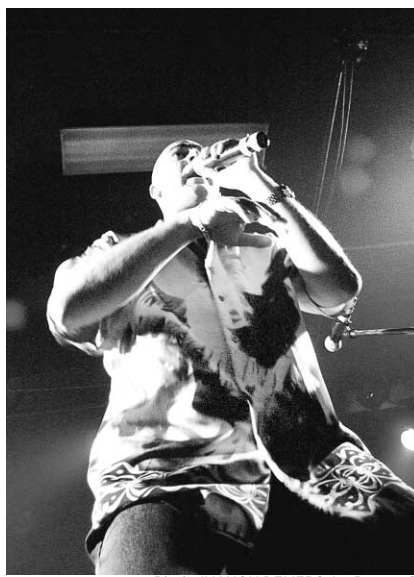
Syncope a offert une solide performance avec son alliage entre rap, reggae et raï.