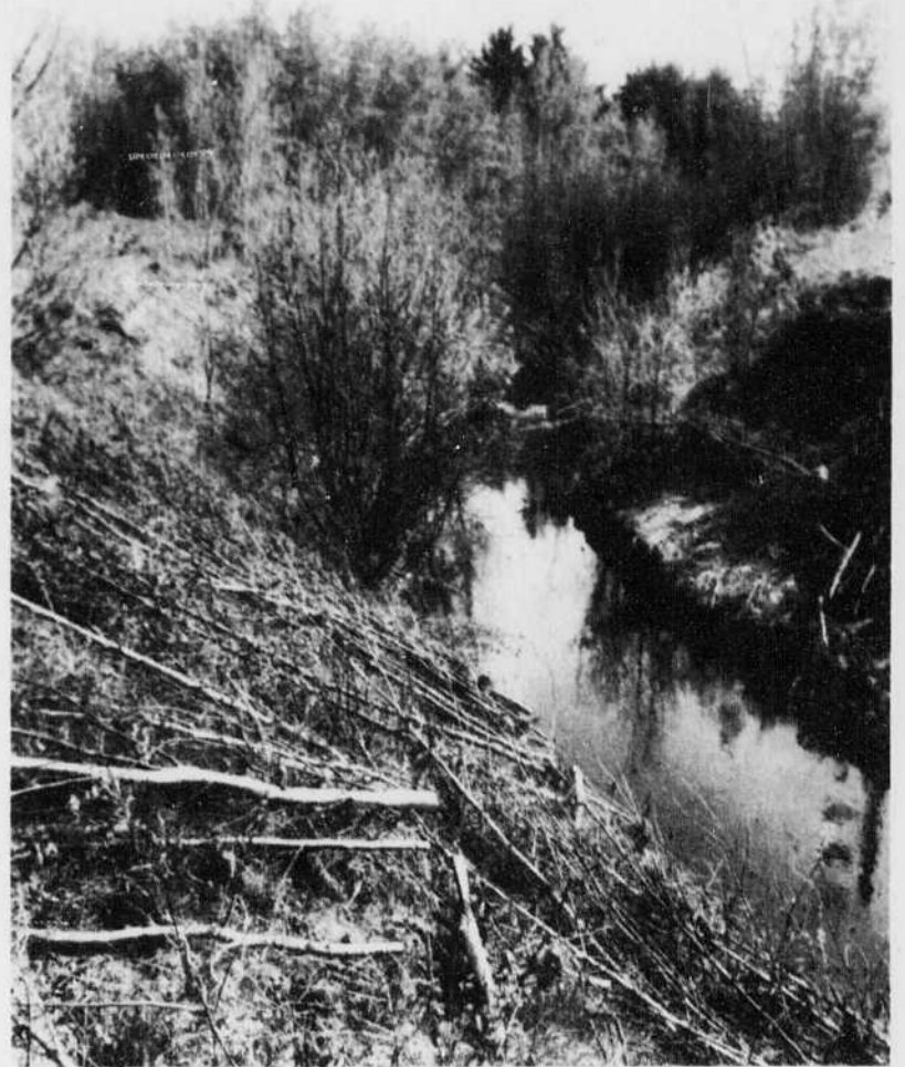
Le Boisé Messier longe la petite rivière Cacouna entre les boulevards Allard et St-Joseph dans le quartier sud de la ville.

Le Boisé du golf était proposé par la compagnie 2551-8234 Québec Inc., comprenant comme principaux investisseurs l'Union-Vie, Construction Centre du Québec et les Services financiers de la Capitale.