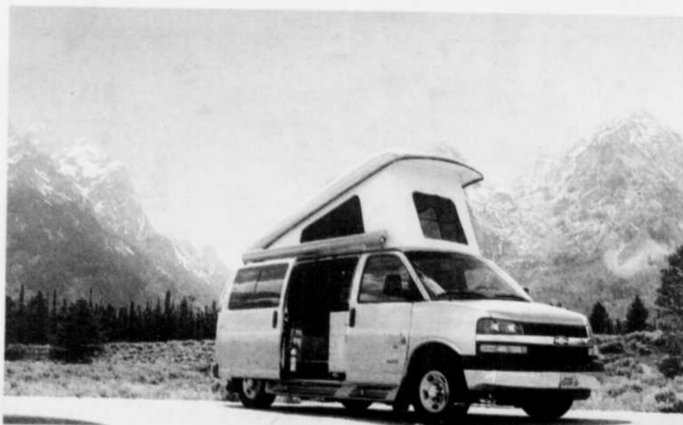
Autocaravane de classe B