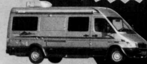
Classe B diesel, 21 pi.

Profitez de notre PROMOTION EXTRAORDINAIRE. Nous venons de réaliser plus de 3 millions dollars de vente au Salon de Montréal.