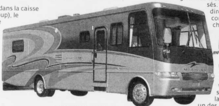
Autocaravane de classe A