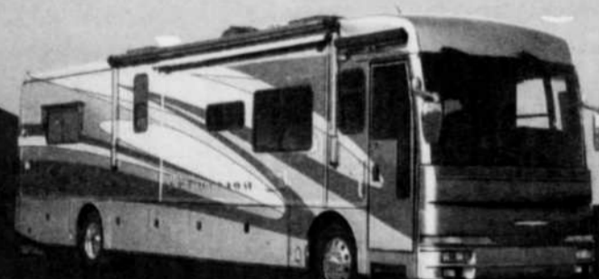
Pusher diesel, 35 à 42 pi.