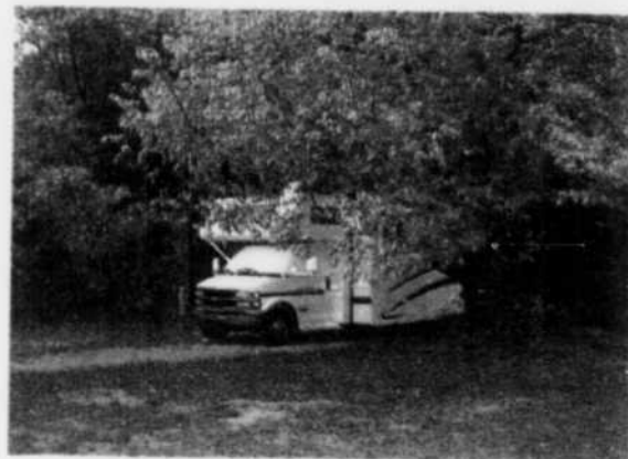
Autocaravane de classe C