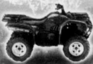
Grizzly 660 2005 « Roi et Maître »

Peu importe votre style, vous trouverez la monture qu'il vous faut!