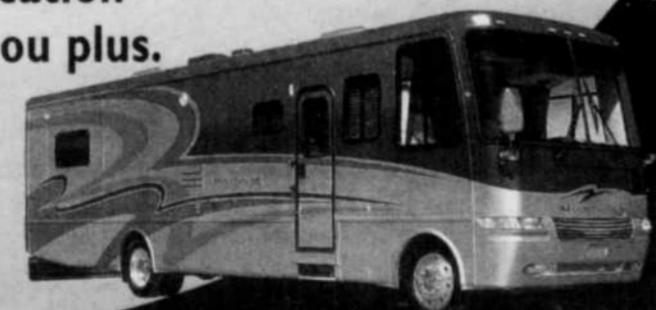
Classe A essence, 26 à 37 pi.