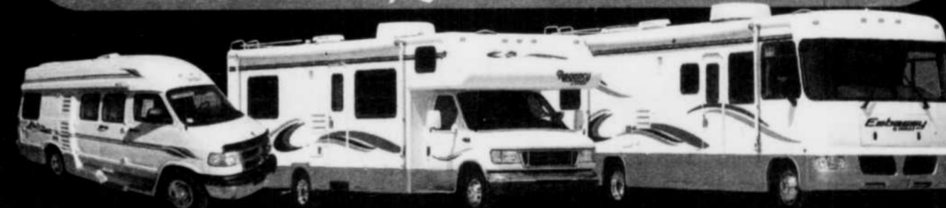
Classe B, 19 pi. 2 personnes