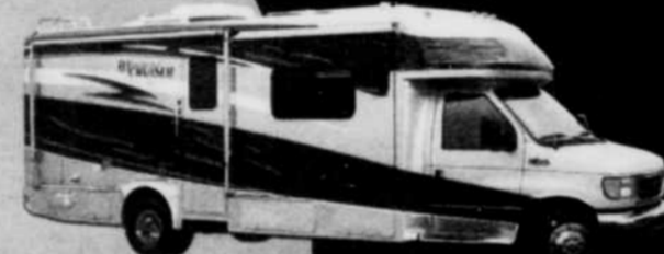
Classe B+, 21 à 29 pi.