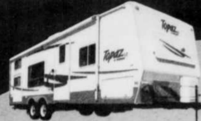
Caravanes, 24 à 32 pi.