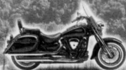
Road Star Midnight Silverado Canadian SE 2005 « Essayez-la »