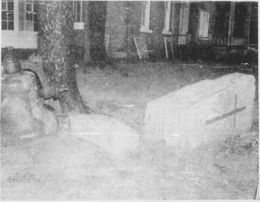
SOUVENIR DU PASSE — Malgré la démolition des ruines de l'église Sainte-Anne de Mattawa, les paroissiens peuvent encore contempler la pierre angulaire et une des cloches de l'église. Sur la pierre on peut lire la date de la construction de l'église, soit 1889. Une autre église sera construite au printemps.