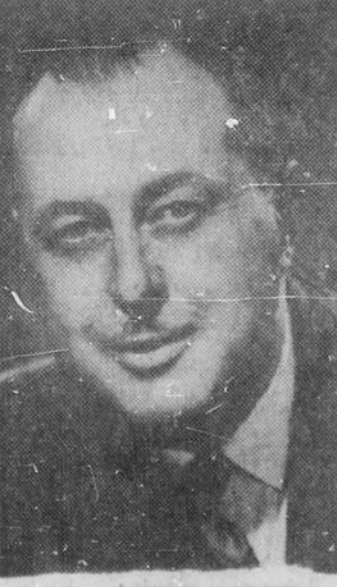
L'hon. PAUL SAUVÉ décédé samedi