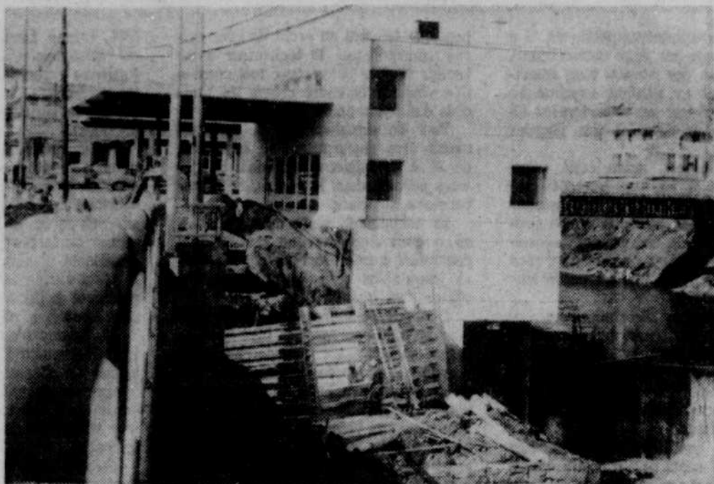
Le nouveau poste de douane de la route 5 (rue Main à Rock Island), est terminé, pour ce qui est de l'intérieur. Les ouvriers sont à construire un mur de soutènement qui sera situé entre l'immeuble et le pont (sans nom) de la rue Main.

BEAUVOIR — Le Cinéma populaire de Perspectives-Jeunesse présente ce soir à Beauvoir une production de l'Office national du film intitulée "Pour la suite du monde". On peut assister à la représentation tout à fait gratuitement.