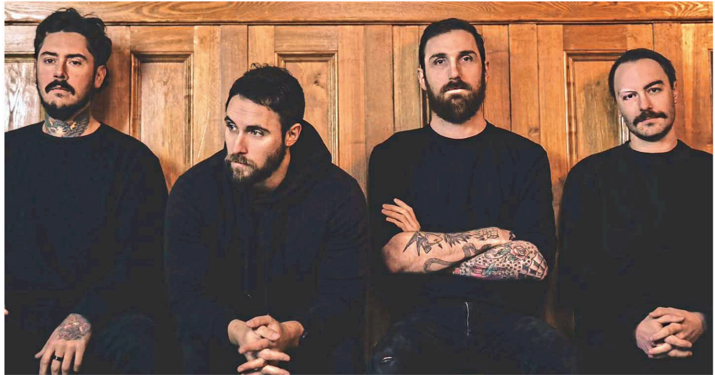
La formation « De Mal en pire » a participé aux 29es Francouvertes, l'une des vitrines majeures de la scène musicale francophone québécoise émergente.

Le passage du quatuor au concours a été des plus bénéfiques en matière de visibilité. « On n'a peut-être pas passé à la deuxième ronde, mais je vois déjà l'impact que les