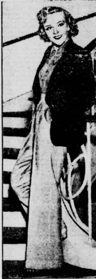
ESTHER MUIR, vedette de l'écran que l'on verra plus tard dans "On Again-Off", qu'elle tourne actuellement, photographiée chez elle.