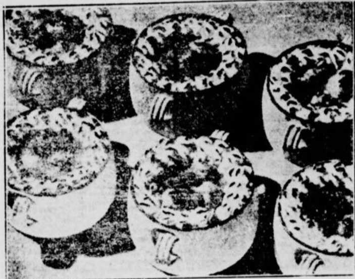
Ragoût d'agneau et de fèves de lima servi dans des petites casseroles individuelles avec une bordure de pommes de terre en purée.

Prenez les os d'eau, laissez mijoter doucement sur un feu bas. Réchauffez l'huile ou la graisse dans une poêle profonde. Faites brunir la viande de tous côtés dans cette graisse.