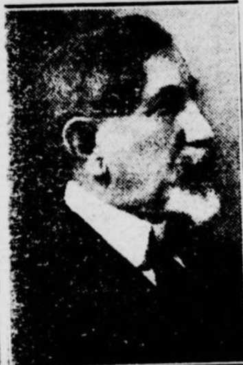
M. Charles MAURRAS

Aucun autre rapport n'a pu être obtenu du garde-côtes Itasca, concernant les lueurs observées. Son message fut intercepté par une station d'Honolulu qui s'est jointe à nombres d'autres qui sont constamment aux écoutes, dans l'espoir de capter enfin un appel de KHAQQ le signale attribué à Mlle Earhart.