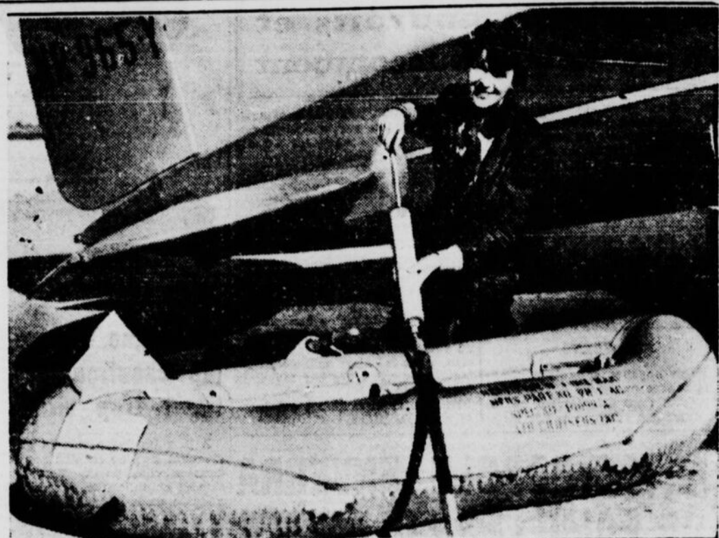
On voit ici Amelia Earhart durant ses préparatifs pour une envolée autour du monde à San Francisco, alors qu'elle souffle un petit radeau qui fait partie de son équipement dans "son laboratoire volant." Avec son avion améri forcément dans le Pacifique, ce radeau sauvera peut-être la vie de Mile Earhart et de son navigateur, Fred Noonan.