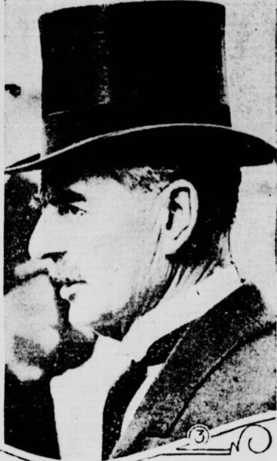
On voit ci-dessus le premier ministre Chamberlain dans trois poses caractéristiques. Qu'il reçoive un degré honorifique de la faculté (1); qu'il parle au microphone (2) ou qu'il remplisse une fonction officielle, en chapeau haut de forme (3), on voit toujours, sous ses épais sourcils, "ses yeux perçants, mais remplis de douceur". On dit que le nouveau premier ministre est un homme absolument intègre et très affable. Il n'a en réalité que deux amours au monde: sa femme et son faible marqué pour une bonne partie de pêche.