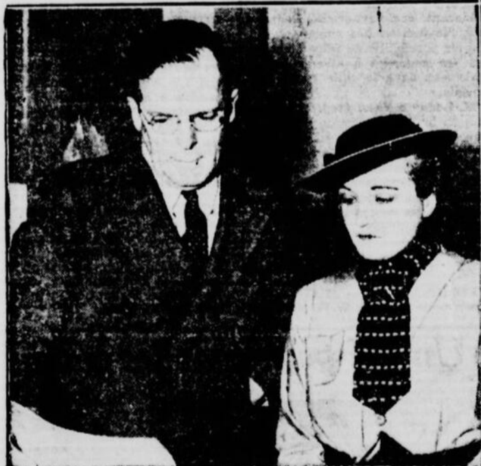
Pendant que l'on recherche au large de l'île Howland, Amelia Earhart, M. Fred Noonan, éditeur d'une revue d'aviation, et Mme Noonan, attendent anxieusement des nouvelles du sauvetage de l'aviatrice. On les voit ici, photographiés aux bureaux de radio de l'aéroport d'Oakland, Californie. A l'heure qu'il est, on n'a pas perdu tout espoir de venir en aide à l'aviatrice.