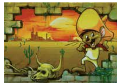
Chalet du parc Joseph-William-Gendron, arrondissement de Saint-Hubert