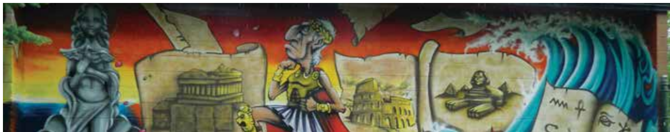
Maison de la Famille le Cavalier, arrondissement du Vieux-Longueuil