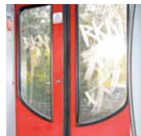
Scraffiti ou scratchiti