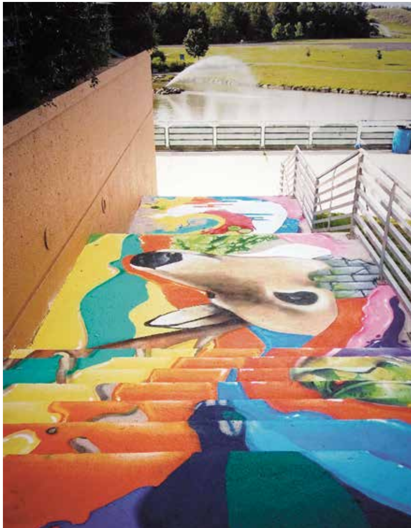
Parc de la Cité, arrondissement de Saint-Hubert

Mur légal : mur dûment identifié où la réalisation d'art urbain est autorisée d'office, pourvu que soient respectées les heures et les surfaces d'utilisation ainsi que des éléments aussi élémentaires que la propreté des lieux et la quiétude des riverains. Certaines restrictions quant aux contenus haineux ou vulgaires s'appliquent également.