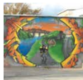
Production ou fresque