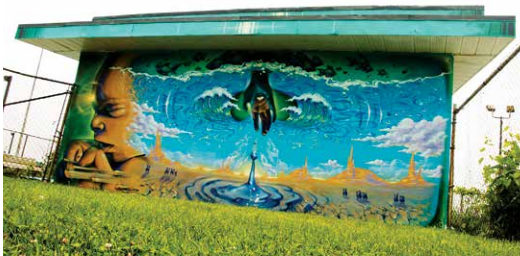
Chalet du parc René-Veillet, arrondissement de Greenfield Park

Cette constatation a pour conséquence logique l'avènement d'une façon alternative de considérer le phénomène de l'art urbain, soit dans une perspective de développement culturel et social. Il n'est donc pas étonnant que cette Politique en art urbain , à travers ses valeurs et ses objectifs, reprenne plusieurs des principes de la Politique culturelle, du Plan de développement social et communautaire et du Plan stratégique de développement durable.