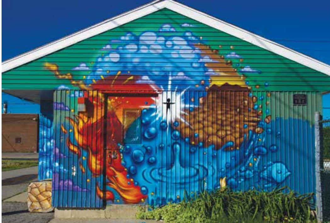
Chalet de la piscine du centre Pierre-et-Bernard-Lucas, arrondissement de Saint-Hubert