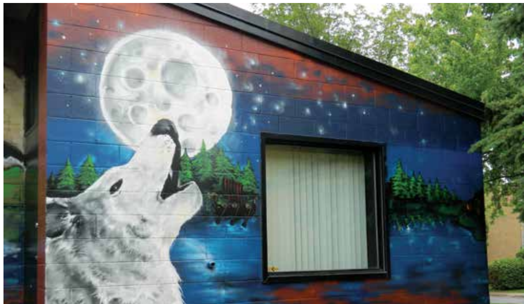
Maison de la Famille le Cavalier, arrondissement du Vieux-Longueuil