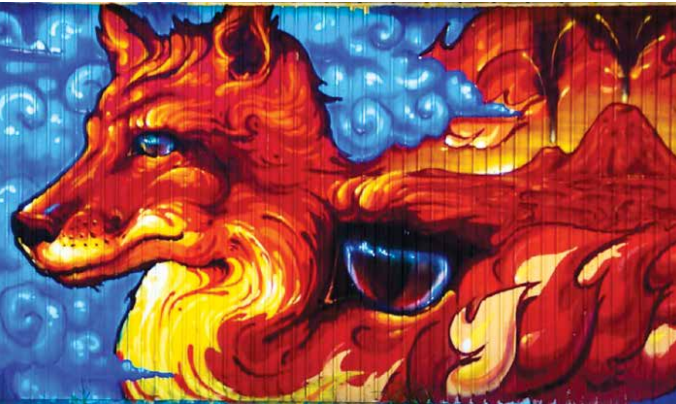
Chalet de la piscine du parc Pierre-et-Bernard-Lucas, arrondissement de Saint-Hubert

Cette politique novatrice permettra à la Ville de Longueuil d'embellir le cadre de vie des citoyens. Créer des espaces d'échanges et de rencontres entre les artistes, les citoyens, les organismes et les écoles; tel est le désir de travailler l'art urbain. Amener un regard complémentaire à un quartier, une ville, par la rencontre de l'art et de l'espace urbain qui œuvrent de concert à animer des lieux.