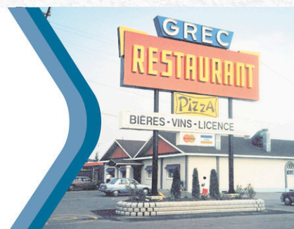
Reconstruction du restaurant après l'incendie de 1975