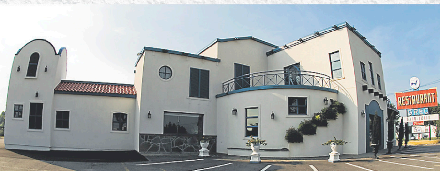
Rénovations et agrandissement