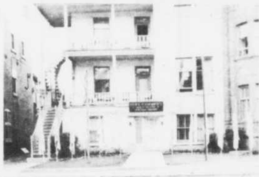
Les bureaux de la Société Saint-Jean-Baptiste, en 1959.