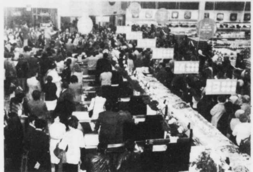
L'inauguration du COOPRIX de Trois-Rivières en 1975 constitue une autre réalisation à laquelle a participé la SSJB.