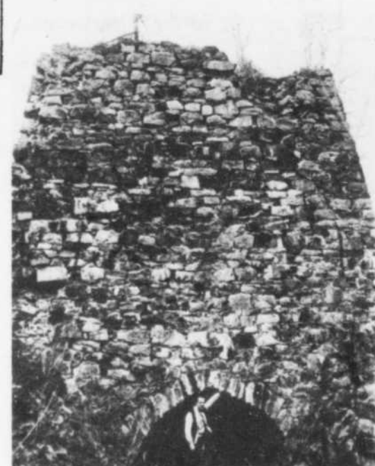
La mine à Grondin, à St-Boniface, représente un exemple de l'implication de la SSJB dans la mise en valeur des sites sidérurgiques en Mauricie.