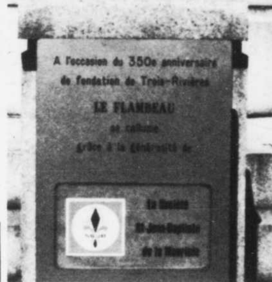
Le flambeau a retrouvé sa flamme en 1984 grâce au soutien de la SSJB.