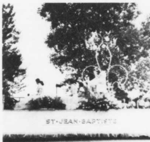
Défilé en 1959.

1958: Obtention d'un Centre d'Études Universitaires à Shawinigan et à Trois-Rivières.