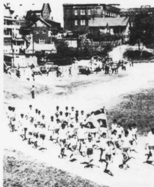
Le symposium des Arts, à Grand-Mère en 1969.