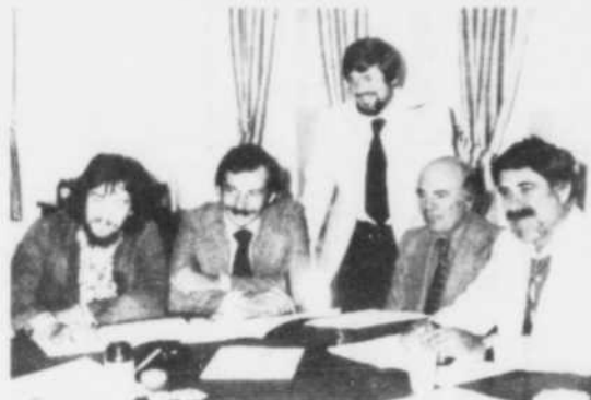
La Société St-Jean-Baptiste a contribué au développement de Radio-Québec dans la région.