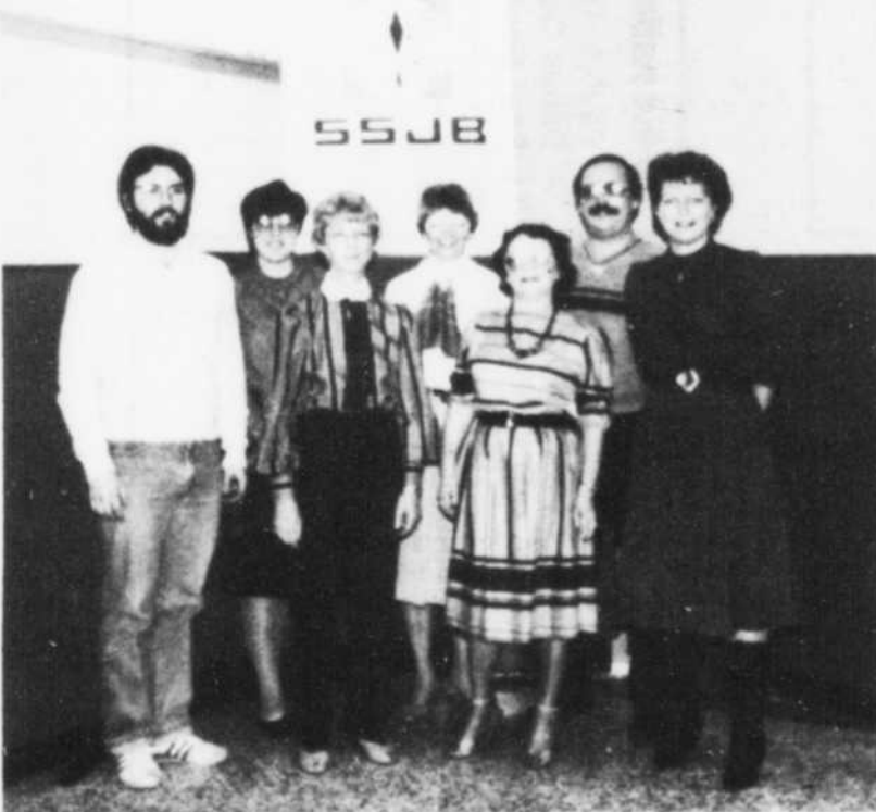
6A / LE NOUVELLISTE, jeudi 6 décembre 1984