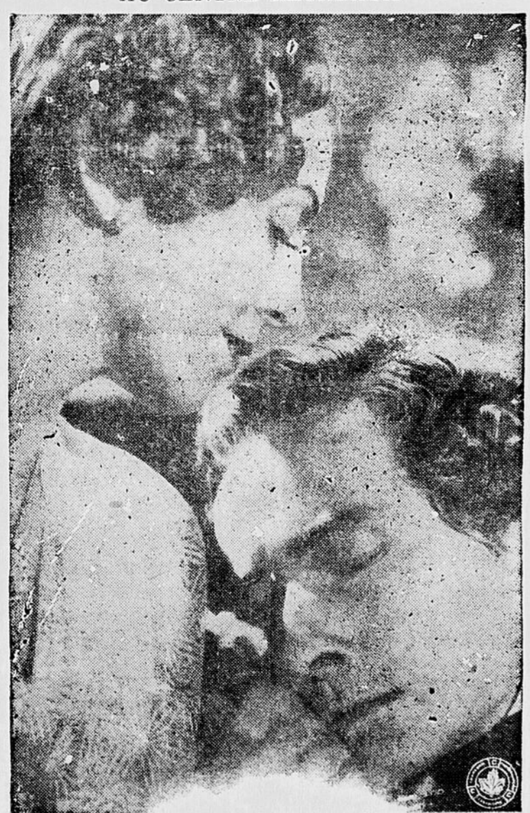
"La Symphonie Fantastique"

Silence dans l'entrée Nous ferons remarquer au public qui fréquente le Centre Récréatif d'observer le silence dans l'entrée car ceci nuit considérablement au spectacle qui a lieu dans le Théâtre Avis aux intéressés.