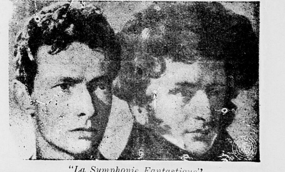
"La Symphonie Fantastique"

PARTIE DE EUCHRE - BRIDGE Tous les jeudis de chaque semaine à 2 heures. 1 prix de présence sera donné. — 1 prix par table. Qu'on se le dise. Après-midi très récréative. L'organisation de la Kermesse