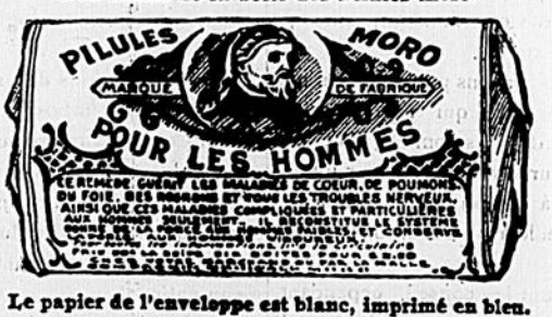
Le papier de l'enveloppe est blanc, imprimé en bleu.

COMPAGNIE MEDICALE MORO 1724 rue St-Catherine, Montréal.