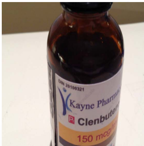
Figure 2 Clenbutérol 150 mcg/ml solution injectable

Une patiente aurait avoué au médecin consultant avoir acheté le produit par l'entremise d'un contact dans un centre d'entraînement sportif (comme la plupart des autres patients). La bouteille de la patiente semblant suspecte, une recherche a été faite sur le site Internet de la compagnie « pharmaceutique » canadienne (figure 2). Après vérification, le DIN (numéro d'identification d'un médicament homologué par Santé Canada) indiqué sur la bouteille de clenbutérol injectable 150 mcg/ml était faux. Malgré qu'il s'agisse d'un produit pour injection, il semble que la patiente le prenait par voie orale. Une analyse urinaire a confirmé la présence de clenbutérol chez cette patiente.