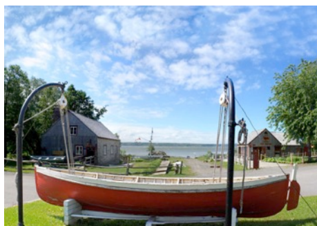
Parc maritime Saint-Laurent

9h30 Accueil à la salle communautaire 10h00 Assemblée annuelle des membres et programme de la journée 12h00 Cocktail santé 12h30 Boîte à lunch 13h30 Conférence sur l'histoire du Moulin Saint-Laurent 14h30 Visite du Parc maritime Saint-Laurent 16h00 Dévoilement d'une plaque commémorative au Moulin 18h00 Souper libre au Moulin Saint-Laurent