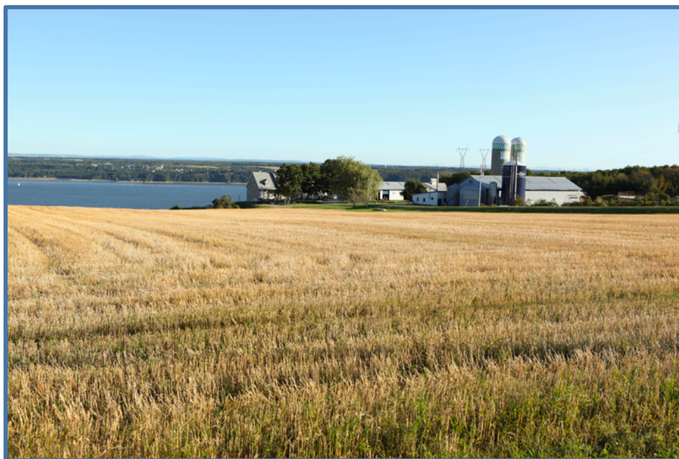
Ferme de Saint-Laurent, Île d'Orléans

Rendez-vous le 13 août 2016 à l'Île d'Orléans Rencontre annuelle des familles Drapeau