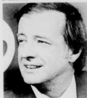
En direct du parc Jarry, à Montréal, les Braves d'Atlanta visitent les Expos de Montréal. Commentateur: Guy Ferron. Analyste: Jean-Pierre Roy. Statisticien: Pierre Murphy. Réal.: Michel Ouidoz.