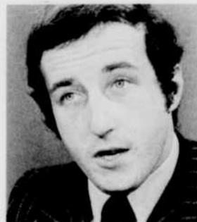
Discours des candidats à la chef-ferie. Reporter: Jean Dumas. Animateur: Bernard Derome. Réal.: Michel Lebel.

14h00 D'HIER À DEMAIN «Un pays, une musique: du haut de l'Arabie». Documentaire réalisé par Robert Manthouls sur