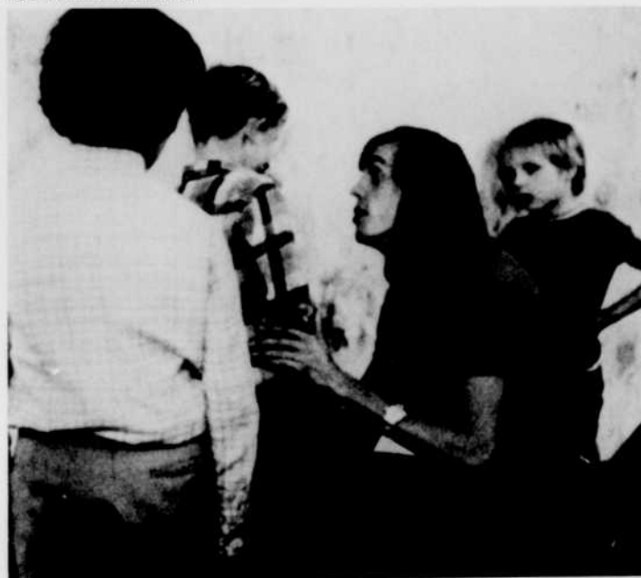
Les Belles Manières